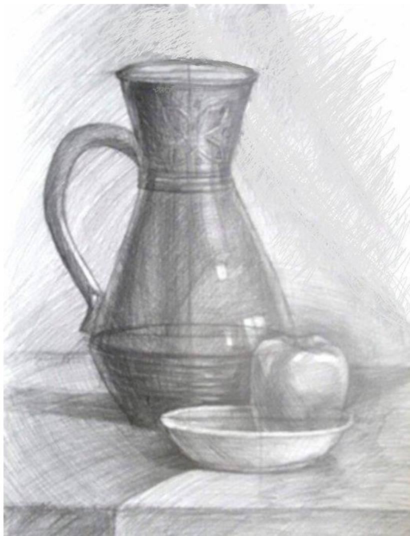
Рисунок 6. Работа, получившая высокую оценку. Небольшие ошибки при конструктивном построении формы не повлияли на общее хорошее впечатление от работы.