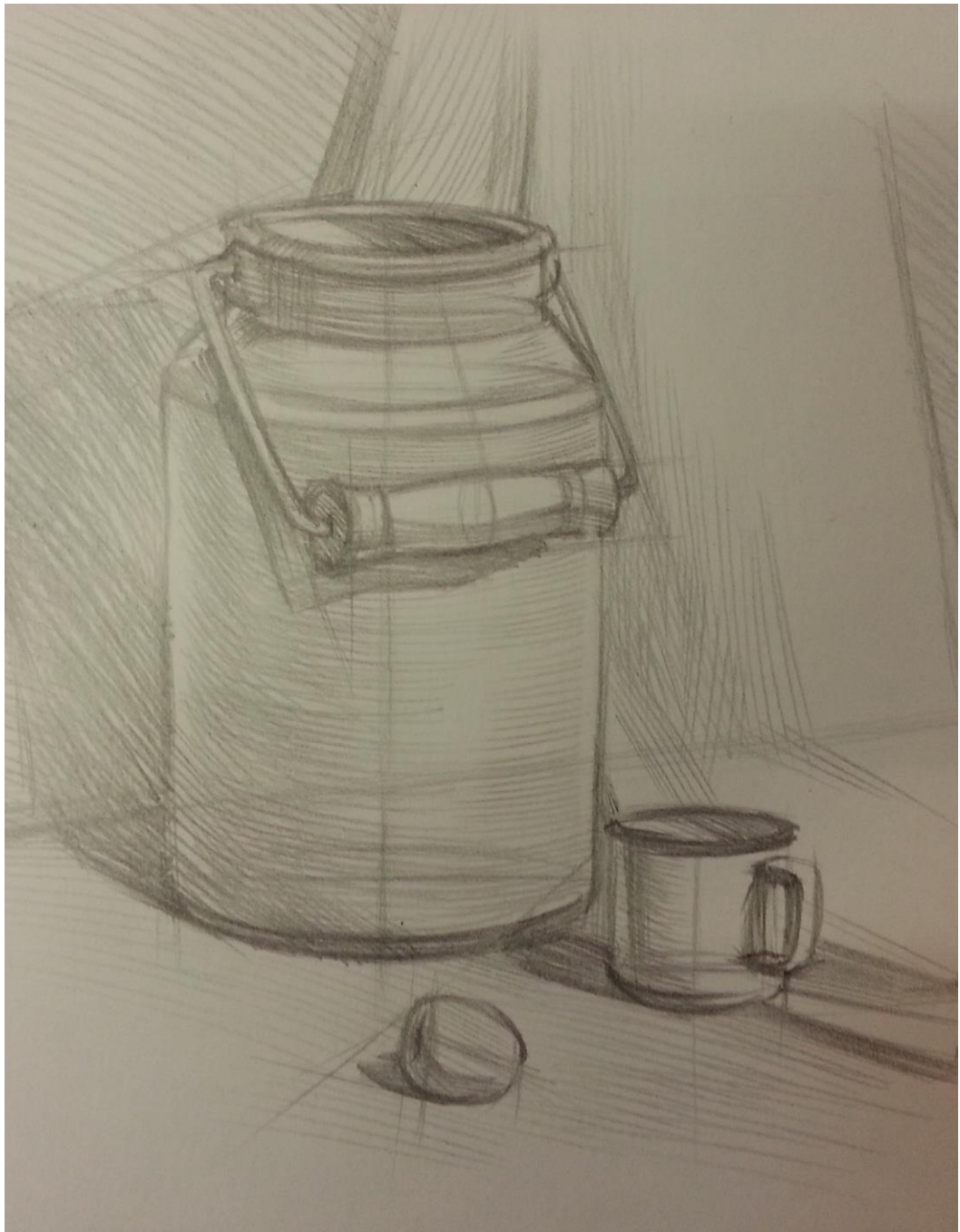
Рисунок 1. Работа, получившая высокую оценку. Небольшие недоработки при тоновом решении предметов быта не повлияли на общее хорошее впечатление от работы.