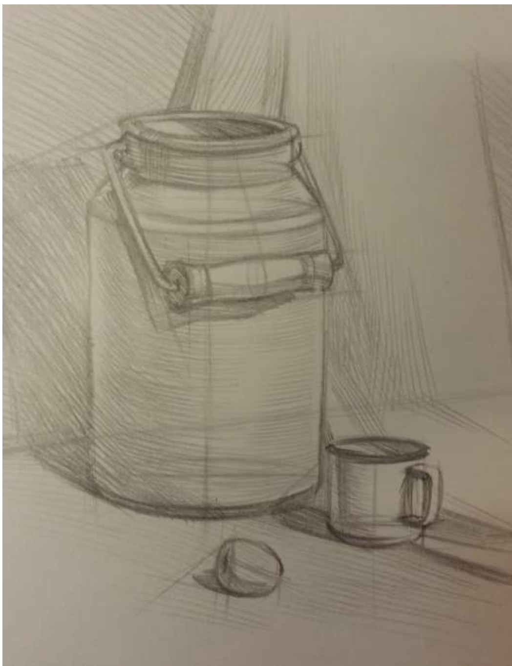
Рисунок 1. Работа, получившая высокую оценку. Небольшие недоработки при тоновом решении предметов быта не повлияли на общее хорошее впечатление от работы.