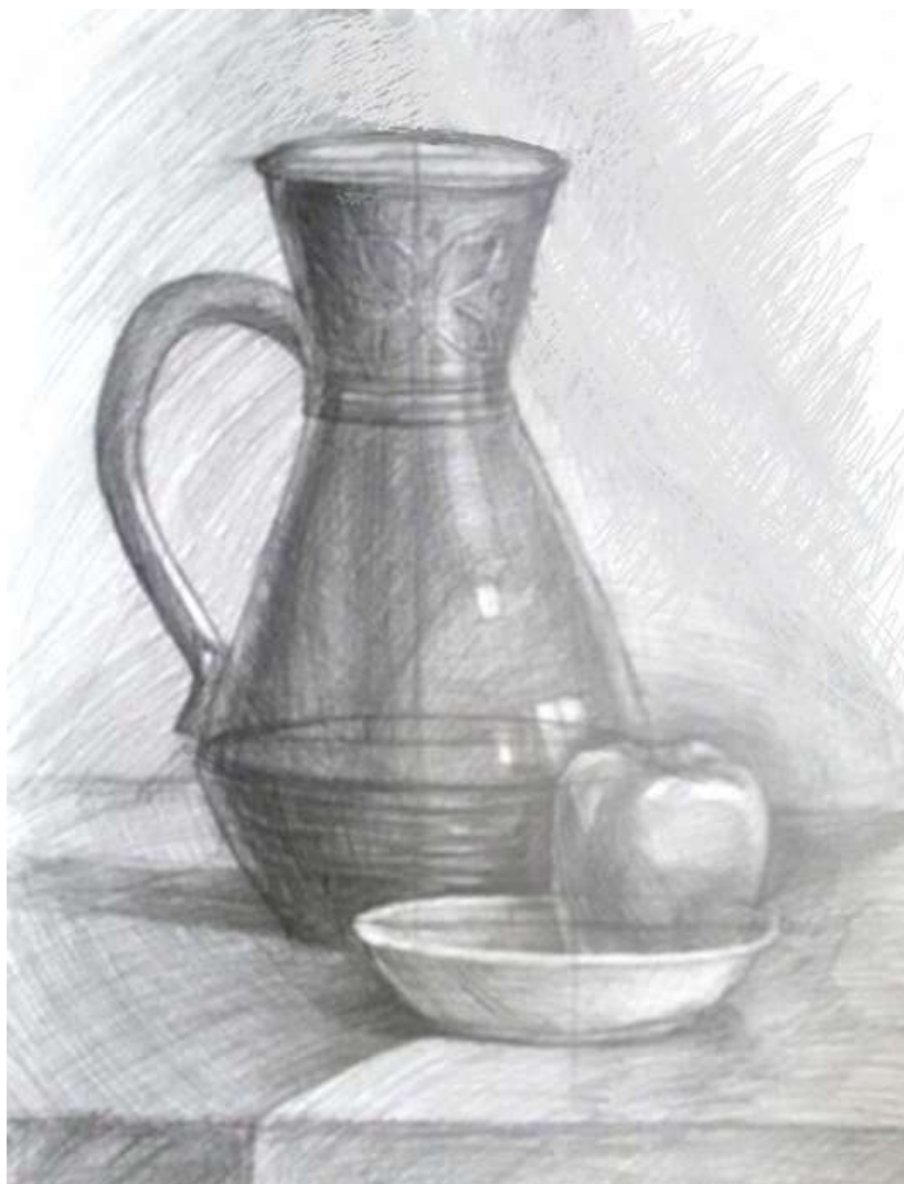
Рисунок 6. Работа, получившая высокую оценку. Небольшие ошибки при конструктивном построении формы не повлияли на общее хорошее впечатление от работы.