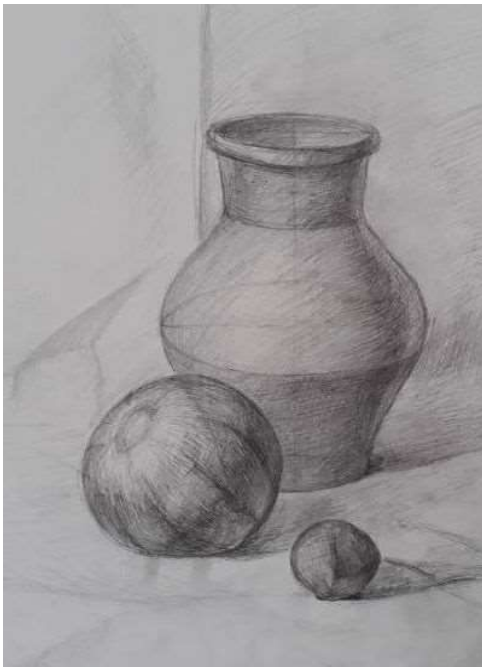
Рисунок 3. Работа, получившая не высокую оценку. Небольшие ошибки при композиционном и тоновом решении предметов быта не повлияли на общее хорошее впечатление от работы.