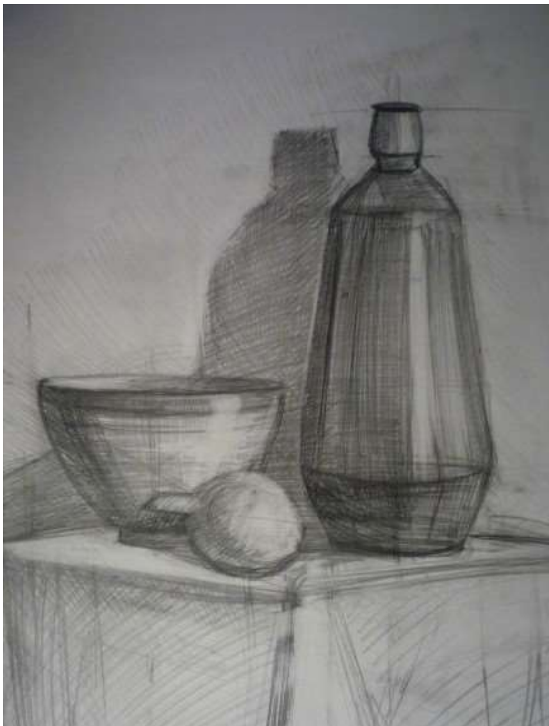
Рисунок 5. Не смотря на неточности пропорций предметов быта, работа получила высокую оценку.