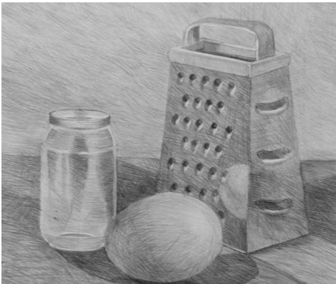
Рисунок 2. Работа, получившая хорошую оценку. Небольшие ошибки при композиционном решении предметов быта не повлияли на общее хорошее впечатление от работы.