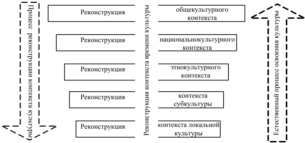
Рис. 2. Уровни реконструкции контекста культуры

Основываясь на трёх группах признаков, характерных для любой функционирующей культуры, выделенных С.В. Ивановой [3] (общие неспецифические, относительно специфические и абсолютно специфические), исходя из естественного познания окружающего мира человеком, которое происходит от частного к общему, т. е. от локальной культуры к глобальной мировой, а также принимая во внимание уровни реконструкции, описанные выше, выделяем шесть уровней реконструкции контекста культуры в учебных целях (рис. 2):