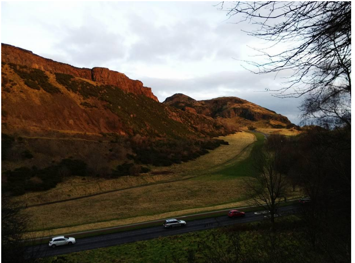
The Arthur Seat