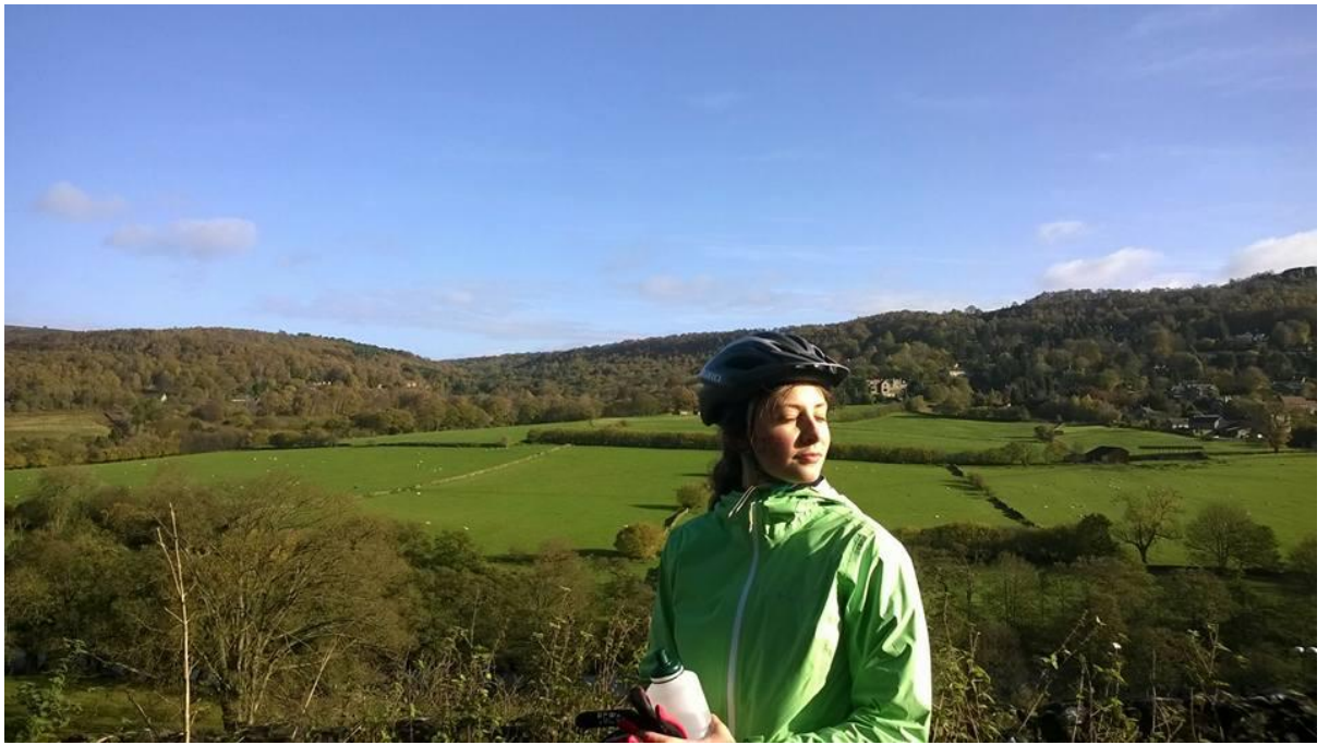
The Peak District