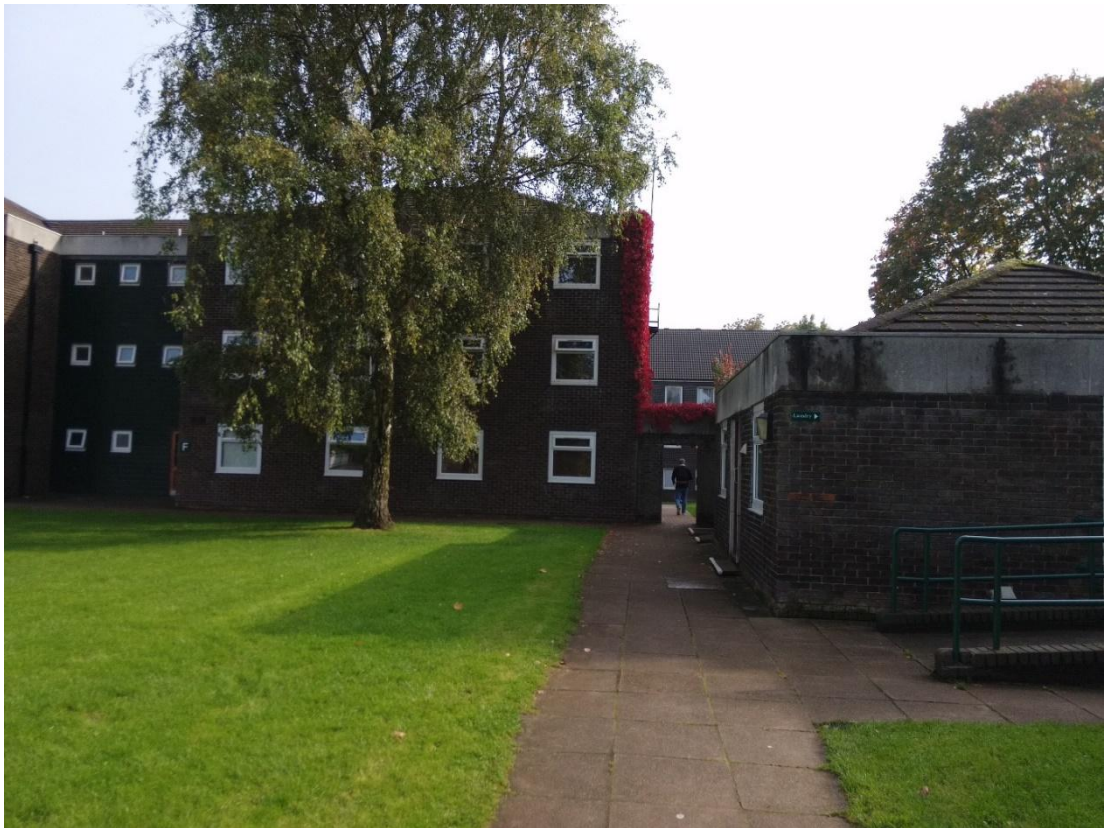
Sherwood Hall, University Park