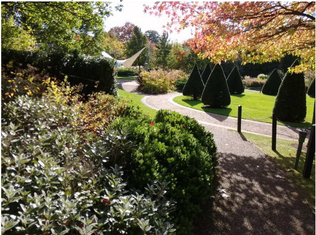
Millennium Park at the University Park