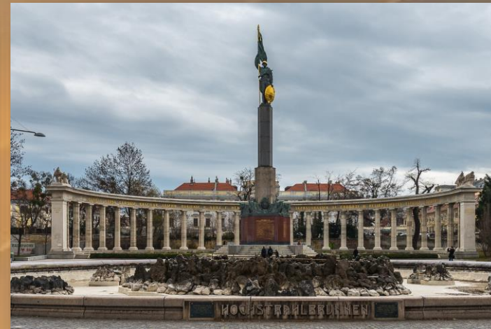
Памятник Советским воинам-освободителям в Вене