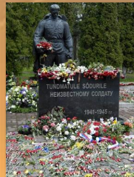
Памятник "Бронзовый солдат" в Таллине