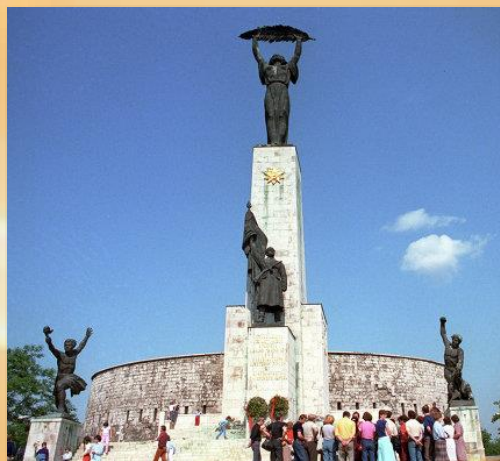
Монумент свободы на горе Геллерт в Будапеште