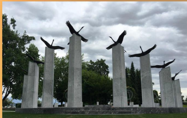
Сынам России и Советского Союза в Словении