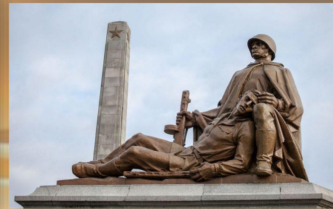
Памятник советским воинам в Польше