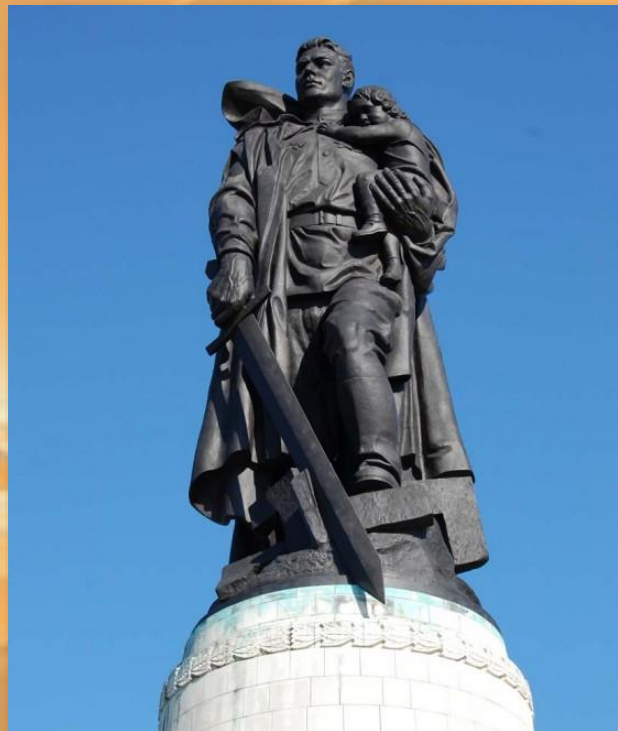
Монумент «Воин-освободитель» в Трептов-парке, Берлин