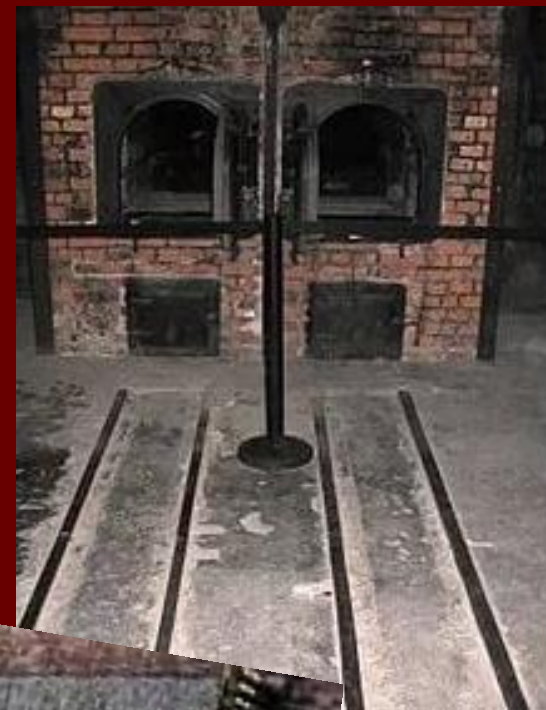
Сохранившиеся печи крематория