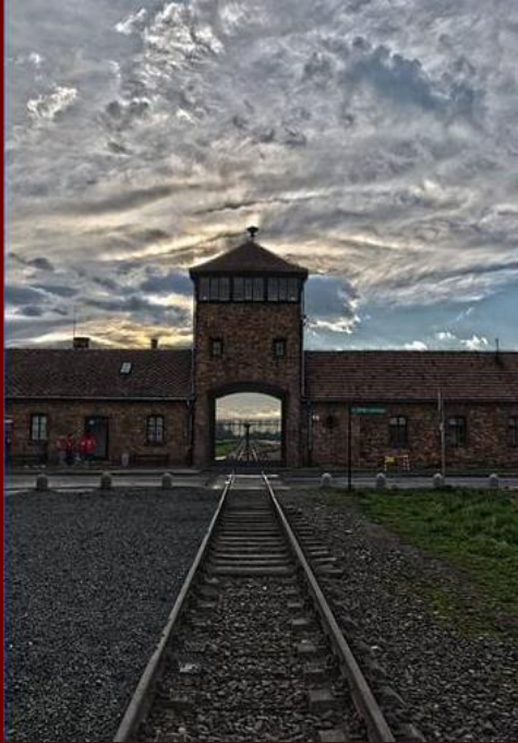
Главные ворота лагеря