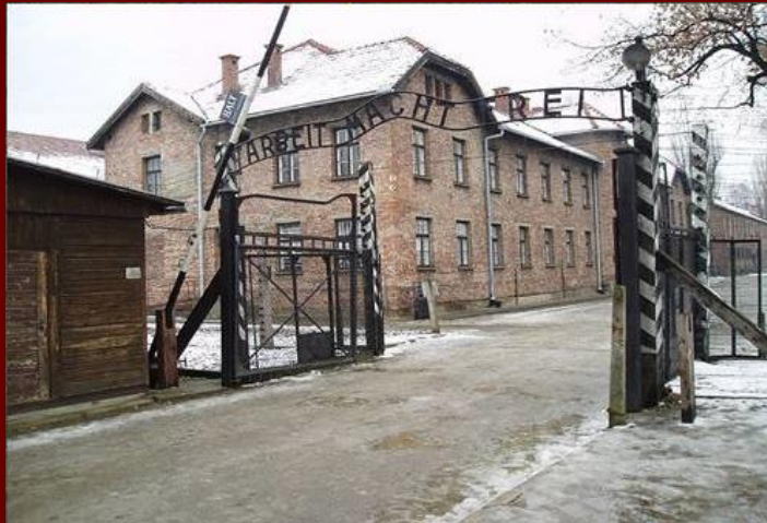
Музей на территории лагеря, посвященный памяти узников Освенцима (Польша)

Освенцим – комплекс немецких концлагерей и лагерей смерти, располагавшийся в 1940 – 1945 годах около города Освенцим, который в 1939 году указом Гитлера был присоединен к территории Третьего рейха, в 60 км к западу от Кракова (Польша).