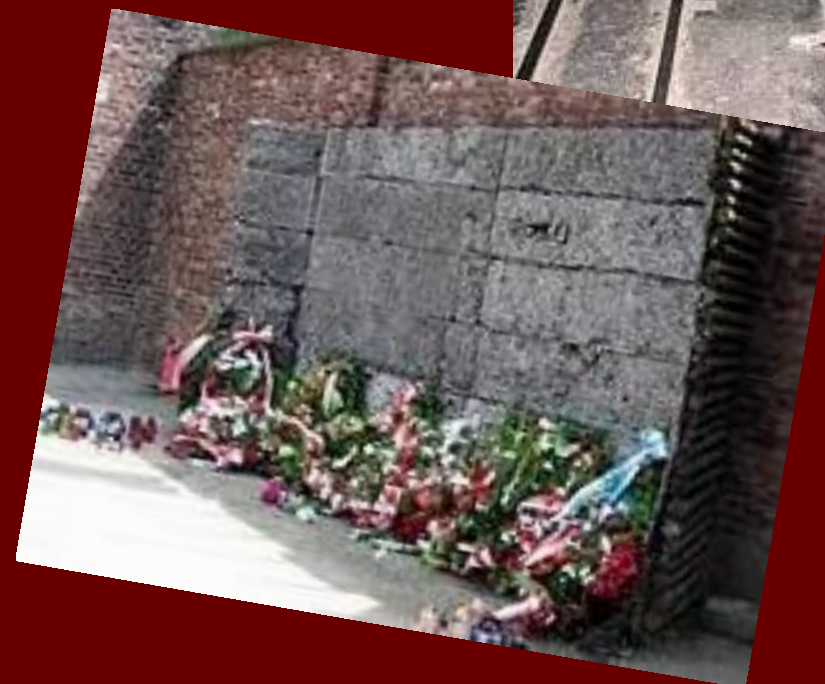
Стена казни. Освенцим.