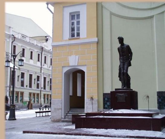
Москва. Памятник А.П. Чехову в Камергерском переулке

Весь день на абонементе сотрудники библиотеки предлагают своим читателям в память об А.П. Чехове взять его книги и окунуться в светлый, добрый, искренний и благородный мир выдающегося мастера короткого рассказа.