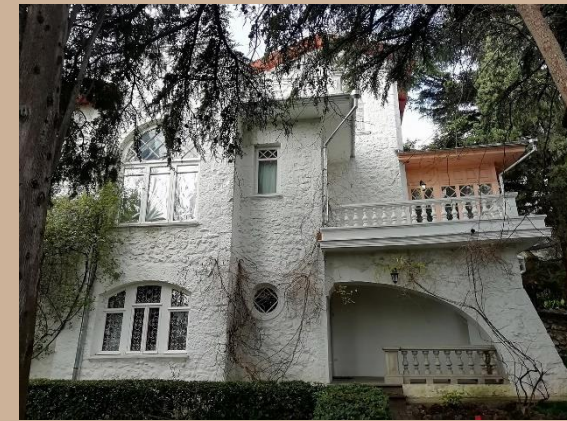
Дом-музей А.П. Чехова в Ялте http://yalta-museum.ru/

3 июня 1904 года А.П. Чехов скончался. Похоронен он на Новодевичьем кладбище столицы.