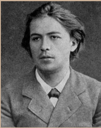
Студент Антон Чехов фото (1881)