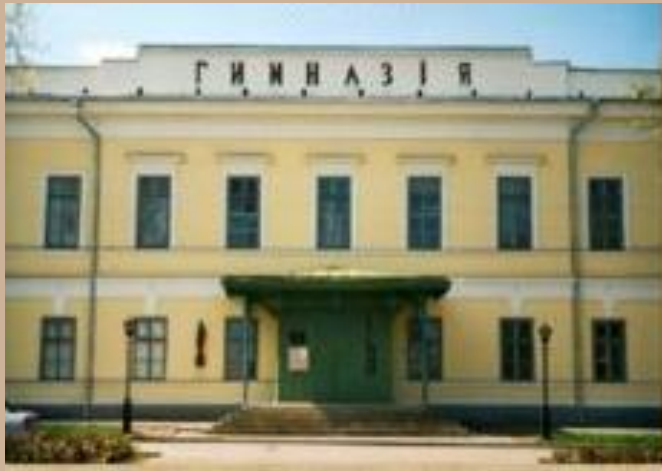
Мужская гимназия в Таганроге, где учился А.П. Чехов (1868)