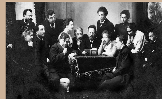
А. П. Чехов в группе студентов МХТ. Весна 1899 г. Москва