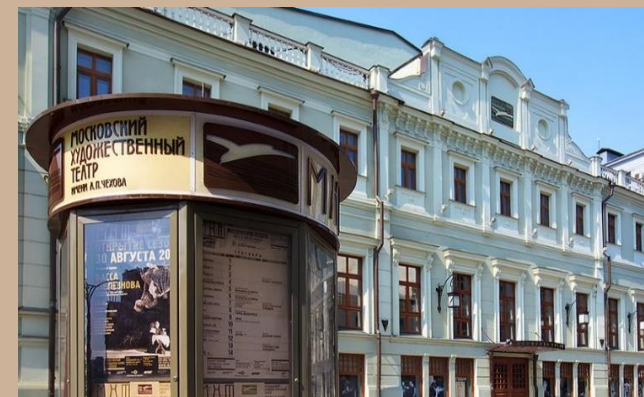
Московский художественный театр имени А. П. Чехова https://mxat.ru/