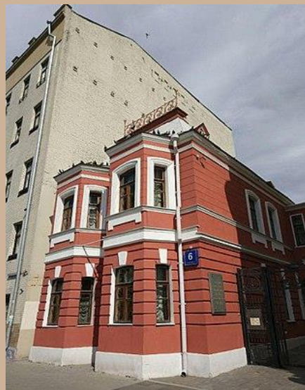
Дом-музей А.П. Чехова на Садово-Кудринской улице в Москве