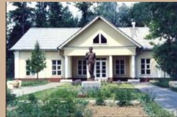
Мелихово. Кабинет писателя

https://chekhovmuseum.com/museum/branches/melikhovo-school/