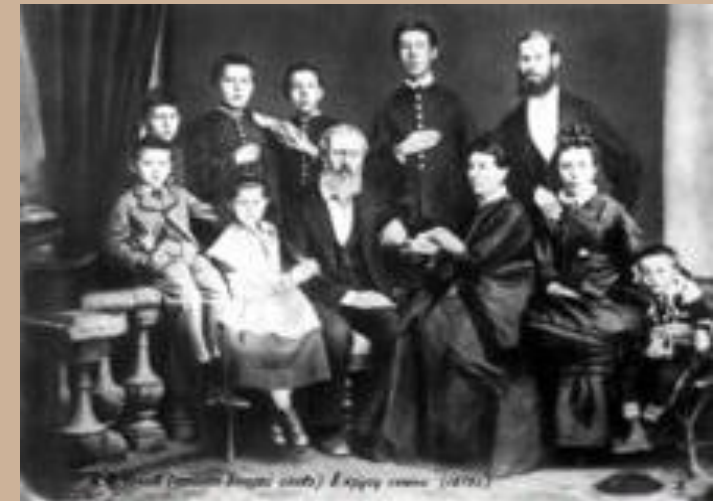
Большая многодетная семья А.П. Чехова (1874)

Именно в гимназии проявился писательский талант Антона Чехова. Он много пишет: водевили и драмы, очерки и юморески, участвует в создании гимназического журнала.