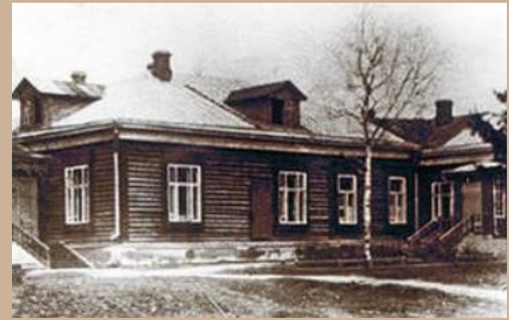
Звенигородская уездная больница, где работал А.П. Чехов в 1884-1885 г.

С 1887 года Чехов начал пробовать себя в более серьезных жанрах и темах. Переломным произведением в творчестве писателя стала повесть «Степь» для журнала «Северный вестник». Из печати выходят его сборники «В сумерках», «Невинные речи», «Хмурые люди», принесшие Чехову большую известность.