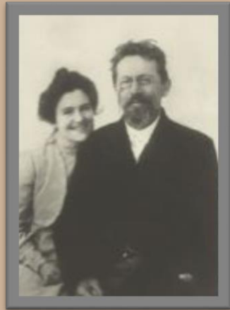
А.П. Чехов женой О.Л. Книппер (1901)