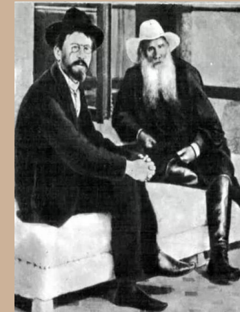
Л.Н. Толстой в гостях у Чехова в Ялте.

Для Ольги Книппер, ведущей актрисы МХТ, Чехов будет писать пьесы «Три сестры», «Вишневый сад» и др.