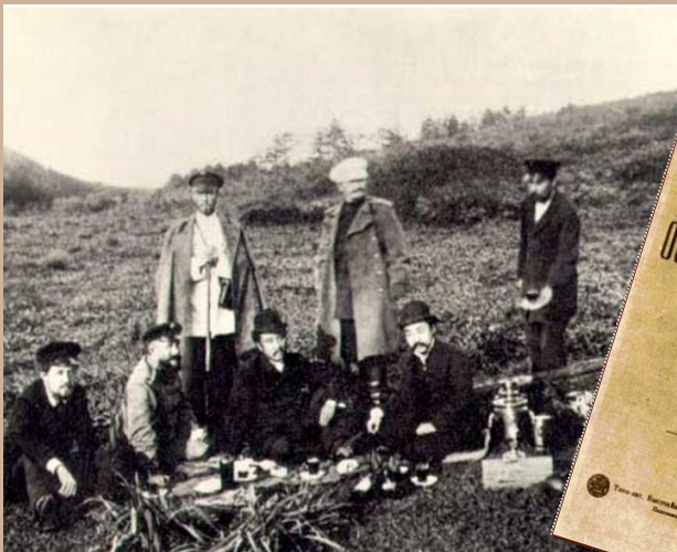
А.П. Чехов на Сахалине. 1890 г.

К этому времени Чехов становится одним из самых читаемых писателей России, в журналах выходят отдельные издания и сборники, печатаются такие шедевры, как «Попрыгунья», «Рассказ неизвестного человека», «Человек в футляре», «О любви», «Крыжовник», «Ионыч» и др.