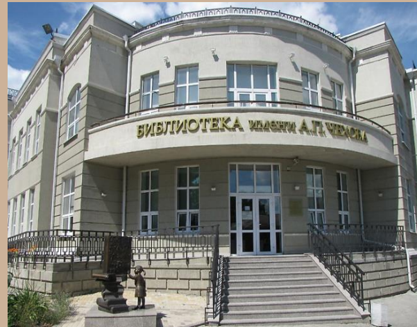
Библиотека им. А.П. Чехова в Таганроге (ул. Петровская, 96)