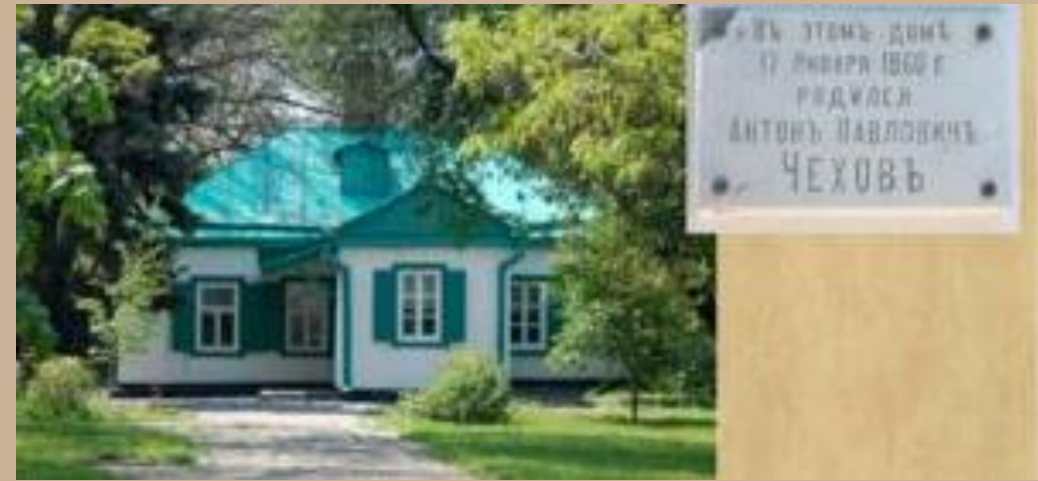
Таганрог. Полицейская улица, 69 (дом, где родился А.П. Чехов)