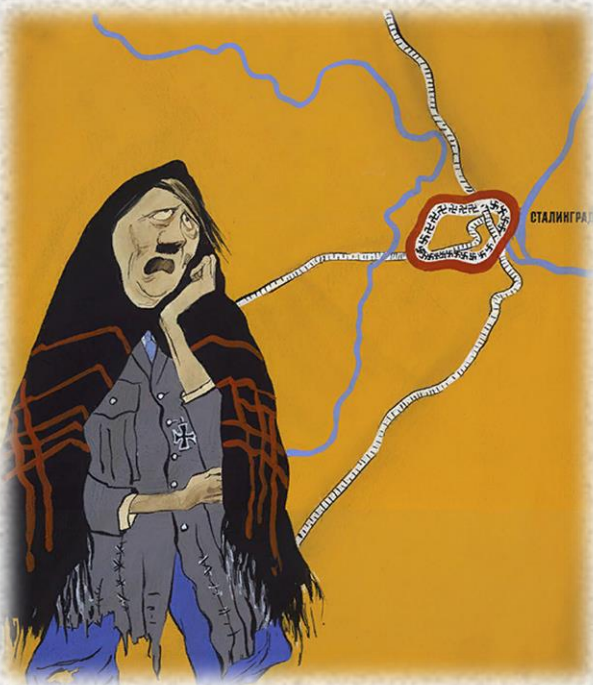
Кукрыниксы. Потеряла я колечко. 1943 г. плакат

В годы войны создавались многочисленные АНЕКДОТЫ и переделки старых анекдотических сказок. В народных произведениях этого времени присутствовали афоризмы и лозунги , сатирически использовалось вражеское личное имя «Фриц» как нарицательное.