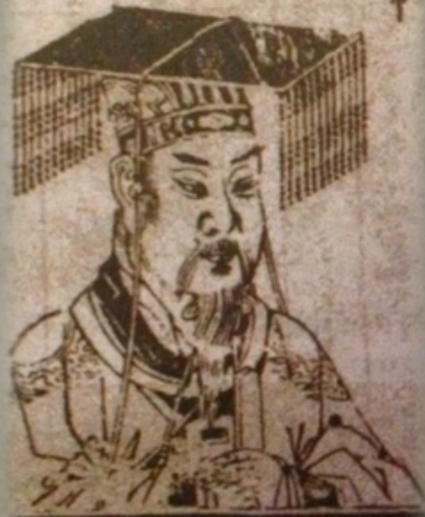
【第9圖】王圻，三才圖會，黃帝