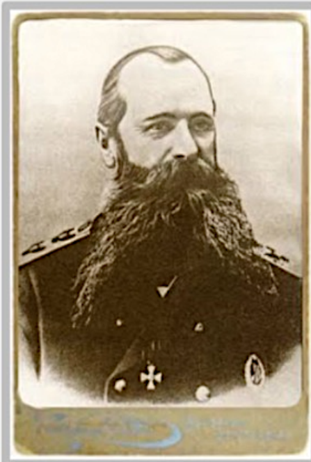
Фрагмент гравюры «Великая победа Великого Императорского флота Японии, ура!», 1904 и фотография адмирала Макарова

Японский поэт Исикава Такубоку об адмирале Макарове: