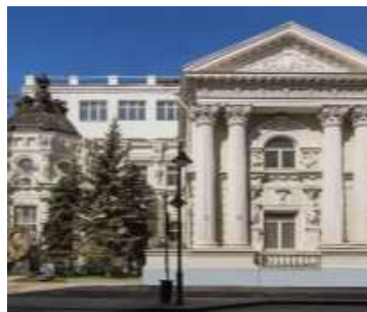
Особняк фон Рекк

Ленинградский пр- т, д.40, Москва Пешком от метро Динамо