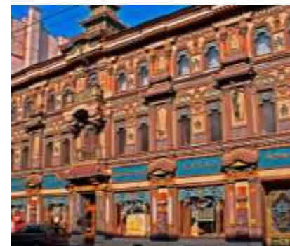
Чайный дом на Мясницкой

Большая Сухаревская пл., д.3, стр.1, Москва Пешком или на автобусе М2 от метро Сухаревская