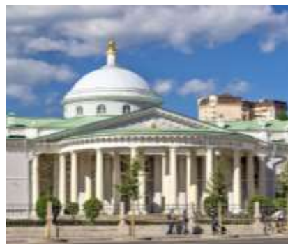
Дом Графа Шереметева

Ул. Воздвиженка, 3/5, стр.1, Москва Пешком от станции Боровицкая