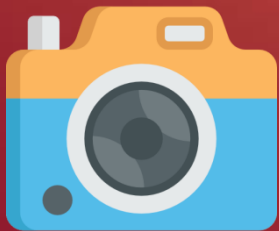
Работа с фототехникой

Фотосъемка – это не единственная часть рабочего процесса. Фотограф должен уметь работать с тз, находить локации, искать правильный свет, разбираться в технических характеристиках своей фототехники и правильно ее настраивать.