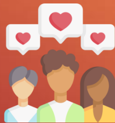
Работа с клиентами