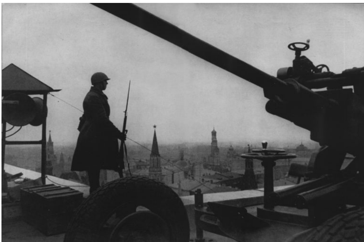
Выносной пост противовоздушной обороны на крыше гостиницы «Москва».