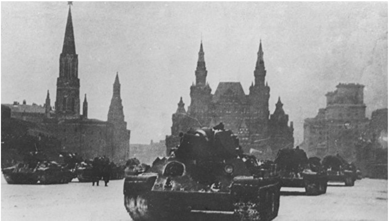
Колонна танков проходит по Красной площади во время военного парада, посвященного празднованию 24-й годовщины Великой Октябрьской социалистической революции. Автор В. А. Малышев. 7 ноября 1941 года. Главный архив Москвы.