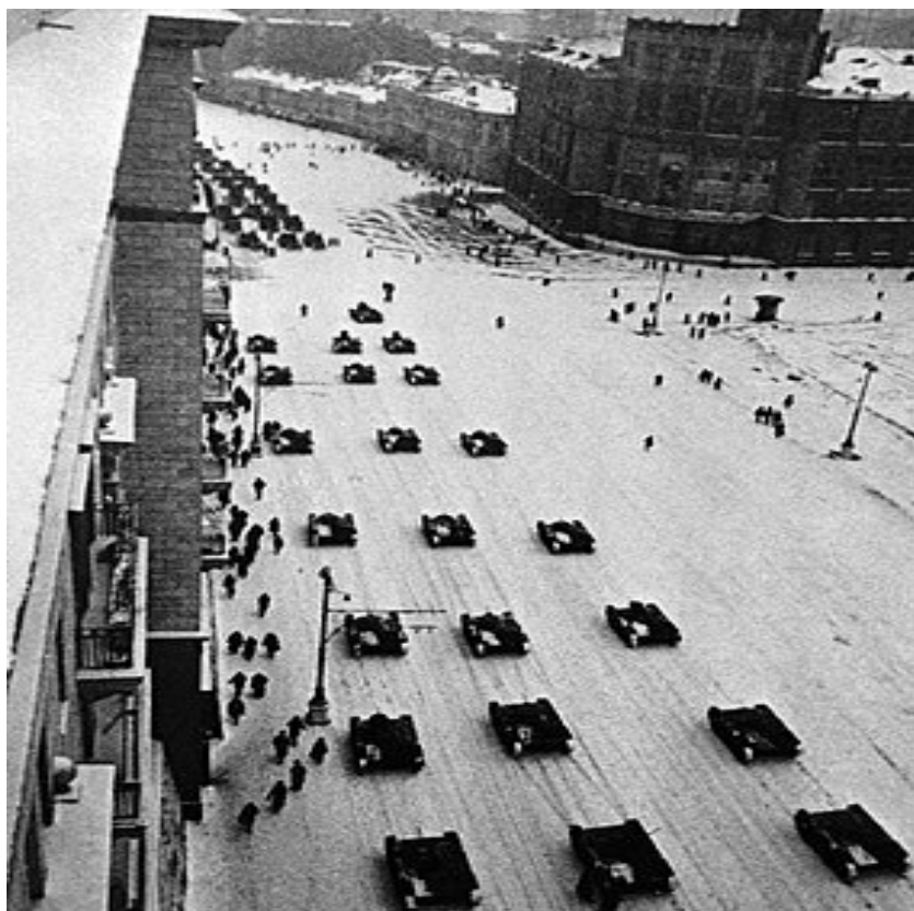
Танки на ул. Горького, идущие после парада на фронт.