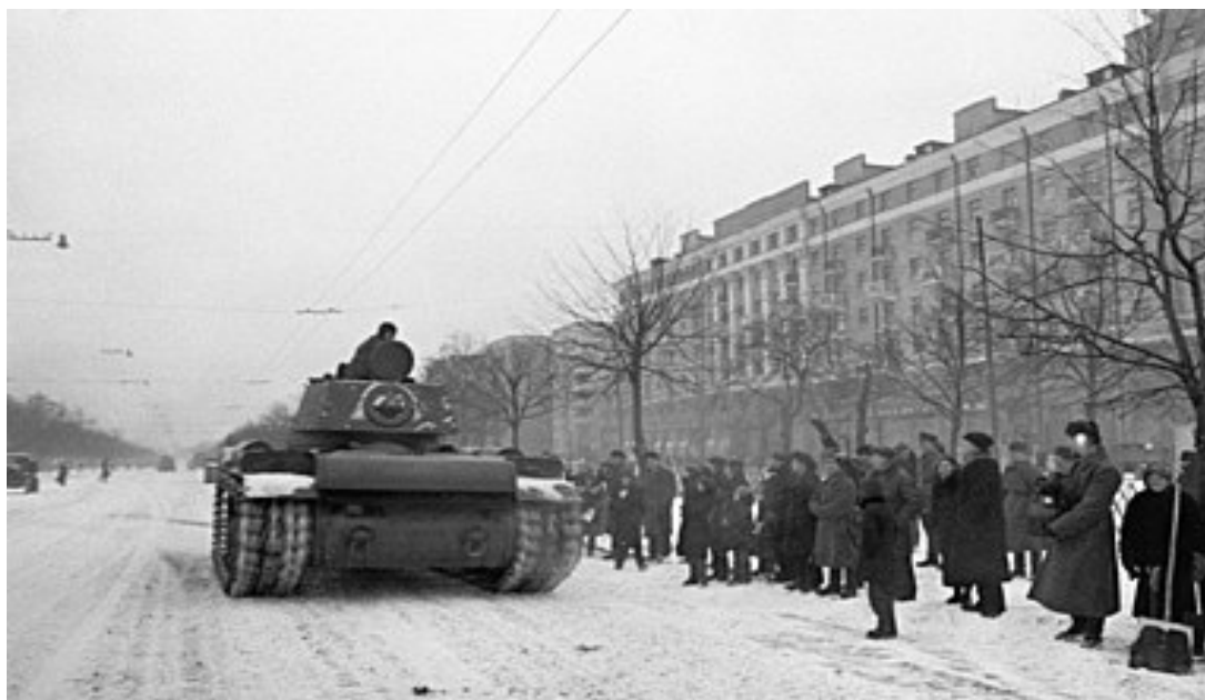
Проводы войск на фронт.

Бондаренко А. Ю., Ефимов. Н.Н. Москва на линии фронта. М: изд-во Вече, 2016. С. 21–24.