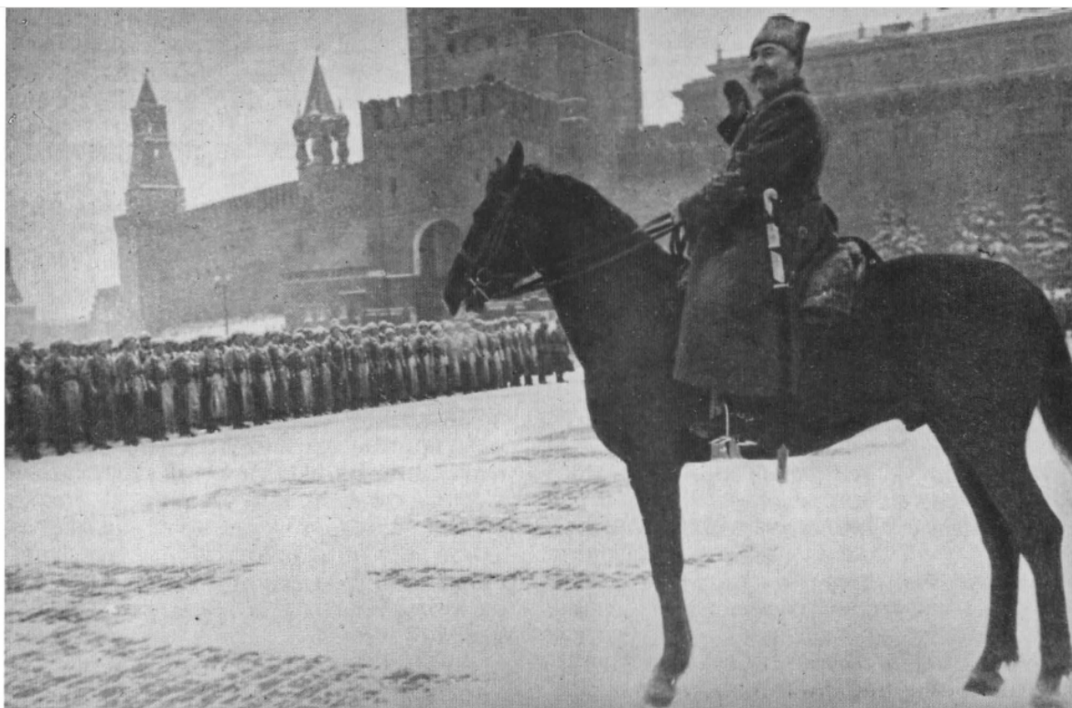
С.М. Будённый принимает парад

Горинов М.М. Москва Прифронтовая. 1941–1942. Архивные документы и материалы. М.: Изд-во объединения «Мосгорархив», 2001. С. 295–296.