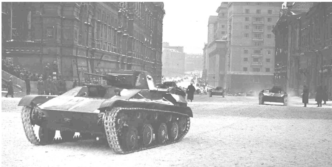
Колонна танков направляется к Красной площади для участия в военном параде, посвященном празднованию 24-й годовщины Великой Октябрьской социалистической революции. Автор В. А. Малышев. 7 ноября 1941 года. Главный архив Москвы.