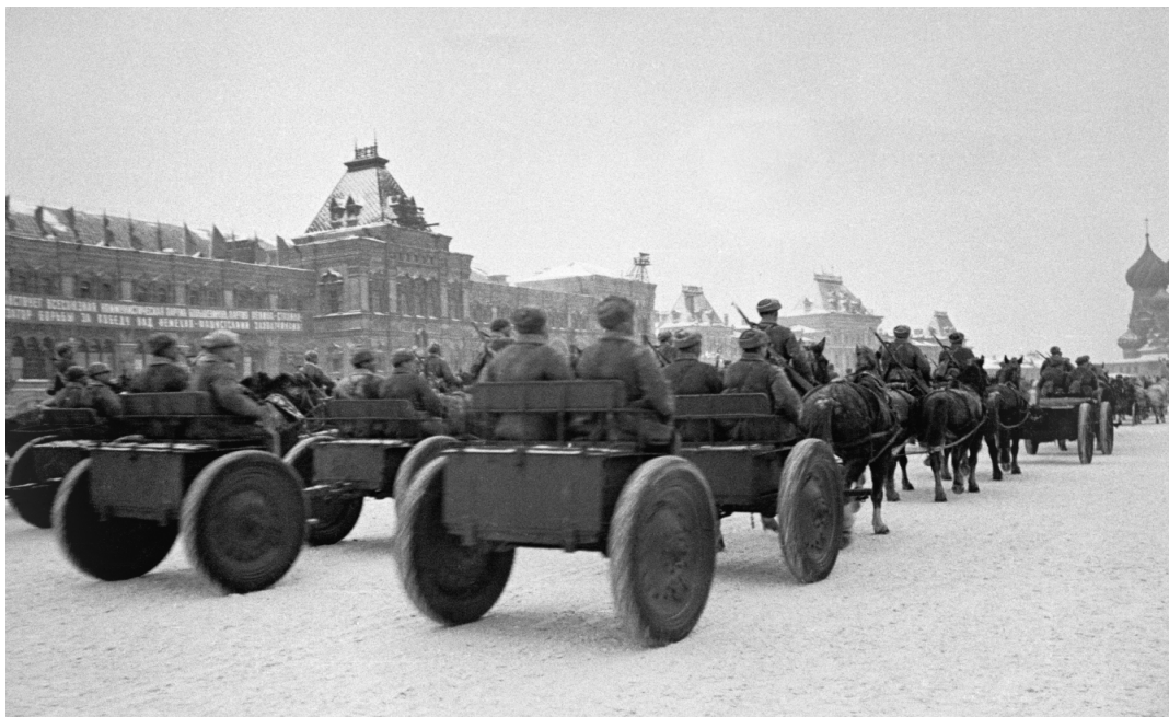
Войска идут по Красной площади.