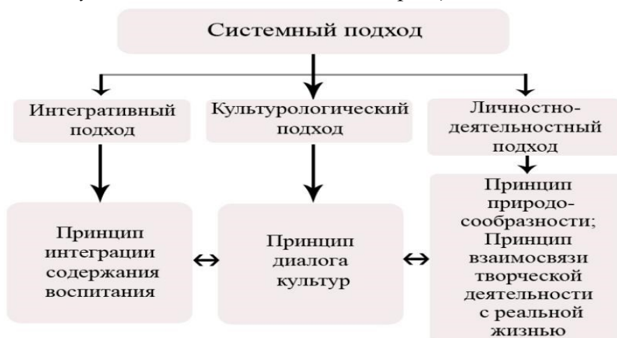
Рисунок 1. Взаимосвязь подходов и принципов «Системы»

В составе Методологического компонента модели – обоснованные на основе анализа теоретических предпосылок интеграции естественнонаучной и гуманитарной образовательных областей методологические подходы: системный, интегративный, культурологический, личностно-деятельностный, отвечающие современным требованиям педагогической теории и практики (представлены на Рисунке 1).