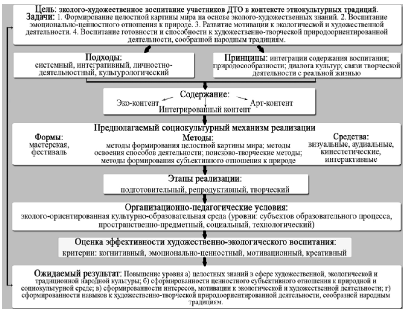
Рисунок 2. Модель системы эколого-художественного воспитания участников детского творческого объединения в контексте этнокультурных традиций

Экспериментальная группа (ЭГ) была сформирована на базе детского творческого объединения ГБОУ г. Москвы ЦПМСС «Радинец» из 46 участников, детей 6-8 лет. Контрольная группа (КГ) сформирована из читателей московских библиотек экологической направленности (46 человек), детей 6-8 лет.