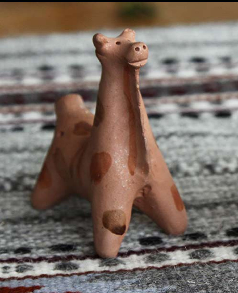
Плешковский промысел пришёл из деревни Плешково (Ливенский уезд Орловской губ.), а известно оно говорят с XVII в. детям на потеху да себе на радость делали игрушки-свистульки. Узнать ее просто, по «проблескам», глина в этих местах розовая после обжига, с блестящими вкраплениями слюды.