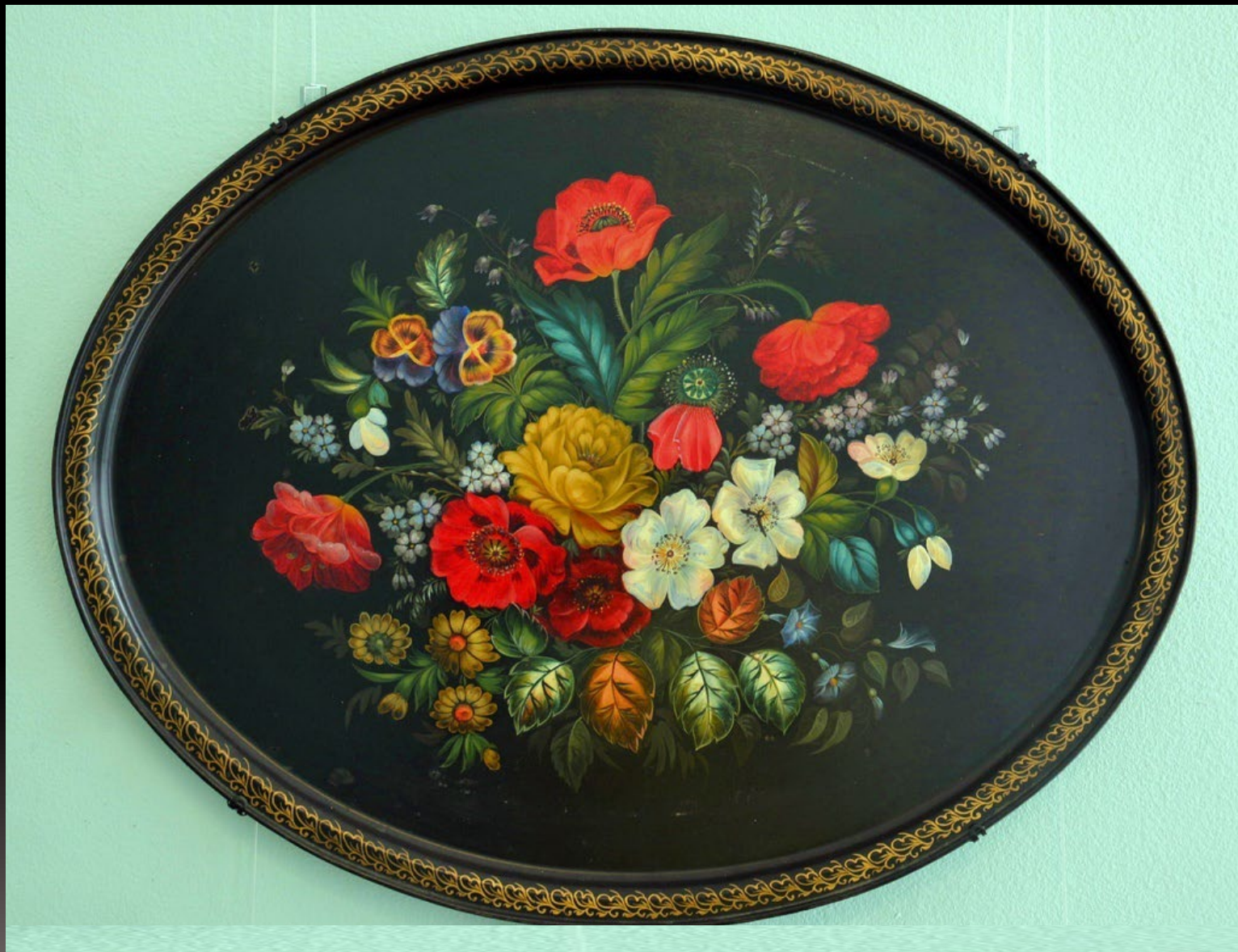
Цветы. П.И. Плахов. 1957 г. Металл, масло, бронза, лак Собрание музея Жостова. Россия