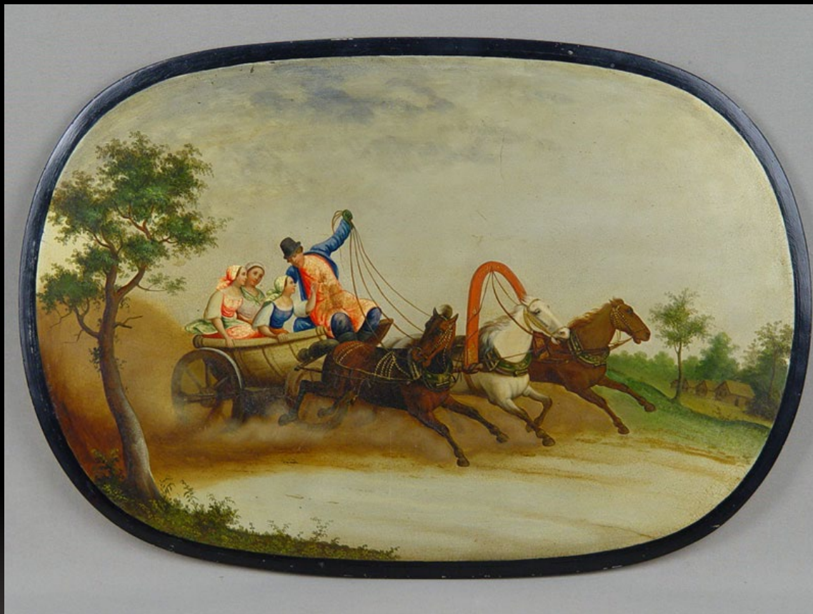
Панно «Тройка» (31×45 см). Папье-маше, лаковая живопись Фабрика Лукутиных. Начало XX в.