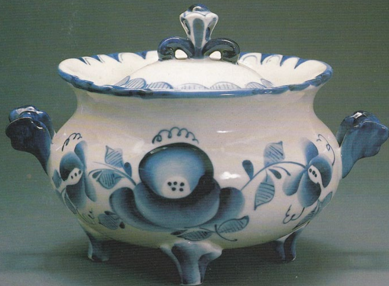
Квасник. Гжель. 2 половина XX в.