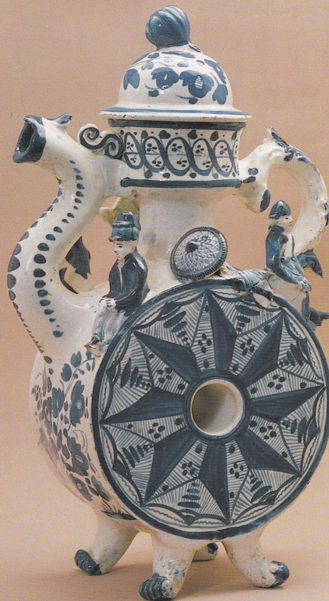
Полуфаянс. Гжель. Начало XIX в.