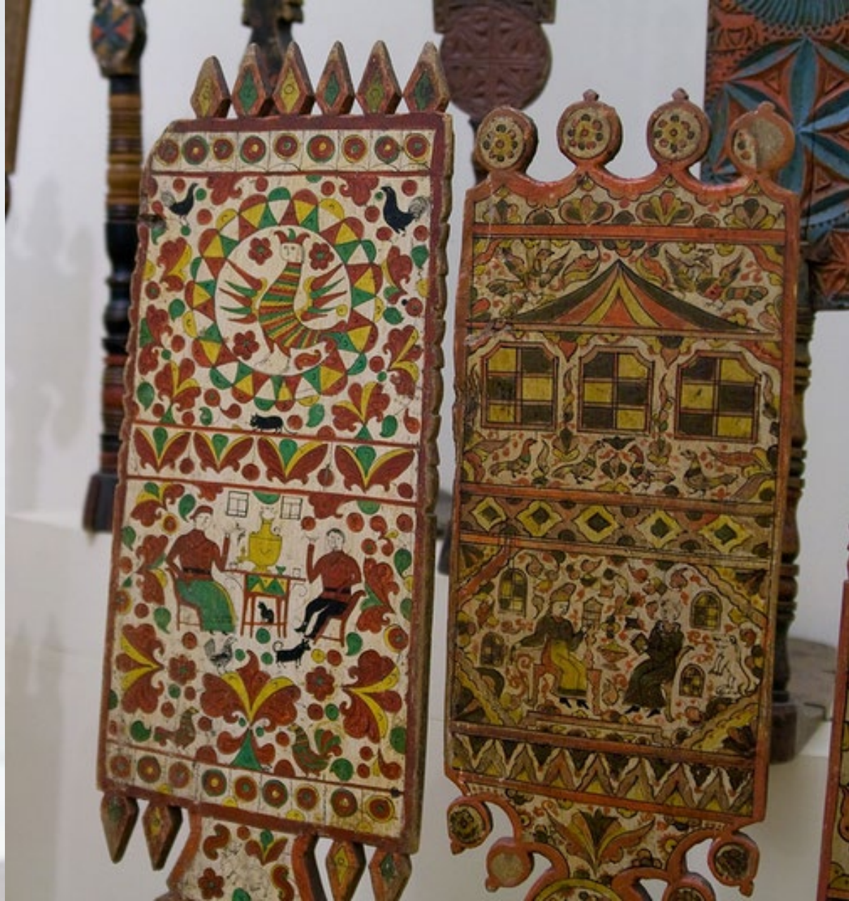
Деталь росписи прялки. Дерево; резьба, левкас, роспись Мастер Я.В.Ярыгин. Первая половина XIX в. Пермогорье. Вологодской губ.

Государственный Русский музей. Санкт-Петербург. Россия