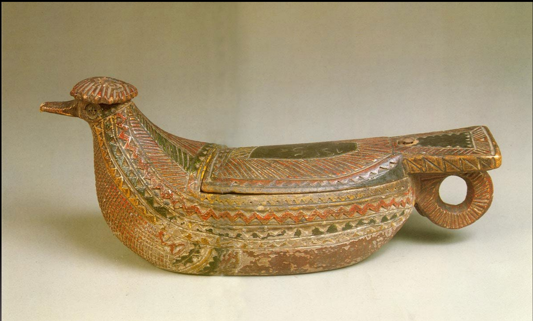
Утка-солоница. Резьба по дереву, раскраска Север России. 1815 г.

Художественная роспись Севера объединила в себе художественный опыт карел, финнов, вепсов и славян. Сюжеты рисунков резьбы нередко оттачивались мастерами на протяжении нескольких столетий и передавались из поколения в поколение.