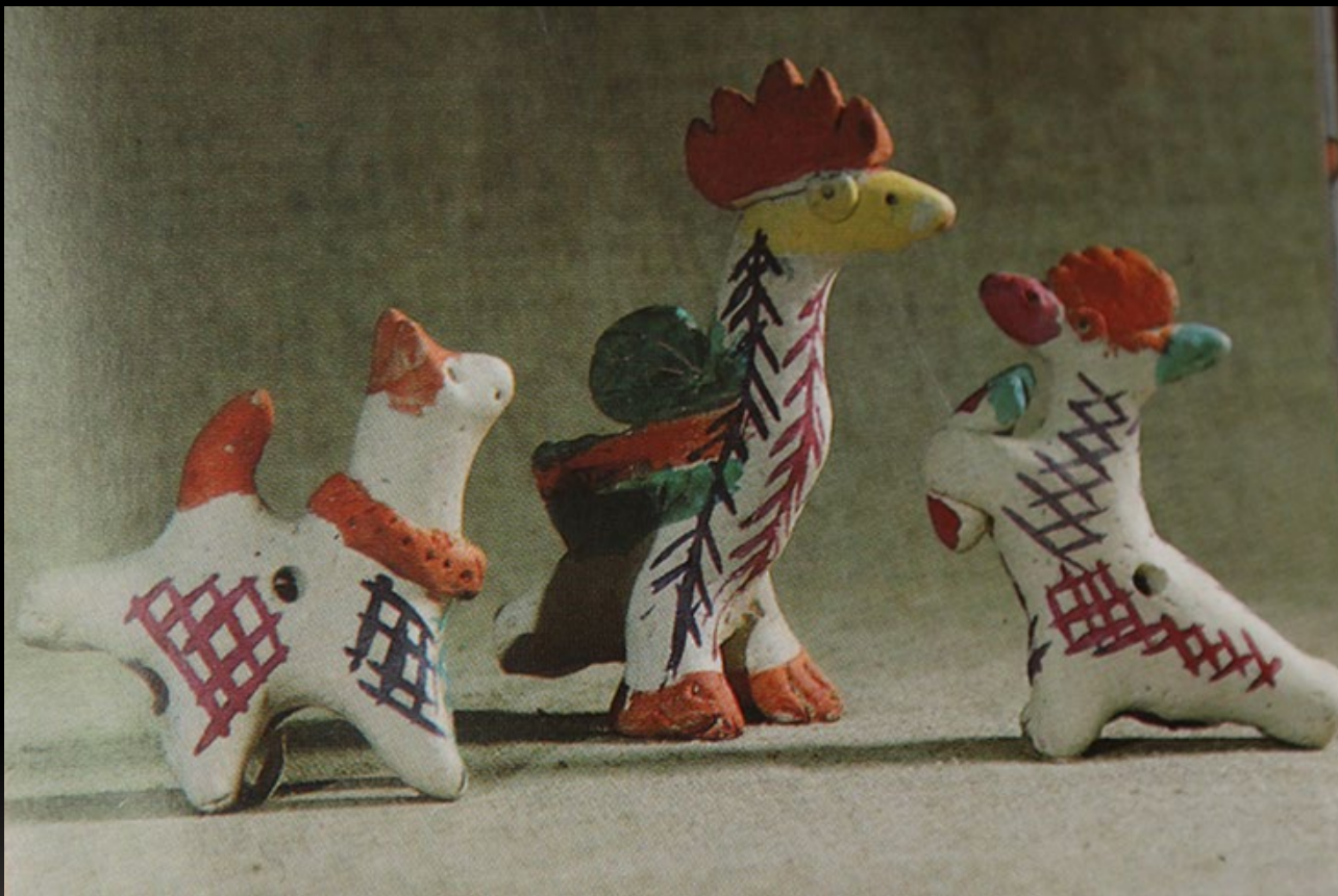
Кожлянская игрушка из Курска, зародилась в деревне Кожля Курской области

Ее отличие от других глиняных игрушек в том, что это, прежде всего, игрушка - свистулька.