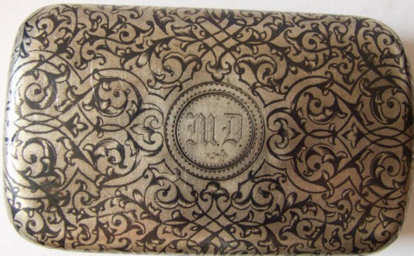
Табакерка «Тройка». Конец XIX- начало XX вв. И. Жилина Экспонаты выставки «Шедевры Северной черни XVIII – начала XXI в. Традиции и современность»

Уникальный народный художественный промысел изготовления серебряных изделий возник в городе Великий Устюг во второй половине XVII в.