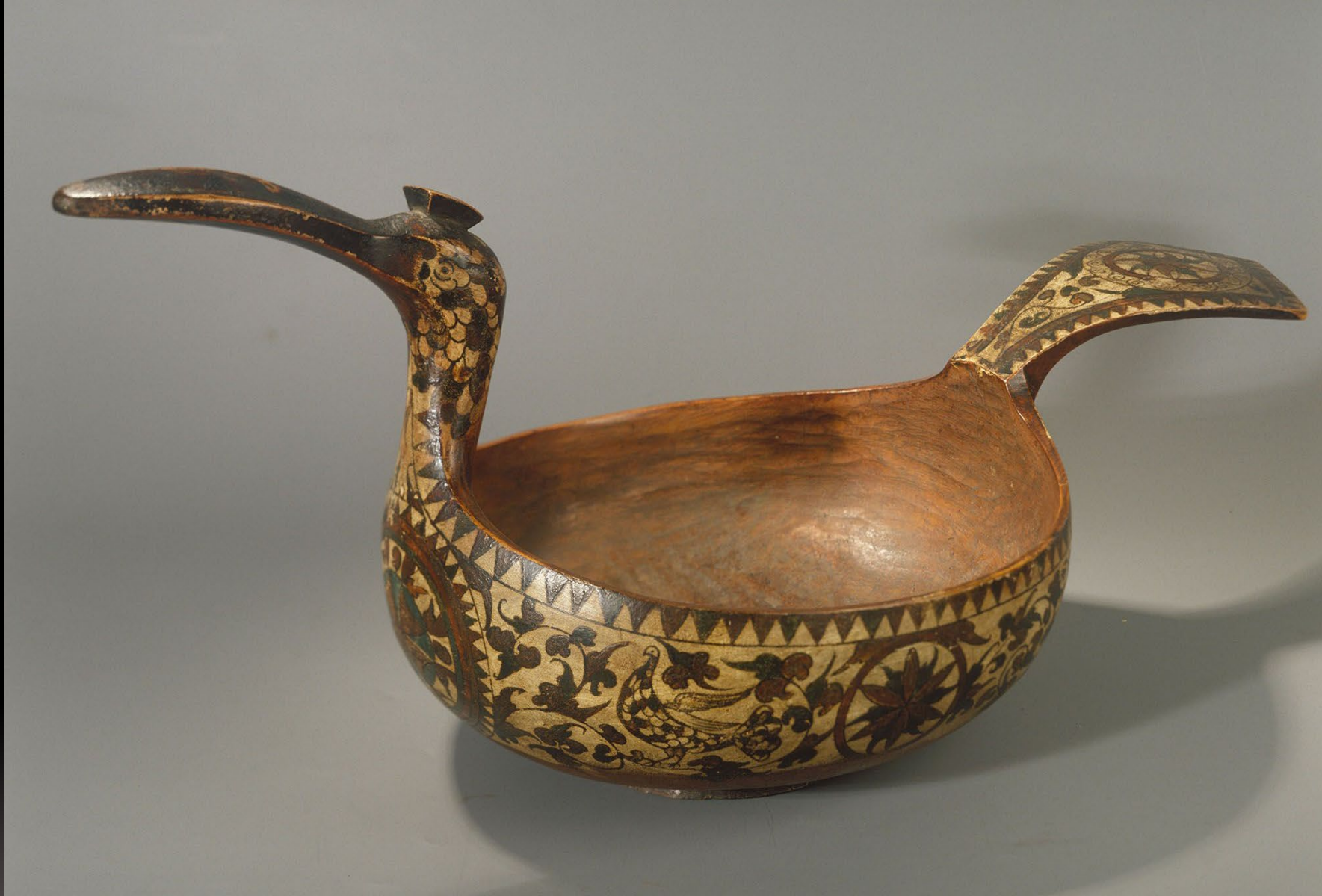
Скопкарь. Дерево, долбление, резьба, роспись Пермогорье. Северная Двина. Первая половина XIX в. Всероссийский музей декоративного и народного искусства. Москва. Россия

Наиболее развитой и по составу расписываемых предметов, и по содержательности и разнообразию форм орнамента признана Пермогорская роспись. Декоративный стиль ее развивался под сильным влиянием устюжских эмалей, устюжского чернения по серебру, резьбы по бересте, расписной финифти Сольвычегодска. На нем отразилось все великолепие и роскошь "травного барокко".