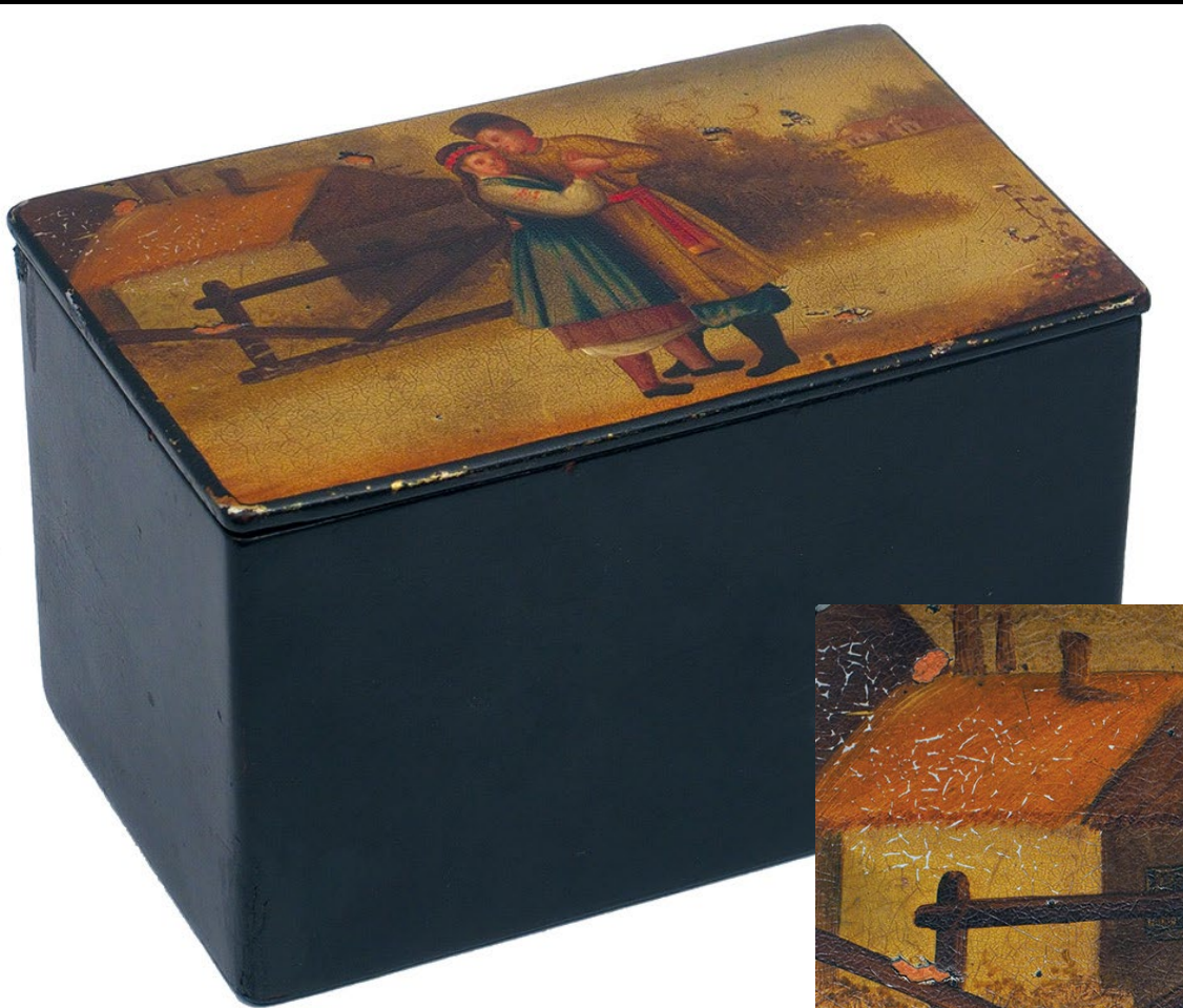
Шкатулка «Свидание» (14х9х8 см). Папье-маше, роспись Фабрика лаковой миниатюры В.О. Вишнякова Россия. Вторая половина XIX в.