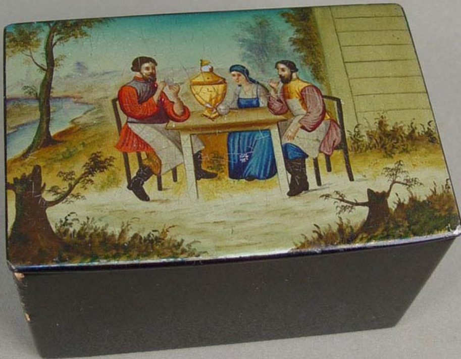
Шкатулка «Чашепитие» (9×9×14 см) Папье-маше, лаковая роспись Фабрика Вишнякова. Начало XX в.