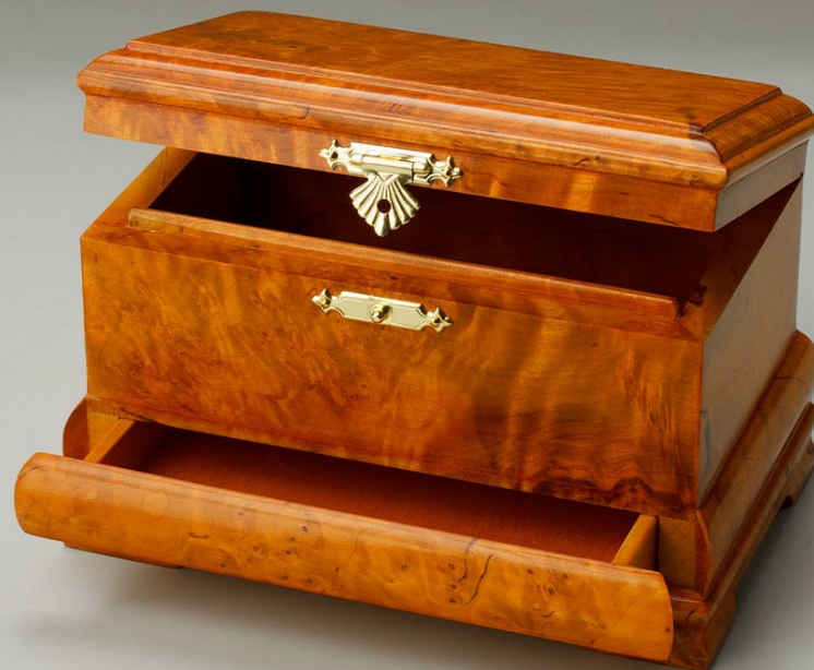
Чаша, шкатулки. Кап; резьба, столярная работа, шлифовка, лакирование Вятка. Кировская область. Россия. 1 половина XX в.

Всероссийский музей декоративного искусства. Москва. Россия