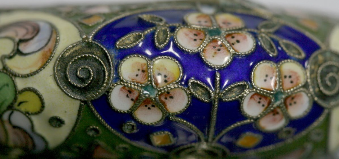
Пудреница в русском стиле Серебро, литье, полихромные эмали по скани, золочение Шестая Московская Артель. Москва. Россия. 1908-1917 гг.