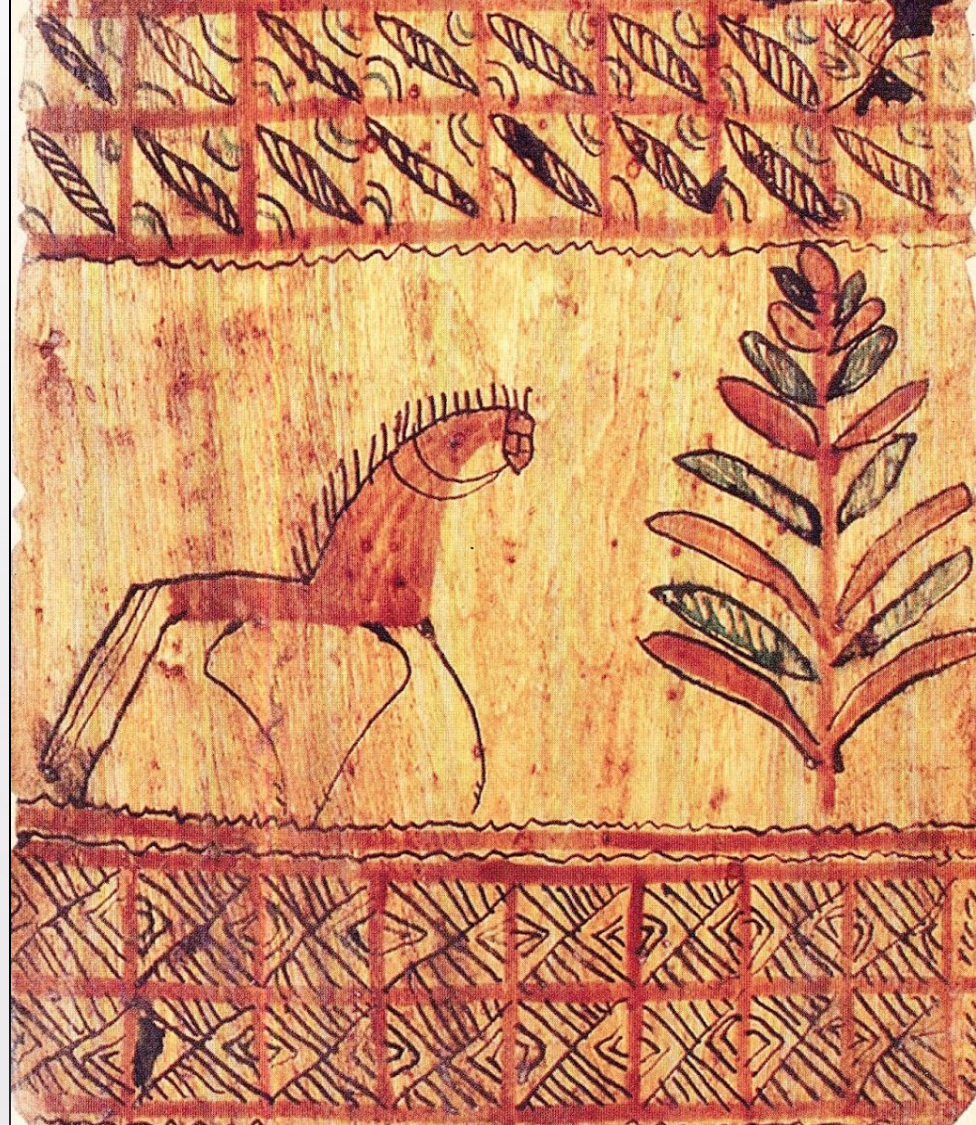
Прялка мезенская корневая (98,5×51,5×22,3 см). Дерево, краска, резьба, роспись Конец XIX - начало XX вв.

Кирилло-Белозерский историко-архитектурный и художественный музей-заповедник. Вологодская область. Россия