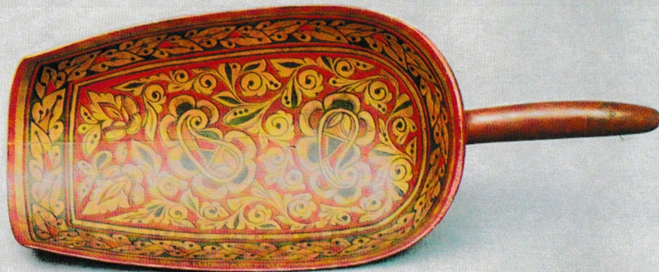
Совок для муки. 1924 г.