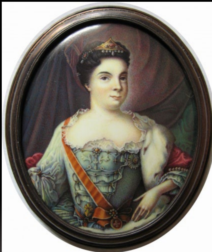
Екатерина 1. Портретная миниатюра выполнена в техники миниатюрной живописи по эмали по технологии 4х-красочного письма по эмали Васильев М. 2005 г.