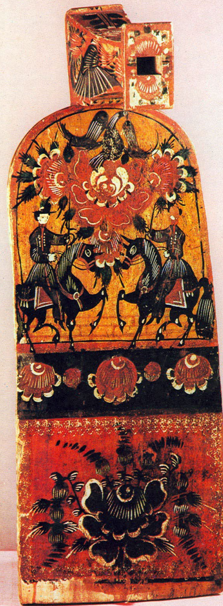
Городецкая роспись на прялках Вторая половина XIX в.

В росписях основное впечатление дают жанровые сцены. Это — быт крестьянства, купечества, пышный парад костюмов.