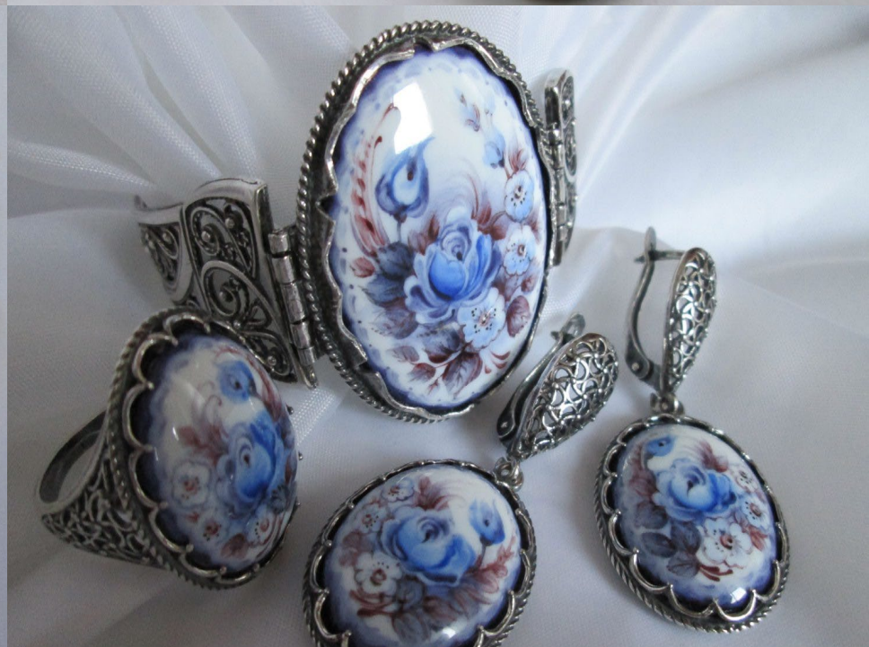
Комплекты украшений в технике «финифть». Эмаль живописная Ростов. Россия. Современное изделие