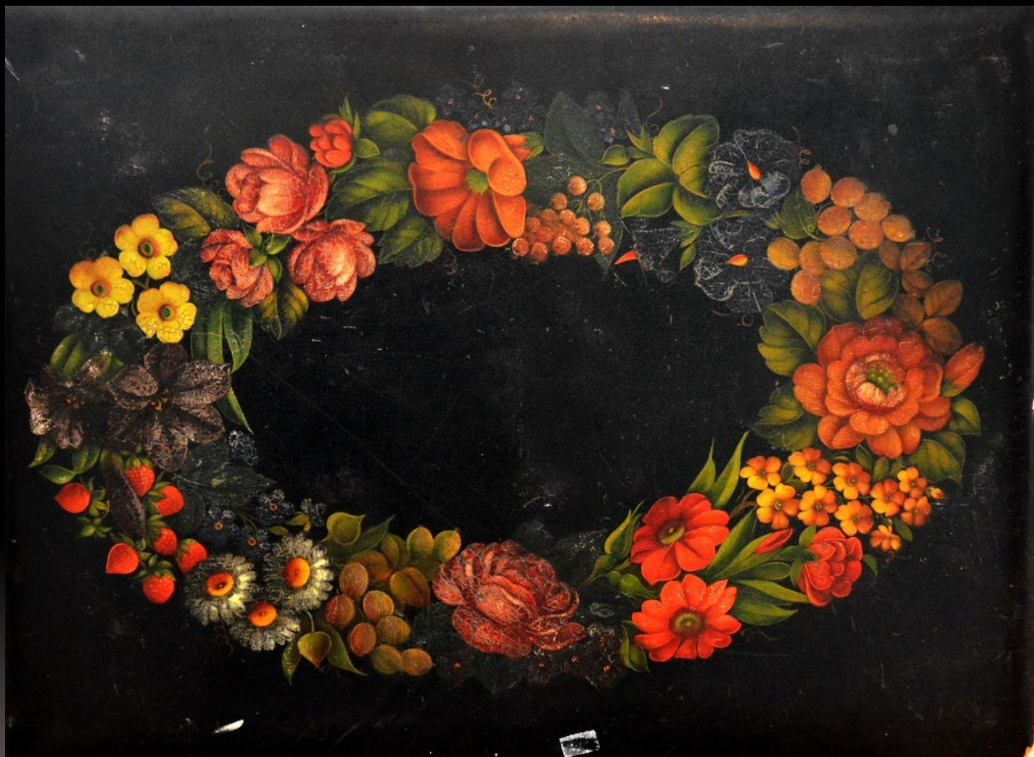
Артель «Металлоподнос». Обложка альбома. Папье-маше, масло, лак. 1910-1920-е годы Собрание музея Жостова. Россия