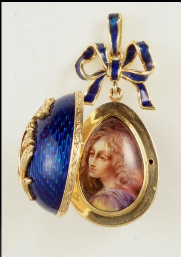
Медальон синий с колокольчиками Золото (750), бриллианты, эмаль Москва. 1994.