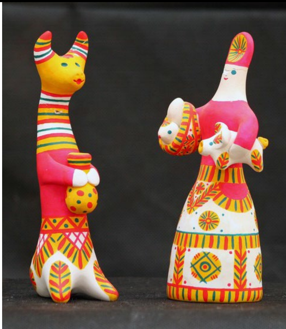
Филимоновская игрушка – старейший народный художественный промысел России

Родина промысла - деревня Филимоново Одоевского района Тульской области, впервые упоминается в древних летописях XVI в. На протяжении многих лет мужчины в деревне Филимоново изготавливали на гончарных кругах посуду, печные трубы, различную домашнюю утварь. Это было серьезное мужское дело, использовалась для этой цели местная глина, дающая после обжига светло терракотовый цвет. Лепить игрушки считалось делом легким, занимались им женщины, а обучать начинали девочек уже с семи лет.