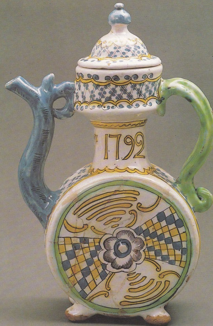
Квасник. Гжель. Гжель. Россия. 1792 г. Кувшин. Квасник. Гжель. Последняя треть XVIII в. Русский музей. Санкт-Петербург. Россия

Гончарное ремесло в Гжели насчитывает около семи веков. Первое упоминание об этой местности в летописи датируется XIV в. и связано с правлением Ивана Калиты. Это официальное упоминание, можно предположить, что народный промысел образовался со времен начала истории Великого княжества Московского.