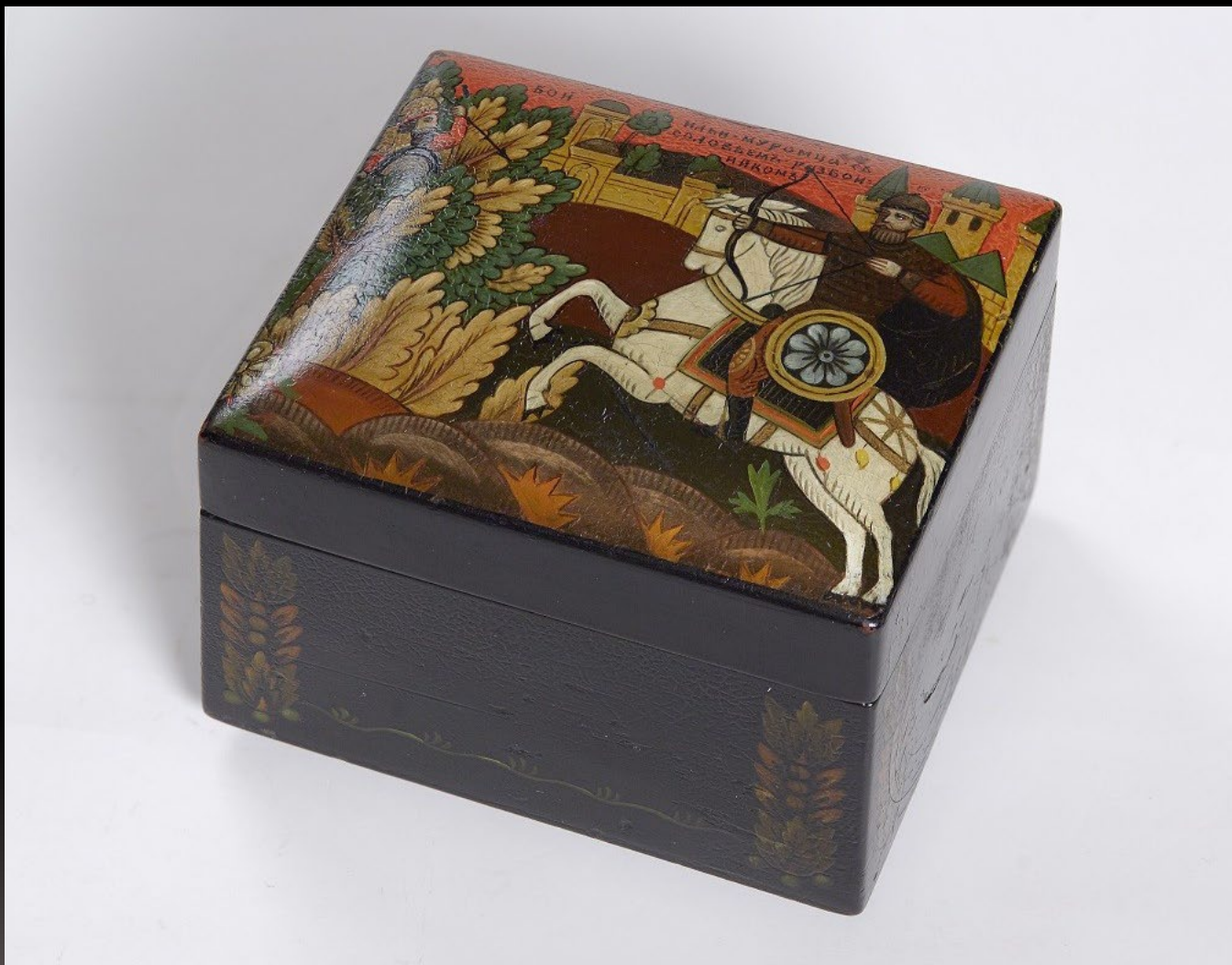
Шкатулка «Илья Муромец». 1910 гг. Фабрика бывших работников фабрики Лукутина Екатеринбургский музей изобразительных искусств. Россия