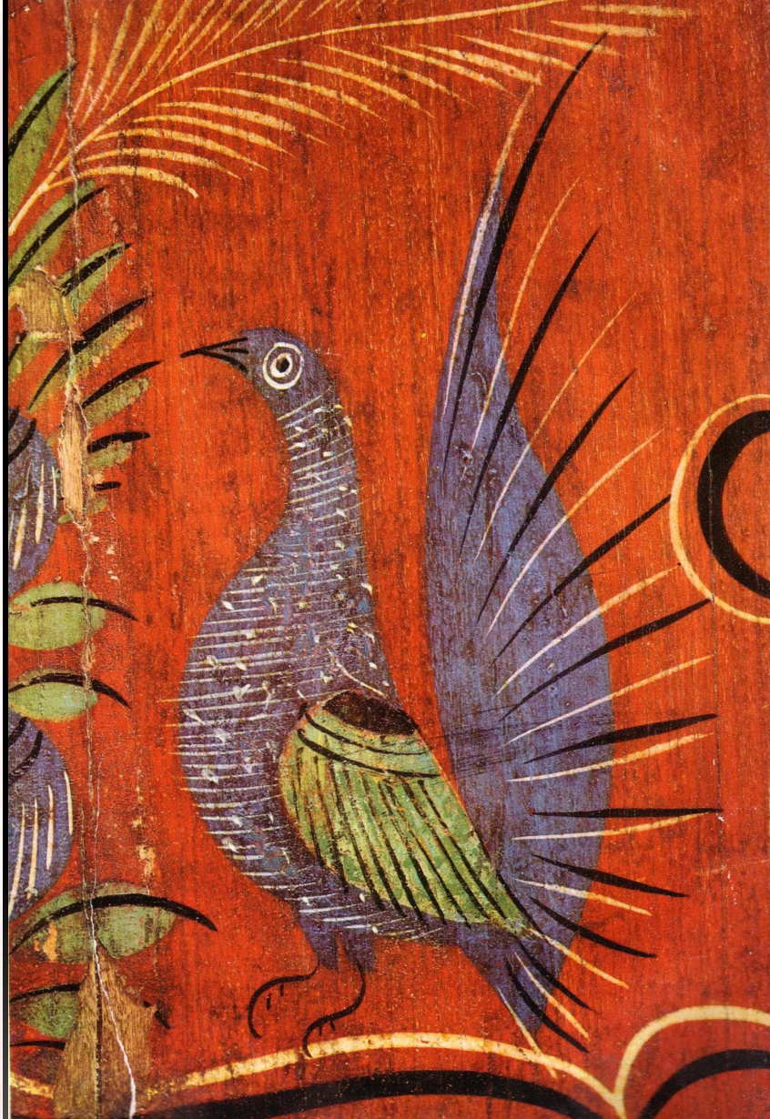
Городецкая роспись на прялках Конец XIX в.

Значительное место занимают цветочные мотивы — пышные «розаны», писанные широко и декоративно. Рядом с жанровыми реалистическими мотивами в городецких росписях живут декоративные образы птиц, животных. Изображения «петух» и «конь» является символами солнца, пожеланиями счастья.