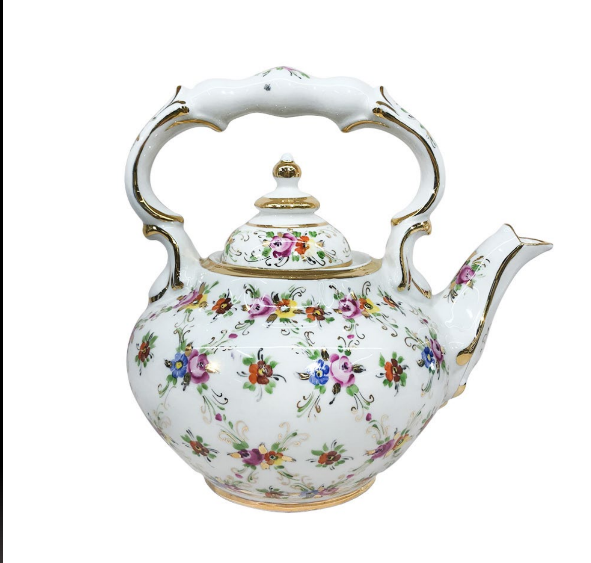
Надглазурная роспись. Заварной чайник

Сейчас АО «ГФЗ» - крупнейшее предприятие региона по выпуску традиционного фарфора с ручной кобальтовой росписью. В ассортименте завода более 700 наименований изделий из фарфора различного назначения, 70% которых являются предметами признанного художественного достоинства, выпускаемыми под маркой «Гжель 1818».