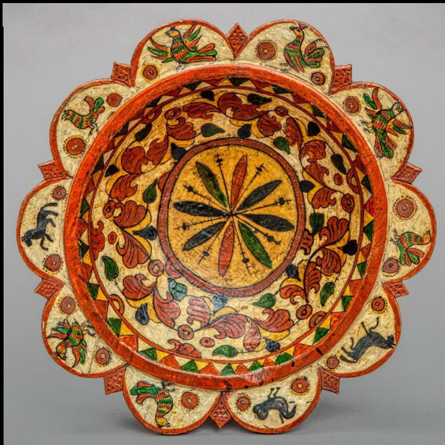
Блюдо. Дерево, темпера, резьба, раскраска, роспись Середина XIX в.

Главными цветами, используемыми в данной технике рукоделия, выступают красный, а также зеленый и желтый. Иногда мастера используют и кобальтовый оттенок, а также немного золота. При этом в более ранних работах пермогорская роспись включала орнаменты, сделанные желтой охрой, насыщенно-бордовым и несколько приглушенным зеленым цветом.