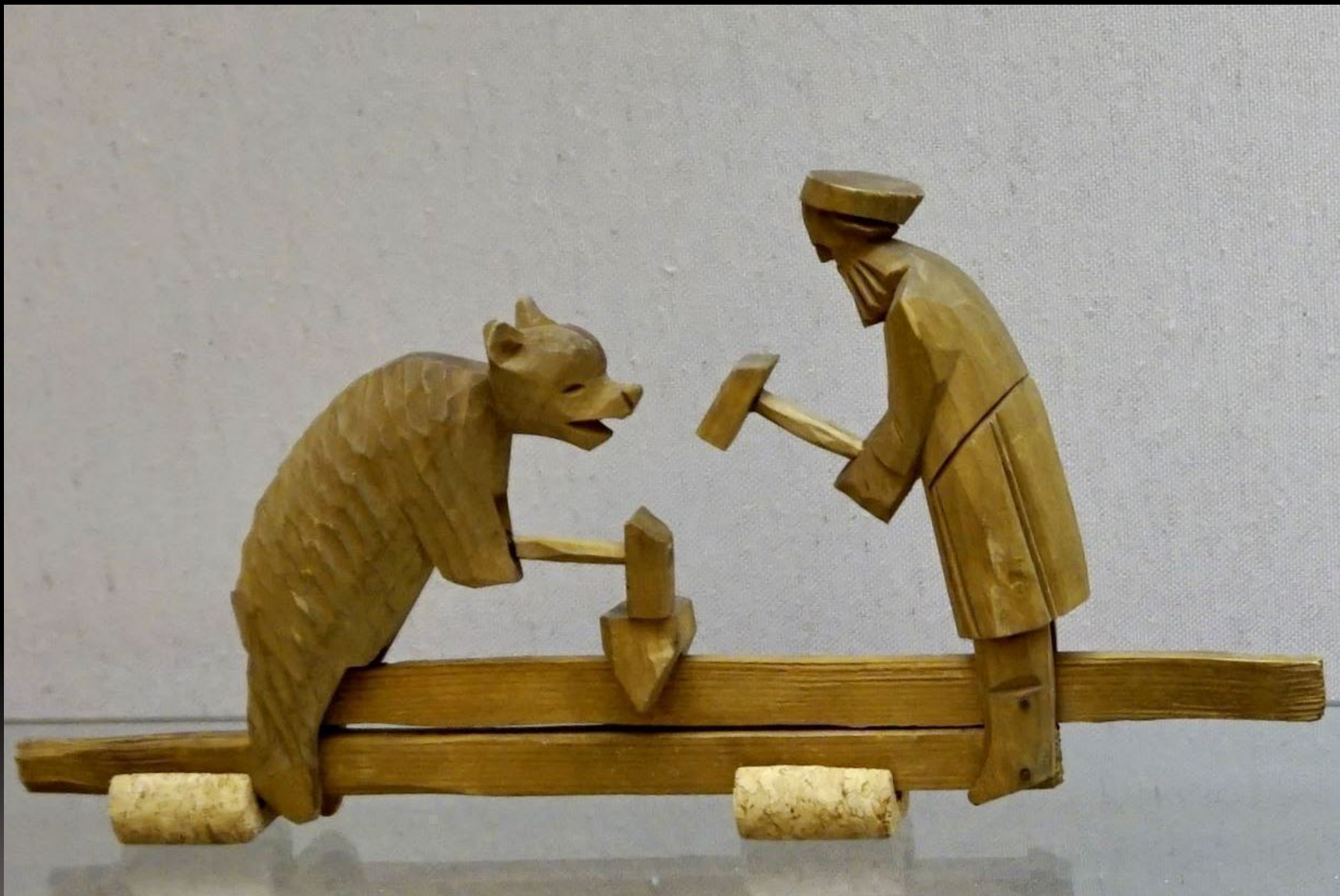
Подвижная игрушка «Кузнецы». Дерево; резьба Сергиев Посад. XIX в.

Всероссийский музей декоративного искусства. Москва. Россия