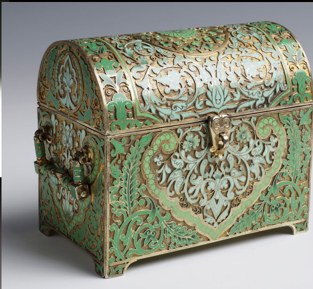
Сундучок. Серебро, позолота; перегородчатая, расписная эмаль. П. Овчинников Москва. Конец XIX в.