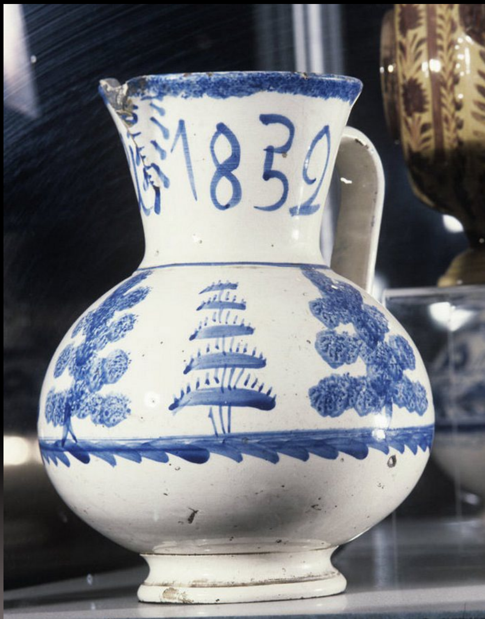
Кувшин. Гжель. Полуфаянс. 1832 г. XIX в. Экспонат выставки "Гжель. 650 лет" в Центральном доме художника в Москве