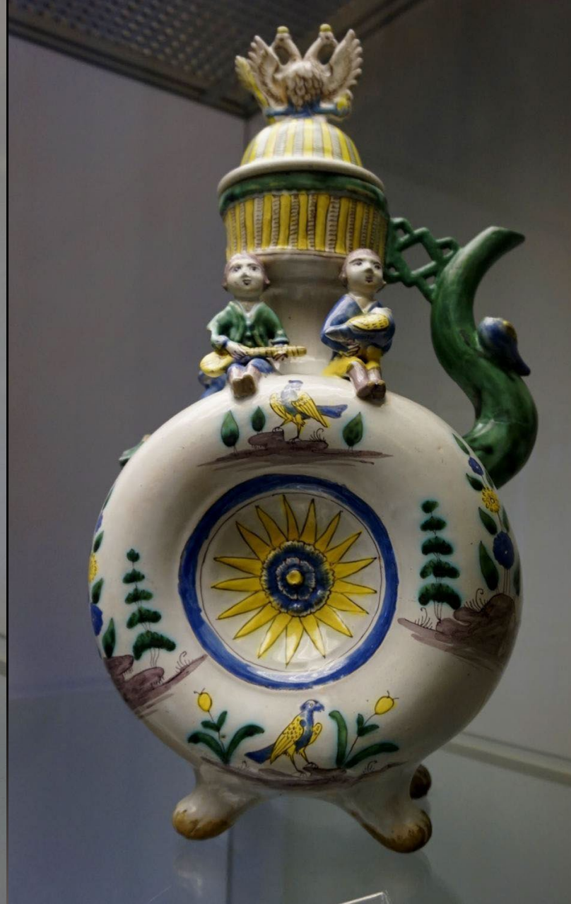
Кувшин «Фазаны» и кувшин «Поющие». Гжель. Последняя четверть XVIII в. Русский музей. Санкт-Петербург. Россия

Мастера часто сочетали изображения цветов, листьев, трав, животных, птиц — реже людей, общих архитектурных ландшафтов — с орнаментами в виде геометрических полос и сеток. Роспись осуществлялась по зонам. На изделиях можно увидеть надписи, указывающие на то, был ли предмет подарком или заказом.