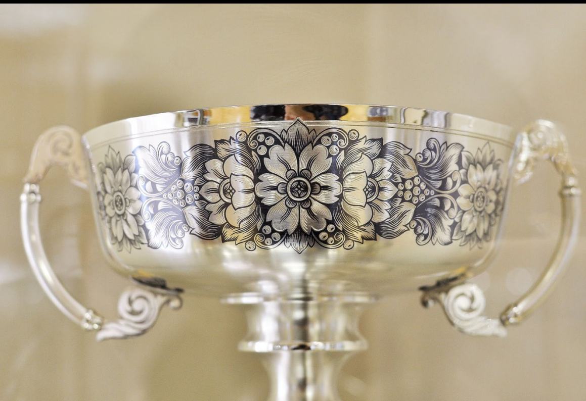
Серебро; золочение, чернение Изделия великоустюжского завода «Северная чернь». XX вв.