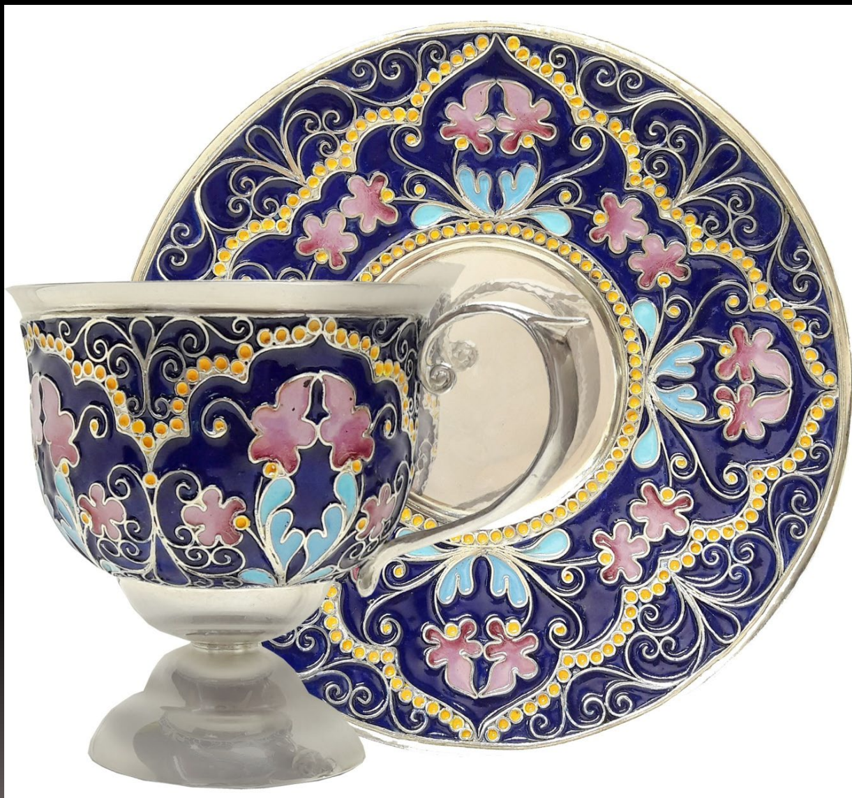
Роспись на эмали. Скать, давление, горячая перегородчатая эмаль Серебро 960 пробы, эмаль. Ростов. Россия