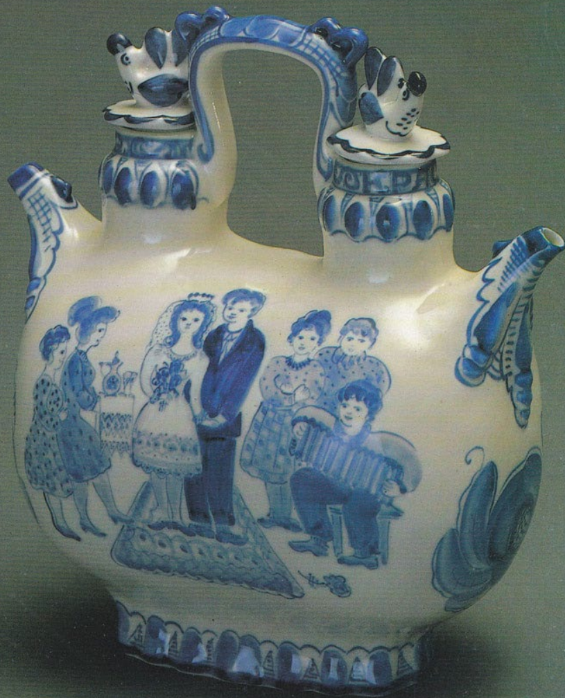
Гжель. 2 половина XX в.