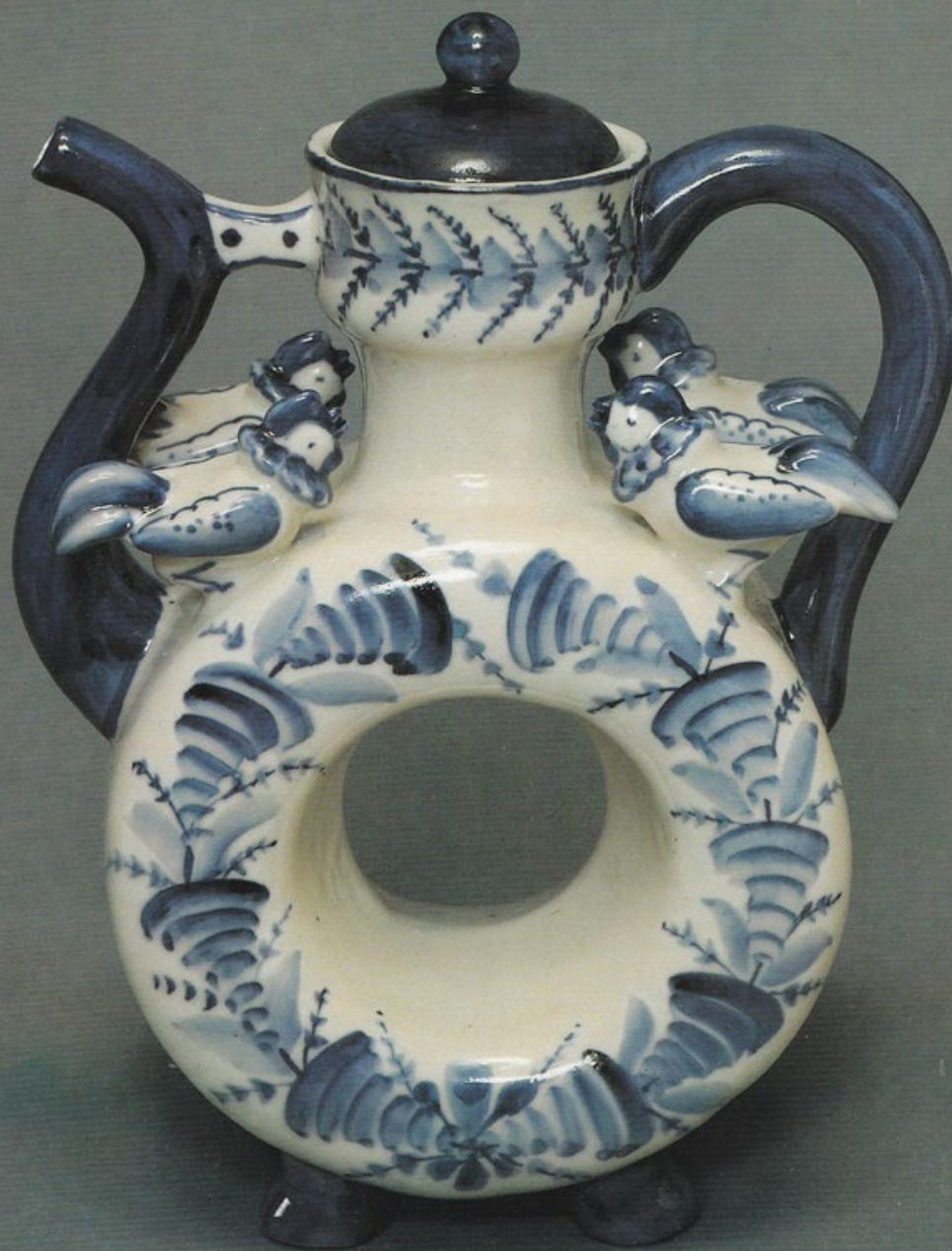
Квасник. Гжель. Вторая половина XX в. Вторая половина XX в.