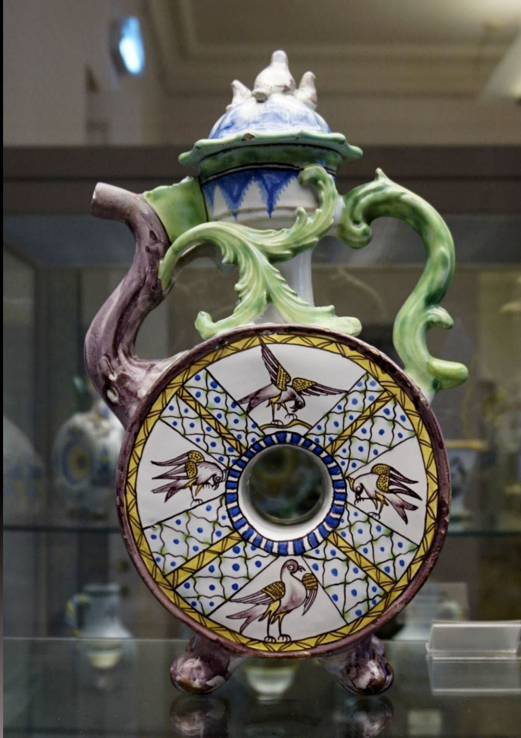
Квасник с птицами. Гжель. Последняя треть XVIII в. Русский музей. Санкт-Петербург. Россия.

В XVIII в. новый толчок развитию местного производства дало обнаружение на территории д. Монино особой серой глины. Сырье активно использовалось при производстве майолики (некоторые специалисты называют его «полуфаянс»), позднее фаянса. Эти технологии изготовления керамики были заимствованы у западных умельцев. Такая керамика была очень модной в XVIII - XIX веках, она была легче и изящнее традиционной гжельской. XVIII в. стал временем стремительного распространения фаянса в России. Посуда из этого материала имела белоснежный тонкий черепок, покрытый прозрачной глазурью.