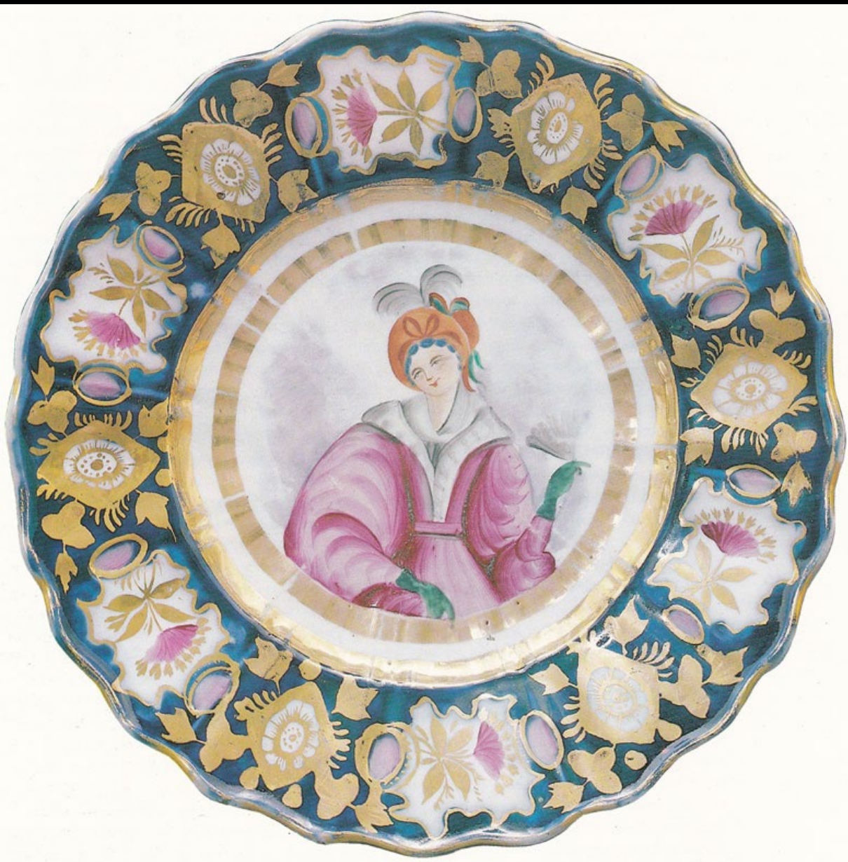
Фарфор. Гжель. XIX в.