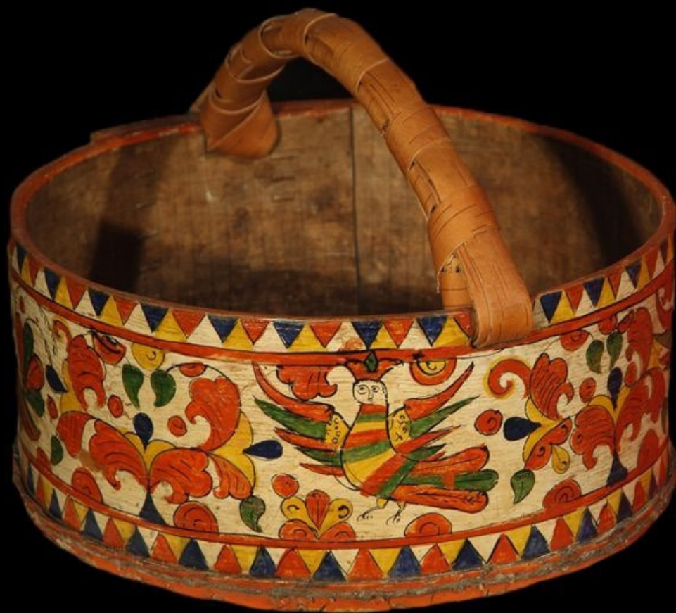
Набируха (31,4x13,8 см). Туес. Дерево, луб, береста; роспись Село Пермогорье. Сольвычегодский уезд. Вологодская губ. Конец XIX– начало XX вв.

Музейное объединение «Культура русского Севера». г. Архангельск. Россия