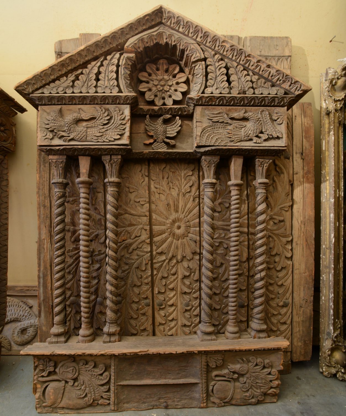
Наличник чердачного окна крестьянской избы (168,8x121,5). Дерево, резьба Владимирская область. 1884 г.

Государственный музея архитектуры имени А.В. Щусева