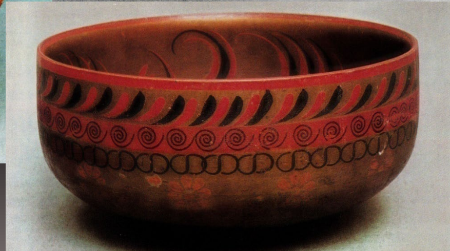
Ложки. Начало XX в. Совок для муки. Вторая половина XIX в. Чашка. Середина XIX в.