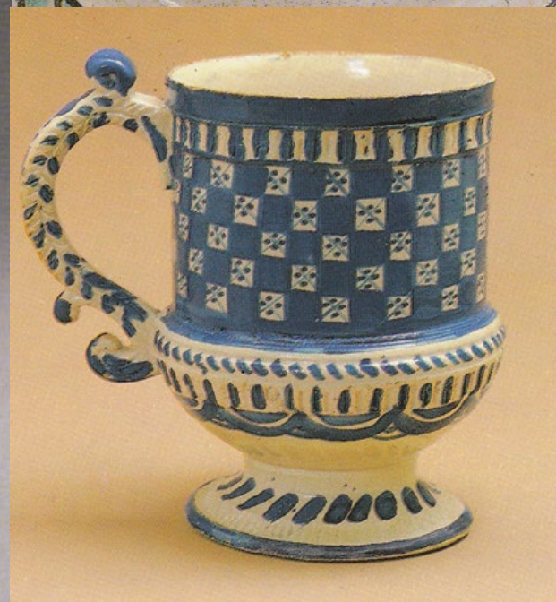
Полуфаянс. Гжель. XIX в.