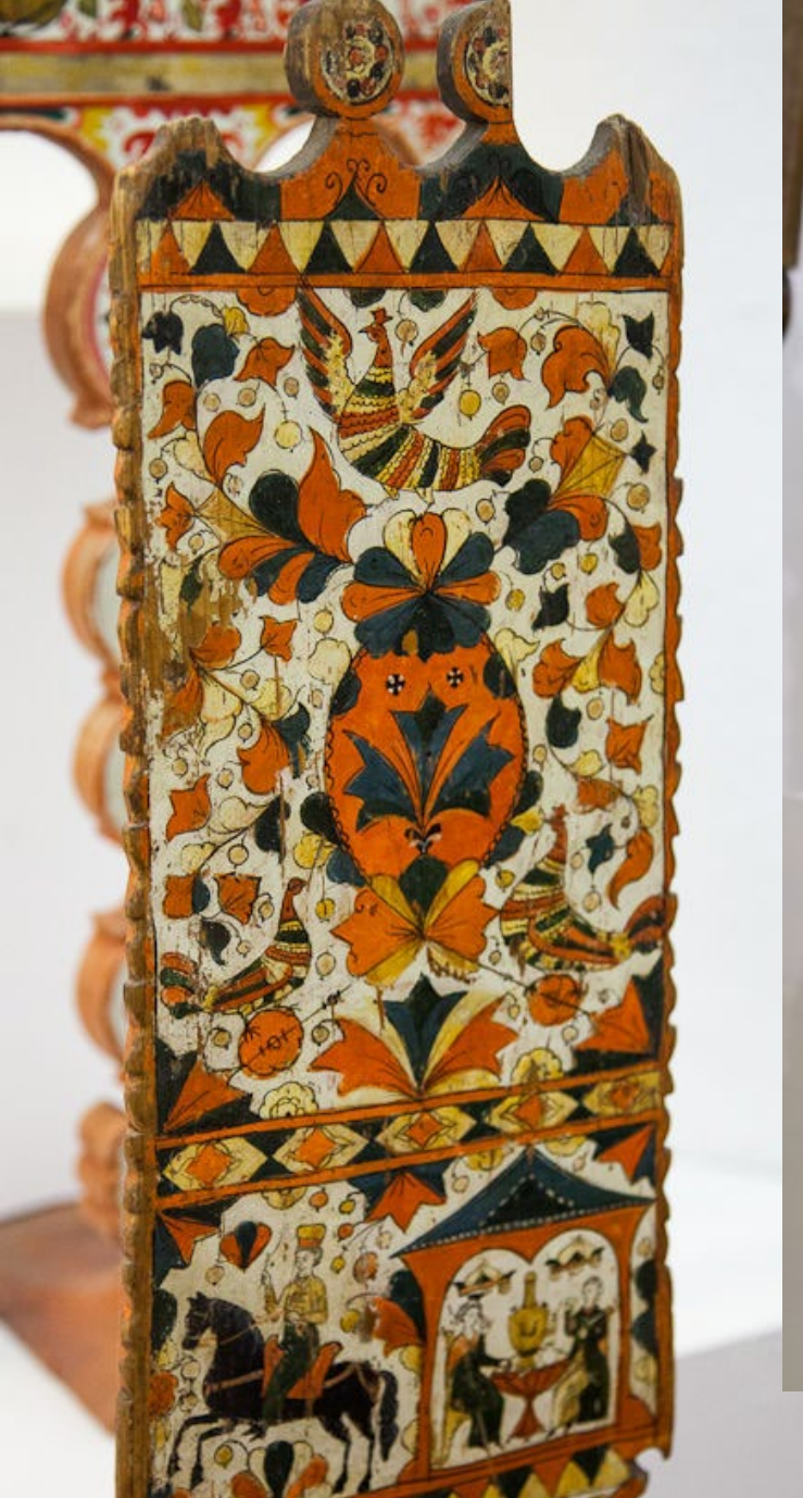
Расписная прялка (лопаска). Фрагмент.