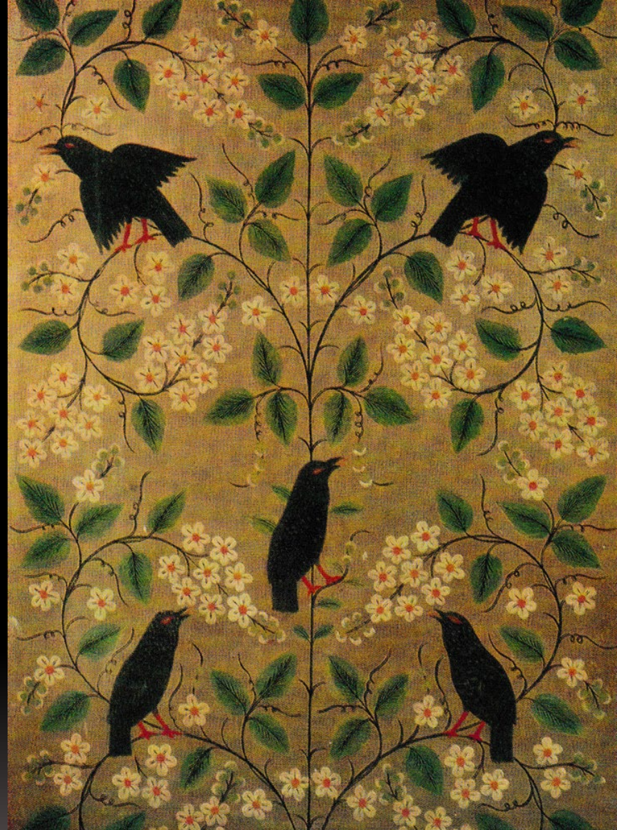
Весна. Деталь росписи портала. 1937 г.

На сложение технологии Хохломы оказало влияние развитое в раскольничьих скитах Заволжья иконописное ремесло — для золочения фона икон употреблялся серебряный порошок под олифу. В этой технике, близкой хохломской, местные иконописцы пробовали создать и чисто орнаментальные композиции. В Горьковском художественном музее хранятся киоты XVII в., расписанные пышными растительными узорами, напоминающими драгоценные восточные ткани. Фантастические золотые цветы и причудливой формы листья поблескивают на красном и зеленом фонах.