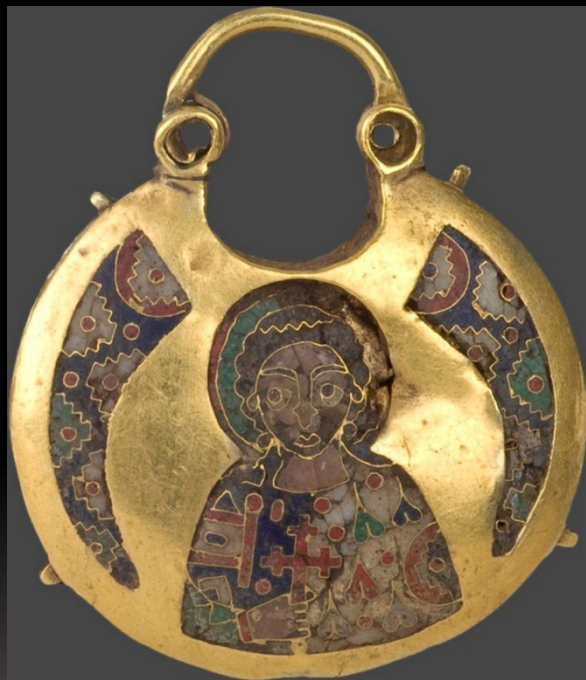
1. Колт (3,6х4,4 см). Св. мученик, неизвестный. Металл золото, эмаль; ковка, эмаль перегородчатая. Киевская Русь. XII в. Санкт-Петербург, Государственный Эрмитаж (ГЭ). Россия.