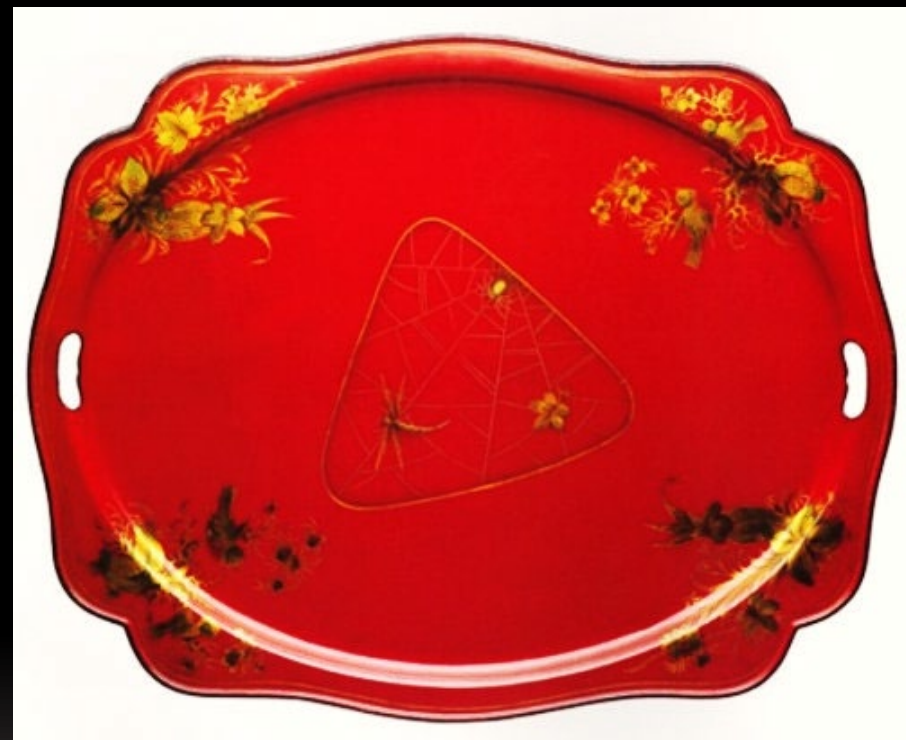
«Стрекоза в паутине» Мастерская О.В. Вишнякова с сыновьями. 1880-е. гг.