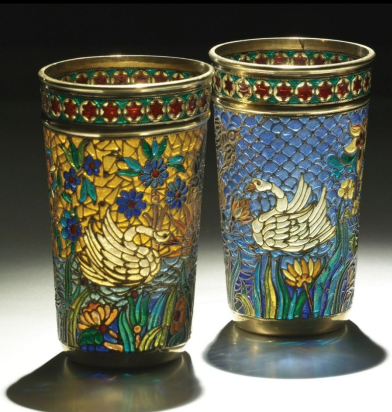
Бокалы. Серебро; витражная эмаль. П. Овчинников Москва. Конец XIX в.