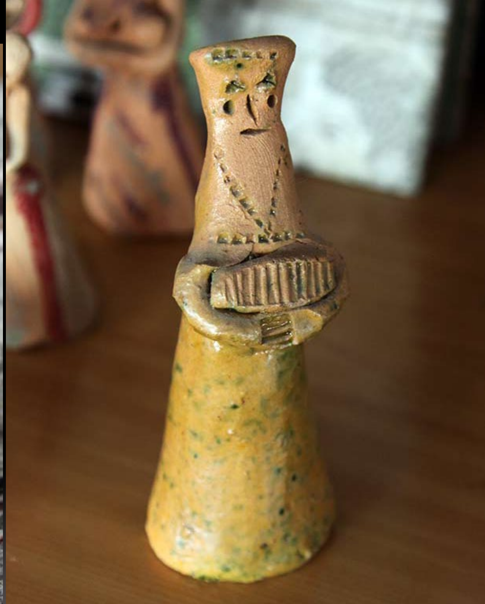
Сапожковская игрушка из деревни Александра-Прасковьянка Сапожковского района Рязанской области

В народе деревню эту до сих пор называют Глинки - в прошлом она широко славилась своими гончарными изделиями, которые продавались на базарах и ярмарках. Лепка глиняной игрушки здесь сопутствовала производству гончарной посуды. Сапожковские игрушки древние, языческие, статичные, монументальные, с цельной нерасчлененной формой, приземистых пропорций.