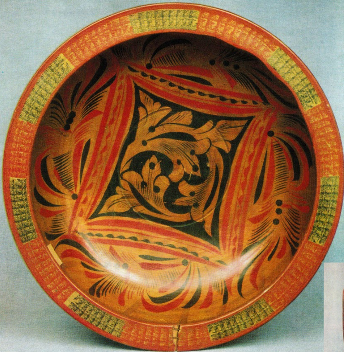
Блюдо. Середина XIX в.

Художественные изделия, выпускаемые на промысле, достаточно разнообразны. Но все они утилитарны и предназначены для использования в быту. Особенность хохломских изделий заключается в росписи, имитирующей дорогую фарфоровую посуду. «Травный» орнамент, заполняющий поверхность изделий, традиционно русский и отображает природу России в несколько стилизованной форме.