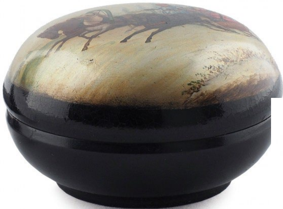
Шкатулка «Тройка зимняя» (7,7 см). Папье-маше, роспись, лак Россия, фабрика лаковой миниатюры В.О. Вишнякова. Конец XIX в.

Главным лаковой миниатюры считается русская тройка.