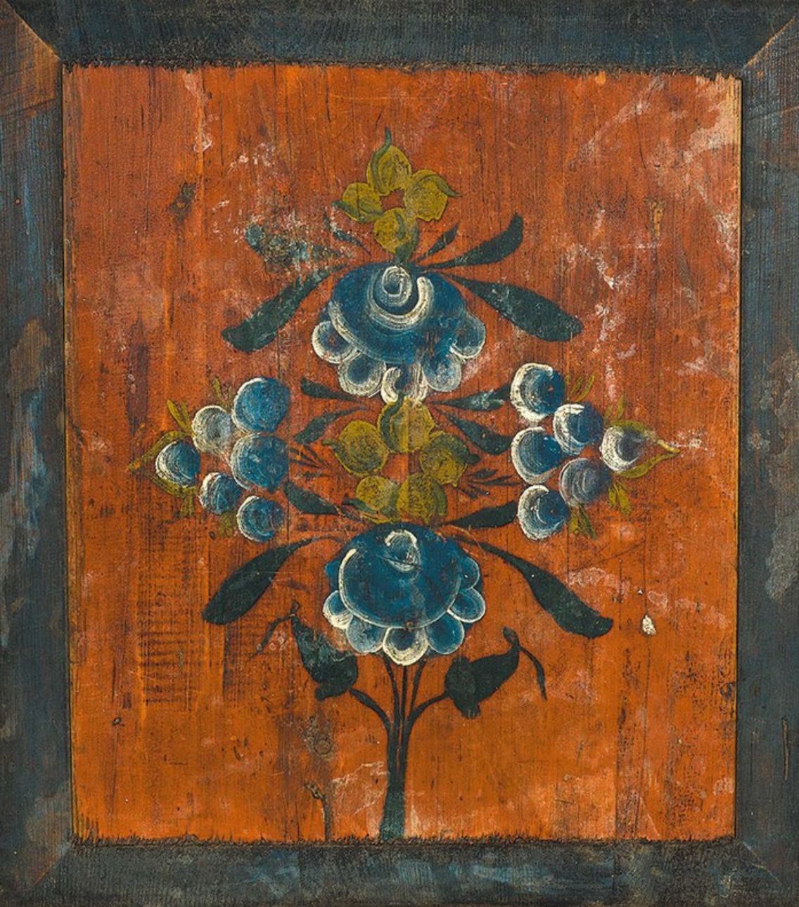
Створка шкафа филенчатая (53x49 см). Дерево, металл, масло; столярная работа, промышленное производство, роспись д. Колоколовская. Вельский район. Архангельская губ. Кон. XIX в.

ГБУК АО «Вельский краеведческий музей имени В.Ф. Кулакова». Г.Вельск. Россия