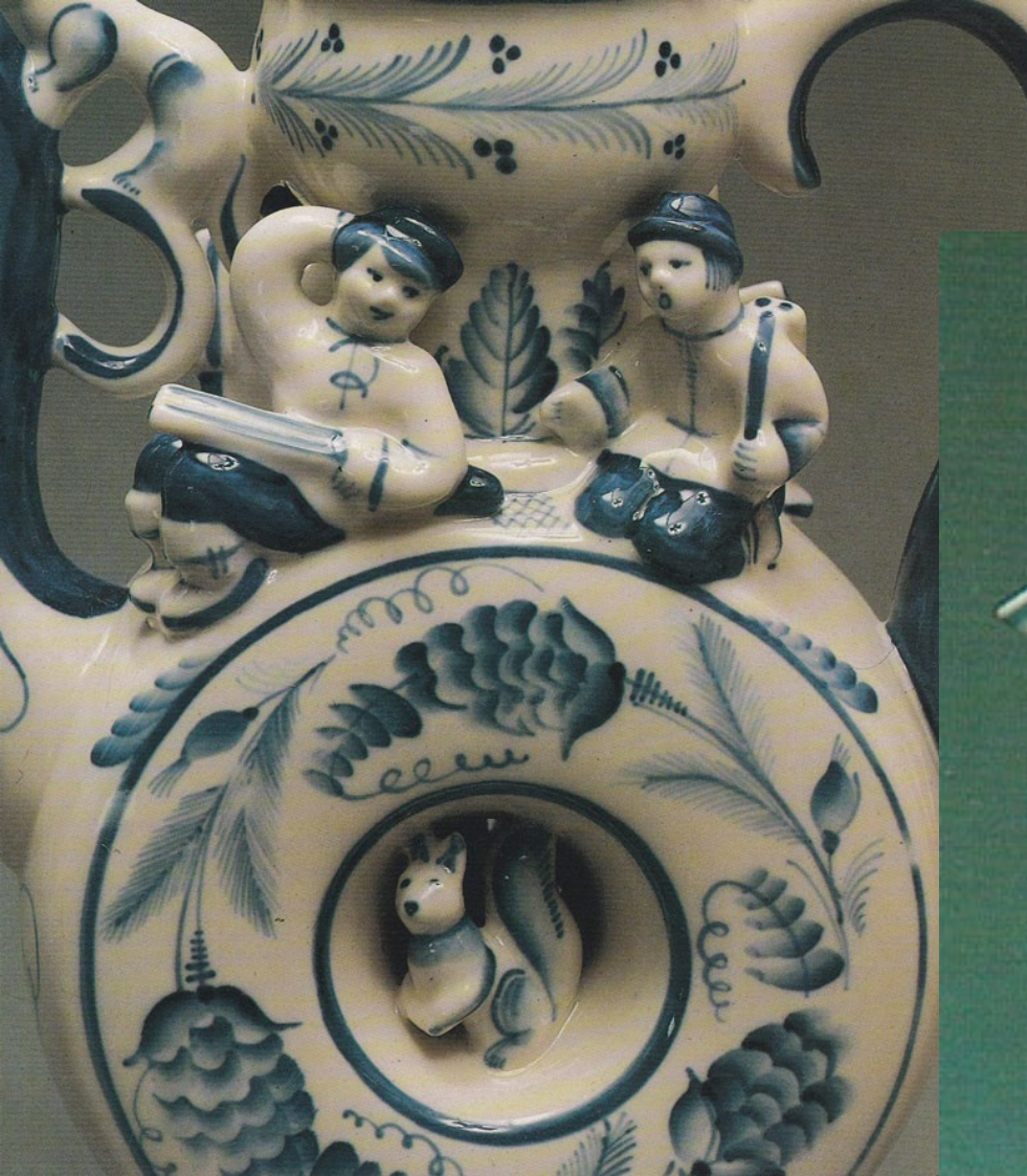
Гжельский фарфор после 1940-х гг.