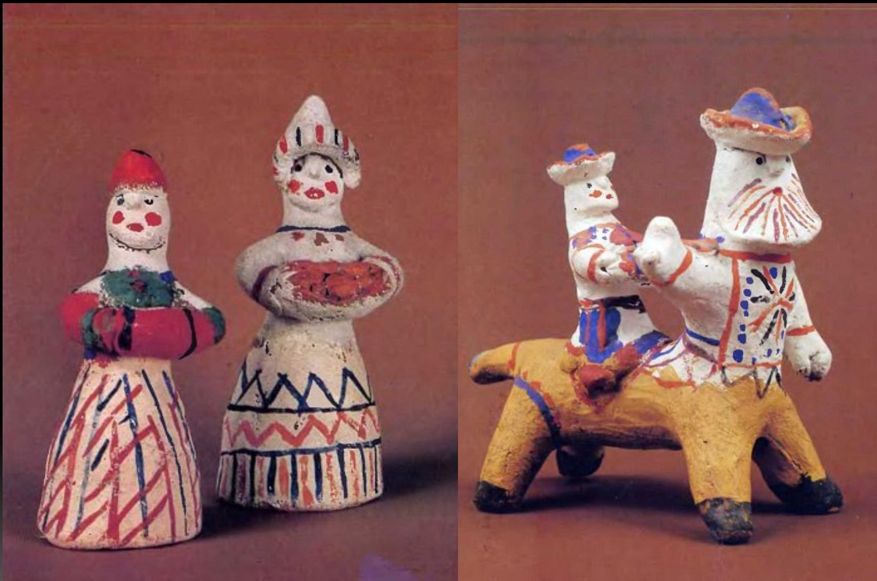
Каргопольские игрушки 70-х г.

Русский художественный промысел, распространенный в районе города Каргополя Архангельской губернии. Возникновение промысла Издавна в Торопове, Гриневе, Печникове - деревнях Панфиловской волости Каргопольского уезда, сложился сезонный гончарный промысел на местных красных глинах. Искусство изготовления керамики зародилось на Каргопольской земле ещё в эпоху каменного века.