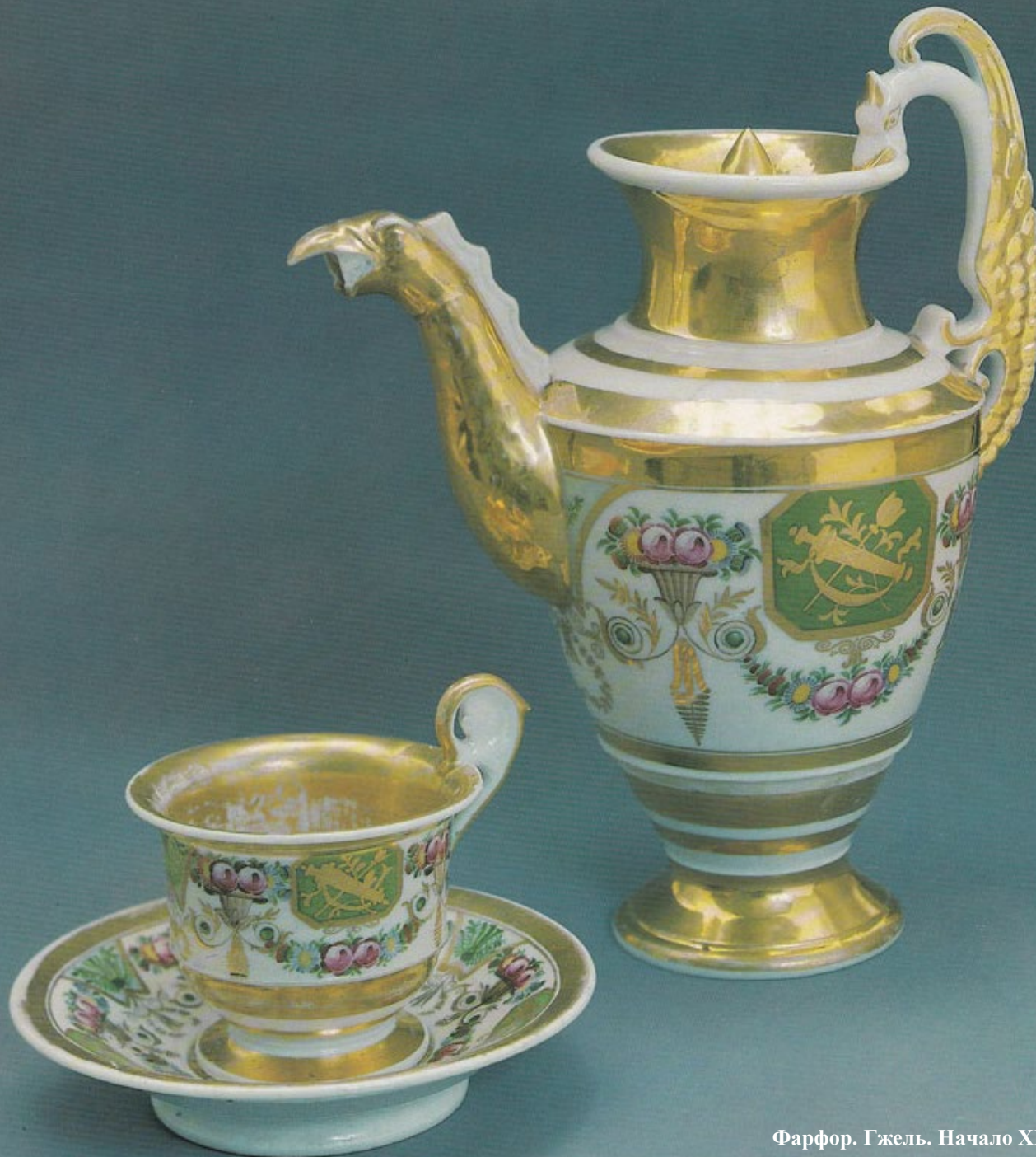
Фарфор. Гжель. Начало XIX в.