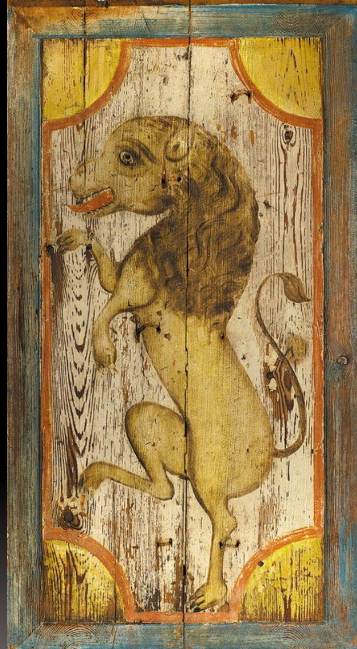
Филенка (69x37 см). Дерево, масло; роспись Семья живописцев Петровских д. Заболотье. Вельский район. Архангельской губ. 1870 гг.

ГБУК АО «Вельский краеведческий музей имени В.Ф. Кулакова». Г.Вельск. Россия