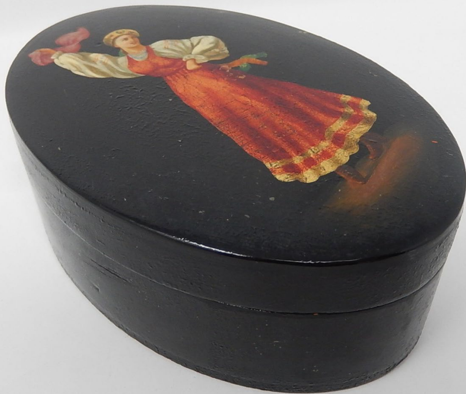
Шкатулка «Русский танец» (13.5x6.5x9 см.). Пашинин М.Г. 1957 г.