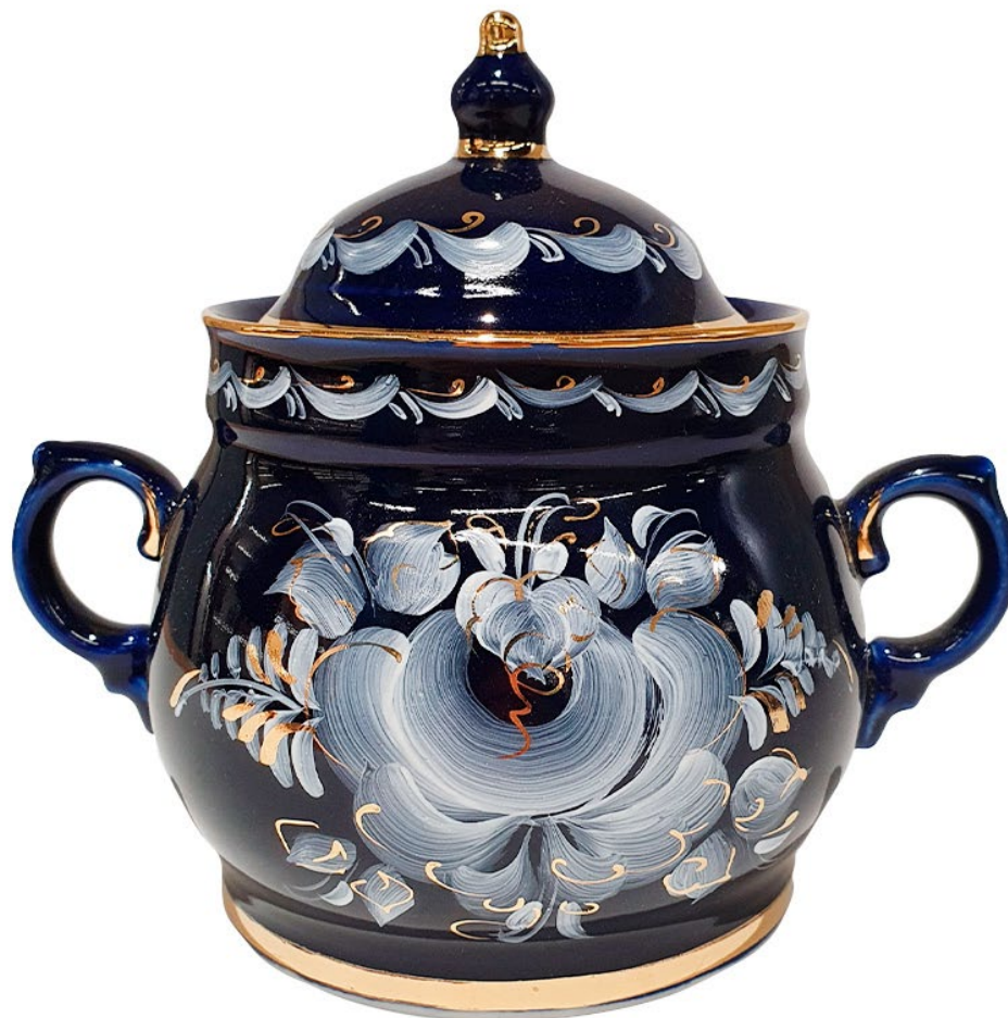
Глухой кобальт. Сахарница

"Глухой кобальт" - это особый вид росписи, когда блестящая темно-синяя глазурь покрывает все изделие, а по ней наносится тонкий, графичный рисунок золотом. Также, в процессе росписи может быть использована белая надглазурная краска, отчего она становится как бы зеркальным отражением традиционной гжельской техники, когда синие цветы превращаются в белые, а белый фон становится синим, создавая эффект морозного узора.