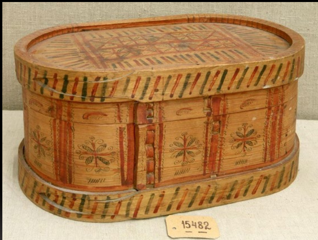
Короб. Мезенский уезд. Архангельская губ. Начало XX в.

Музейное объединение «Культура русского Севера» г. Архангельск. Россия