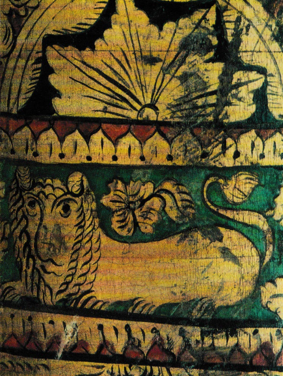
Деталь росписи дуги. Вторая половина XIX в.