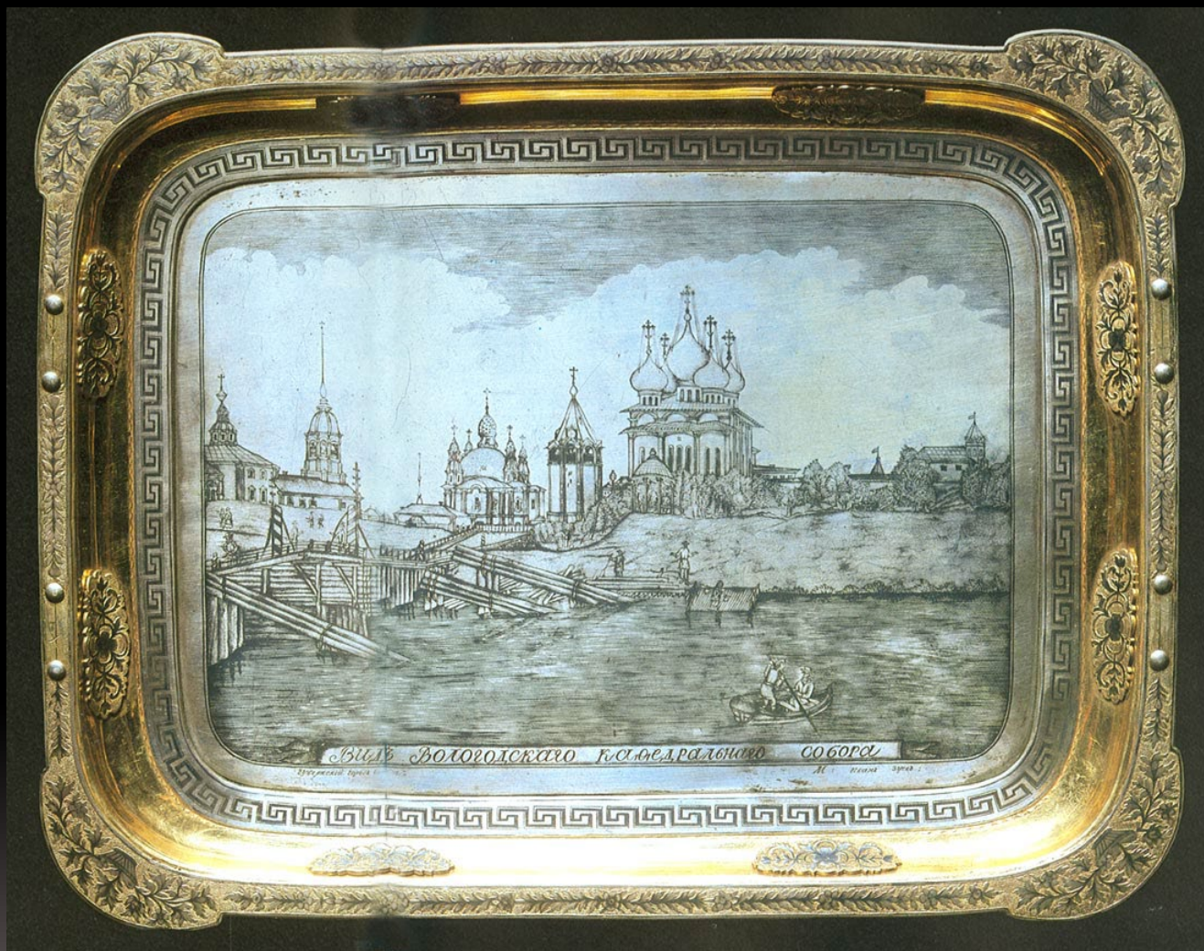
Поднос «Вологодский кафедральный собор». Серебро; золочение, чернение Конец XIX в.

Экспонаты выставки «Шедевры Северной черни XVIII – начала XXI в. Традиции и современность»