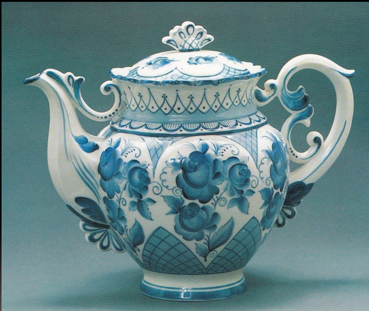
Гжель. 1980-е гг. XX в.