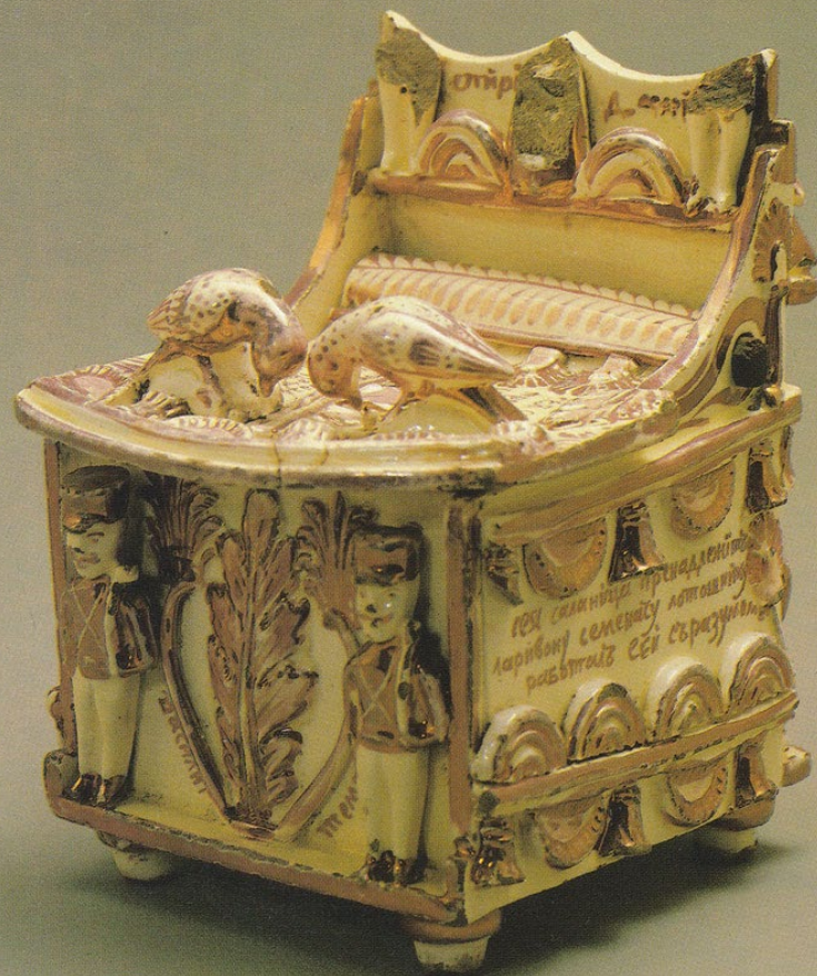
Люстровая керамика. Гжель. XIXв.