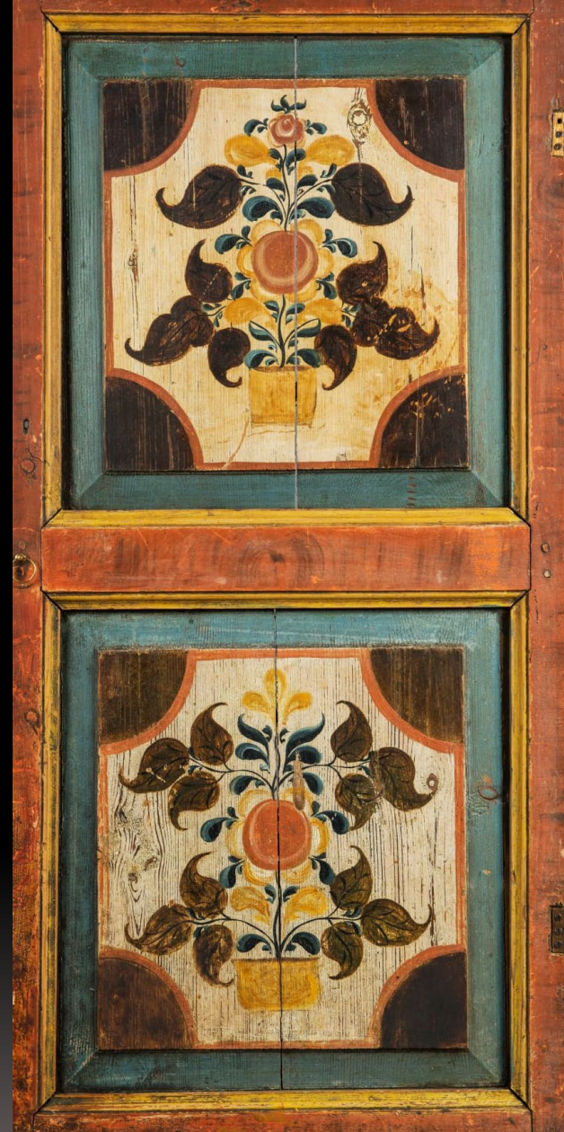
Створки шкафчиков. XVIII-XIX вв. Дерево, живописная роспись

Государственный Русский музей. Санкт-Петербург. Всероссийский музей декоративного искусства. Москва. Россия