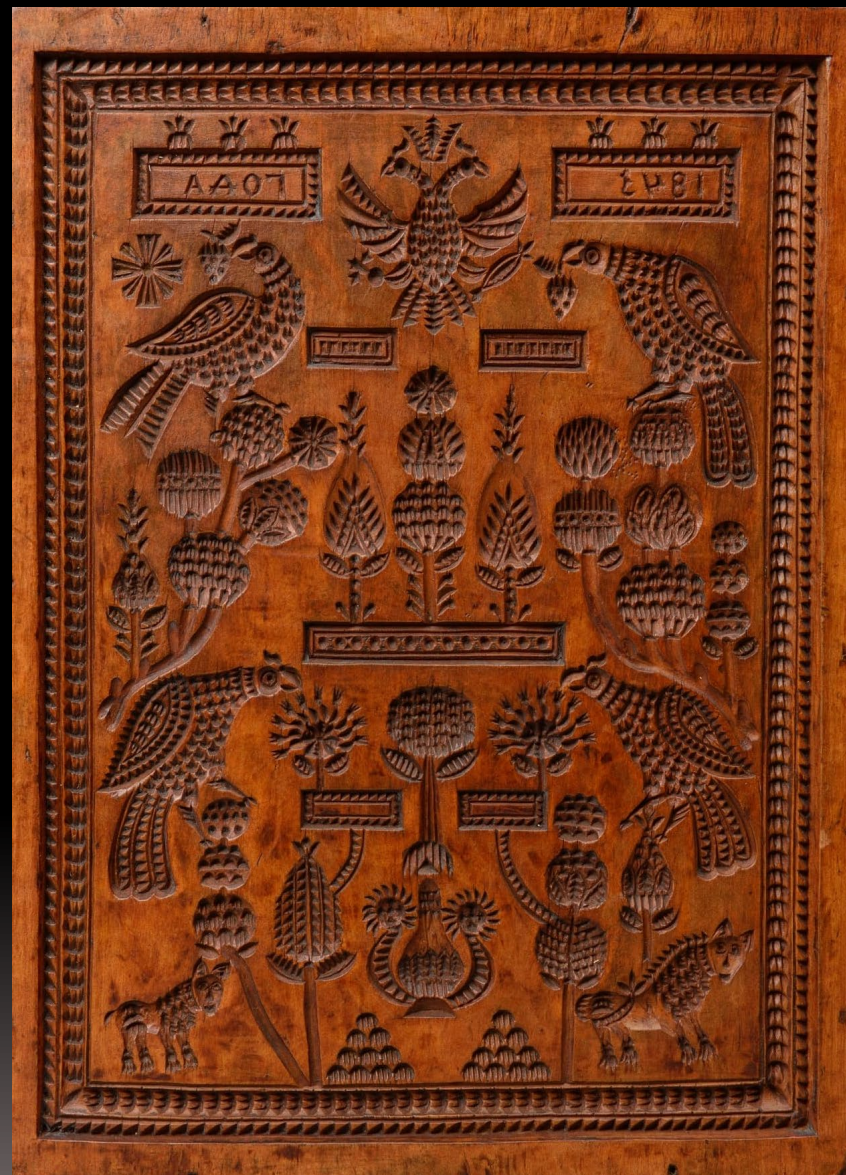
Пряничные доски. Дерево, резьба Россия. XIX в.