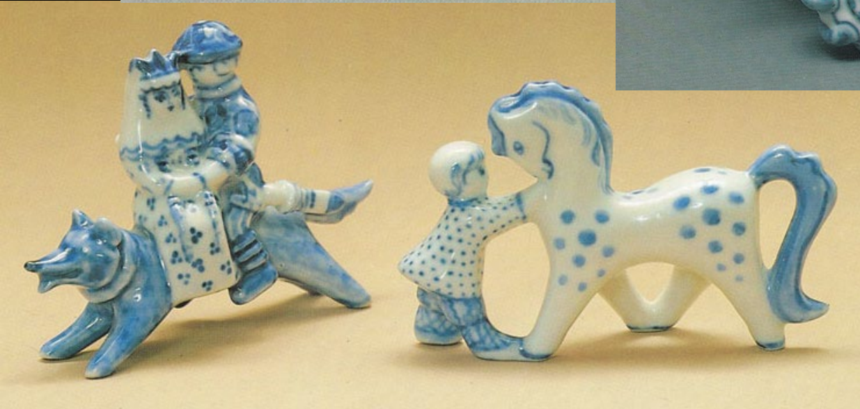
Мелкая пластика. Гжель. 60-е гг. XX в.

Развлекательность сюжета, оригинальное сценическое действие воспроизводятся чисто пластическими средствами, характерными как для Гжели, так и для всего народного искусства 60-х гг..