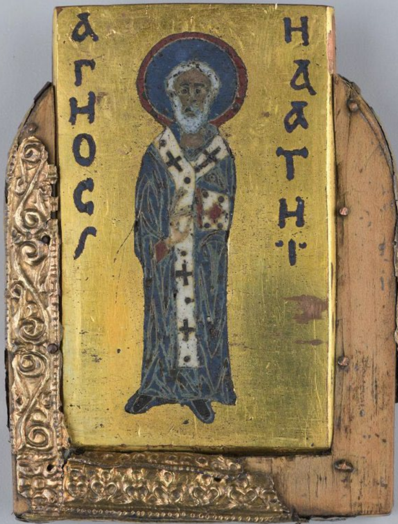
2. Иконка-мошевик (8,2х6,6х0,5 см). Св. Ипатий. Серебро, медь, дерево; эмаль перегородчатая, басма, золочение. Древняя Русь. Новгород. XII-XIII вв. Новгородский музей-заповедник. Россия

Русские ювелиры с давних времён освоили технику эмали и стали украшать ею иконы, церковную утварь и оклады религиозных книг. Византийские перегородчатые эмали, не потерявшие до наших дней своего блеска и красоты, были хорошо известны киевским ювелирам уже в XI-XII вв. Эта ювелирная техника вместе с золотыми и серебряными изделиями, украшенными эмалями, из Киева распространилась в разные концы русской земли.