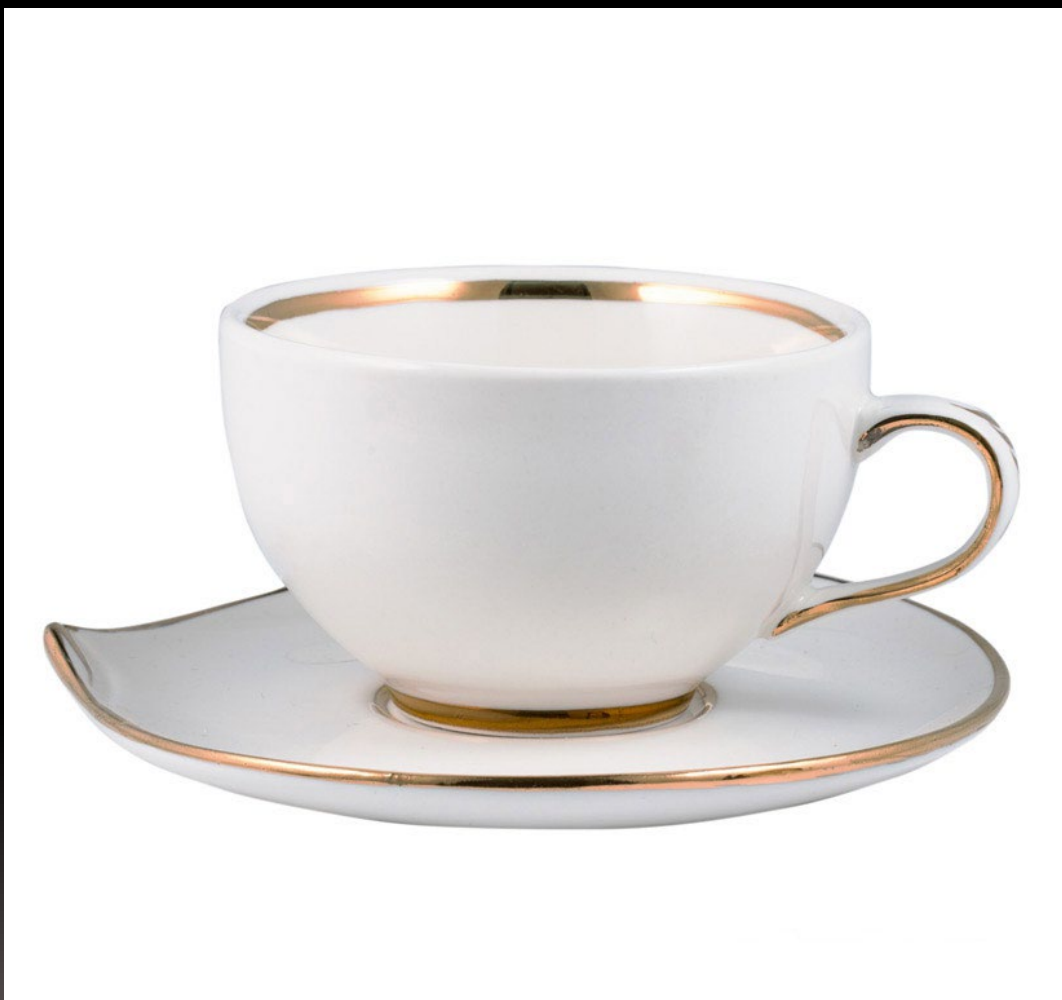
Костяной фарфор. Чашка с блюдцем