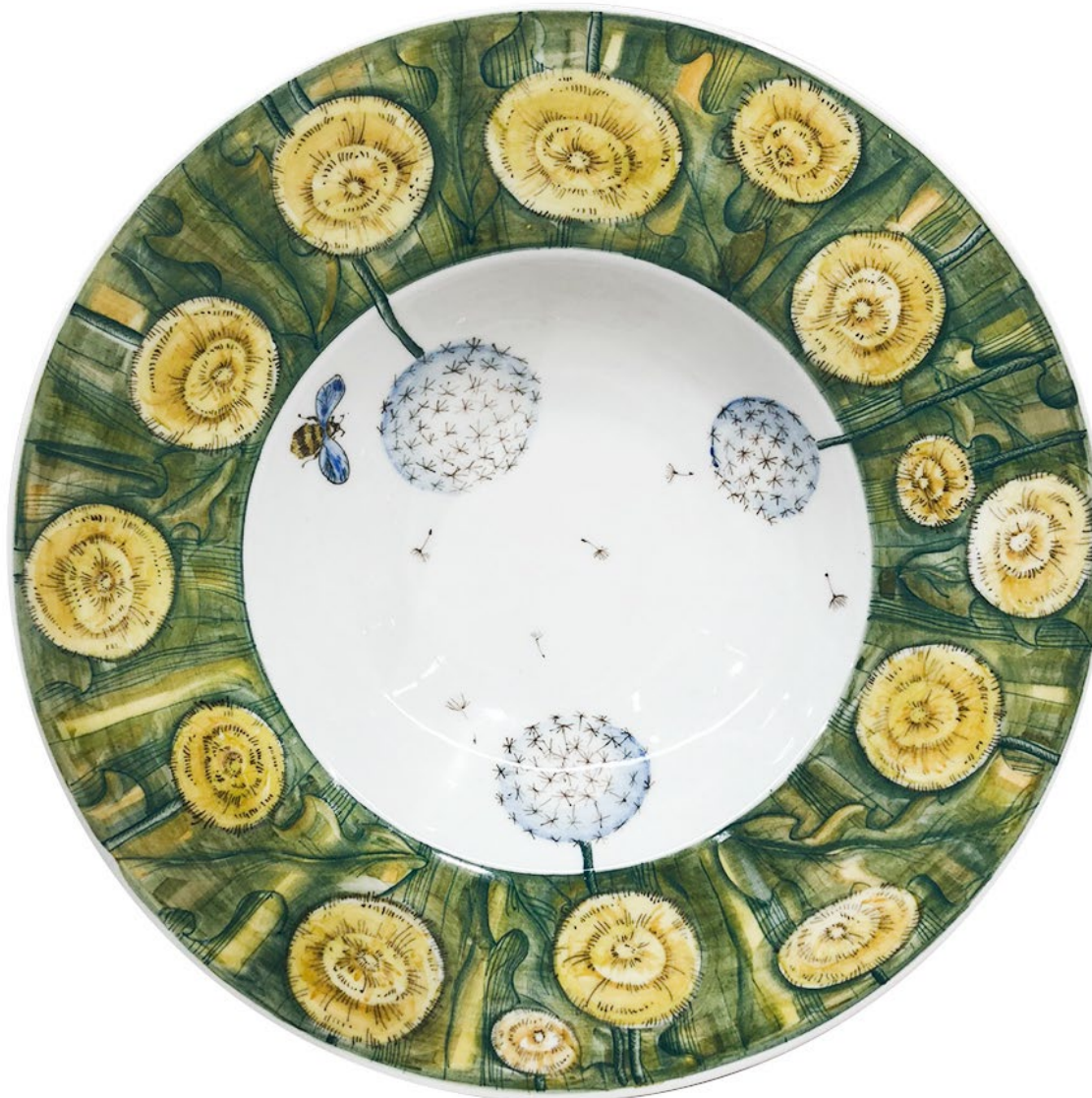
Подглазурная цветная роспись

Технологический процесс производства фарфора постоянно совершенствуется, но сама роспись, как и 200 лет назад, наносится на изделия вручную талантливыми гжельскими мастерами, передающими по наследству секреты своего искусства. На заводе и теперь трудятся потомки тех фарфористов, которые работали на заводах Кузнецовых и в собственных артелях Гжельского региона.