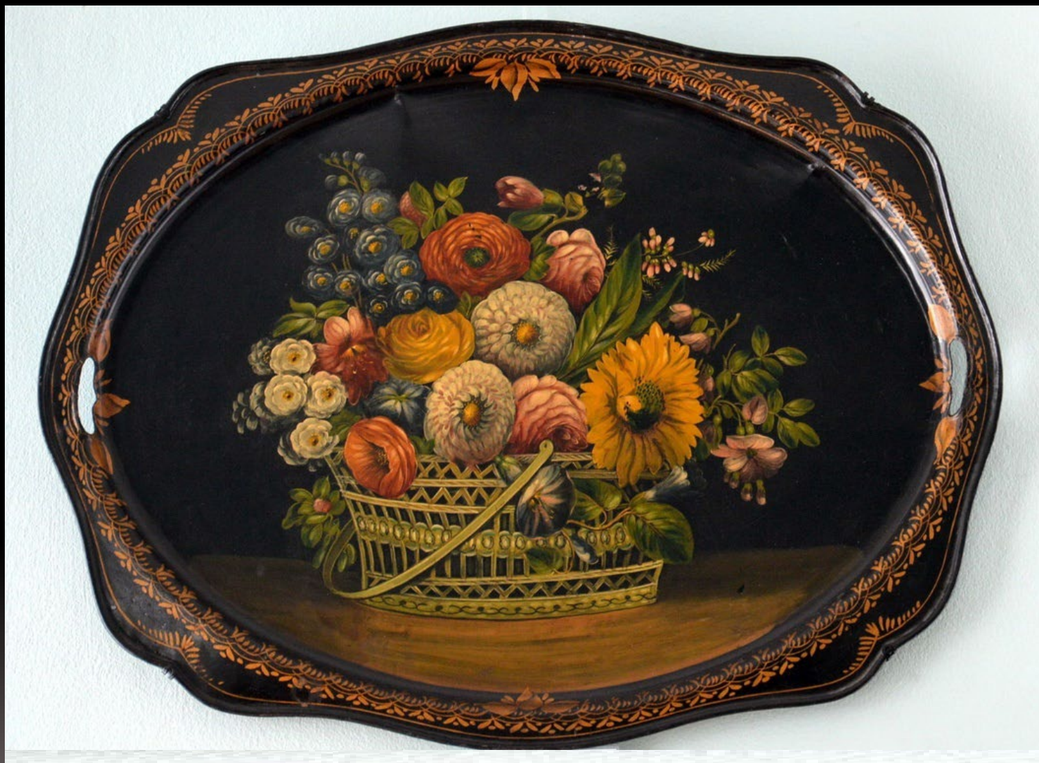
Цветы в корзине. К.В. Грибков. Метал, масло, бронза, лак. 1920 г. Собрание музея Жостова. Россия