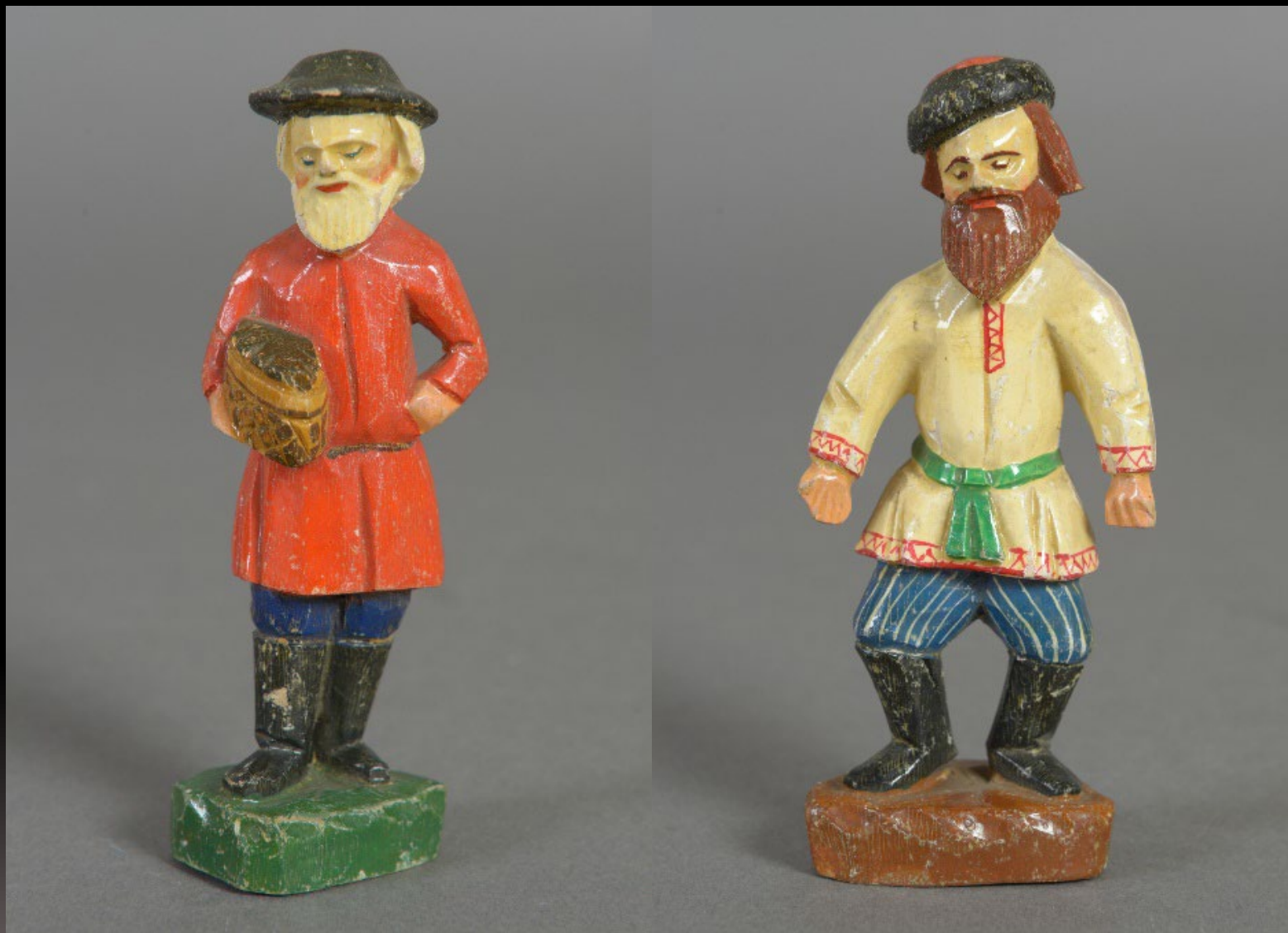
Скульптуры. Дерево; резьба, роспись Сергиев Посад. XIX в.

Всероссийский музей декоративного искусства. Москва. Россия