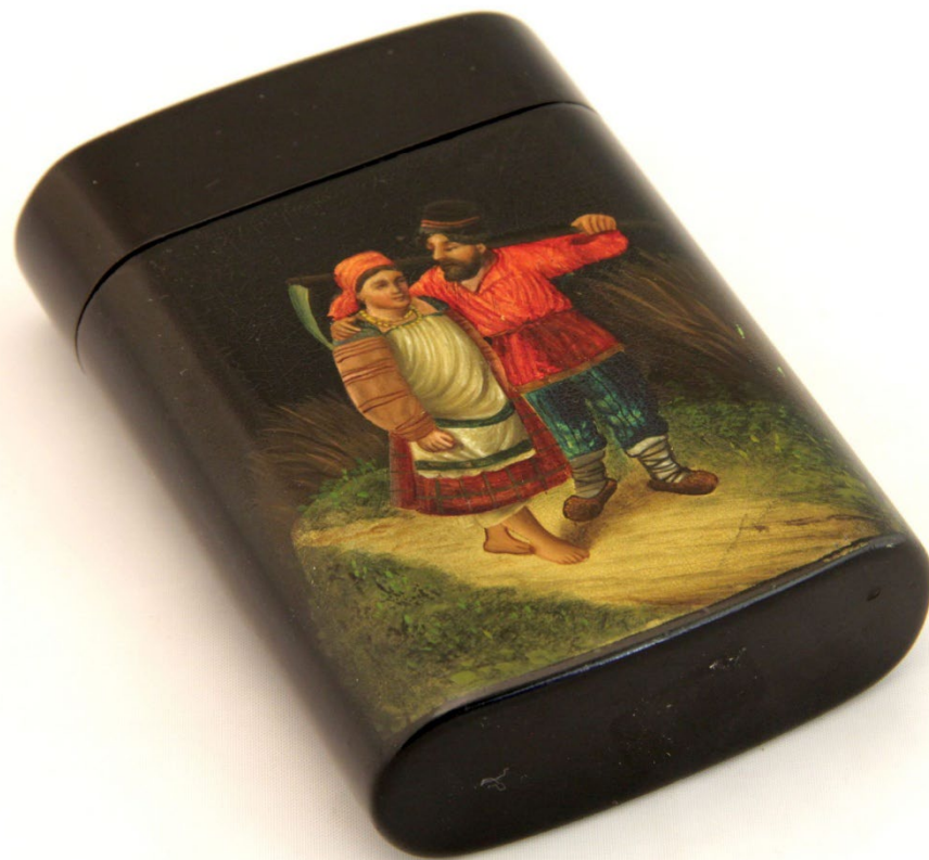
Коробка для папирос Папье-маше, лаковая роспись Фабрика Вишнякова. Начало XX в.