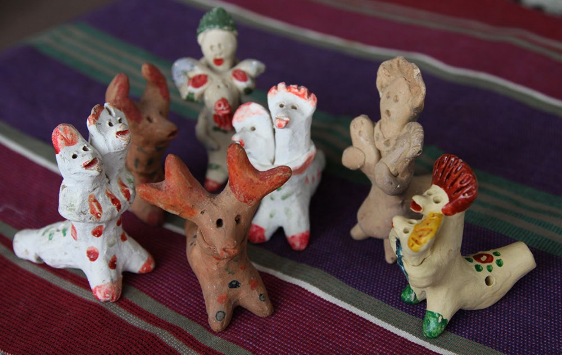
Хлудневский промысел родом из деревни Хлуднево Думиничского района Калужской области

Где кроме гончарного промысла был и другой - "бабий" промысел - изготовление глиняной игрушки, что поддерживало, так как местные глинистые почвы были не урожайны. Игрушки лепили женщины и девочки, начиная с 7-8 лет, в свободное от сельских работ время. Гончарный промысел в Хлудневе развивался до середины 1950-х гг. Мужчины возили свои изделия на рынки, и благодаря глиняным игрушкам торговля у них шла гораздо лучше, чем у других.