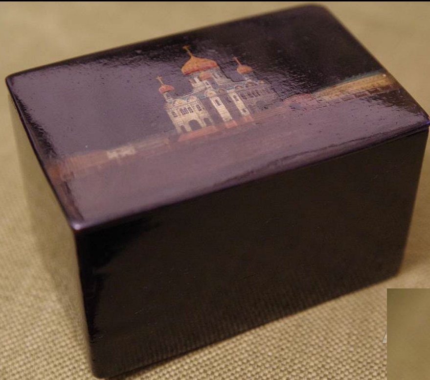
Старинная расписная лаковая шкатулка с изображением храма Христа Спасителя (8,5х13,5х8,5 см). Папье-маше, роспись, лак Фабрика Вишнякова. XIX в.

Главное отличие русского лака от европейского — ярко выраженный национальный колорит. Мастера переносили на шкатулки картины русских художников и сценки из деревенской жизни.