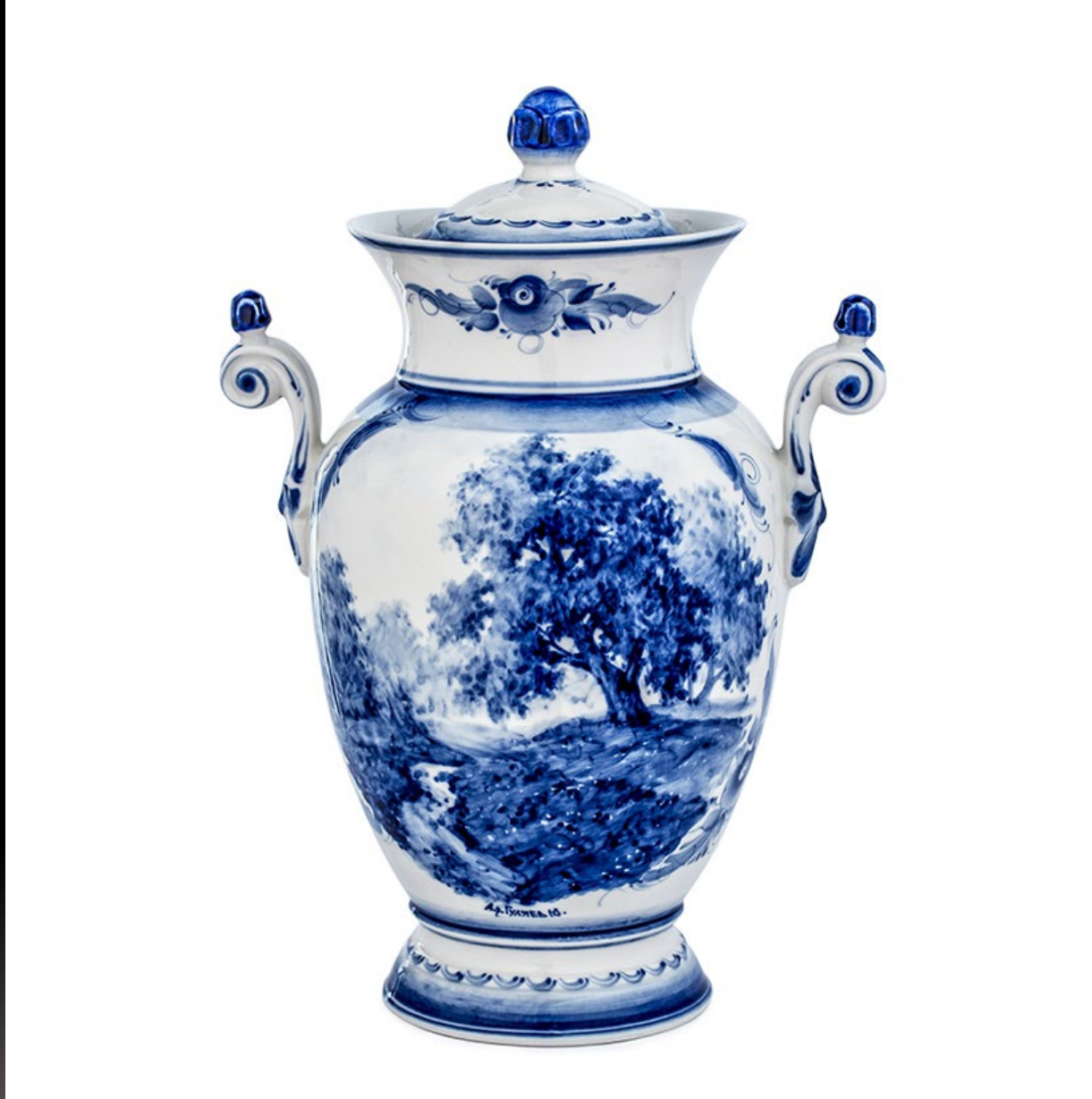
Сюжетная роспись. Ваза