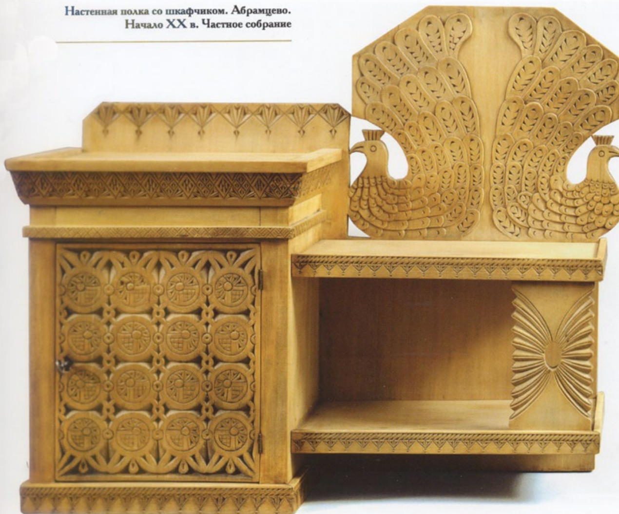
Настенная полка со шкафчиком. Дерево (липа), резьба трехгранно-выемчатая, тонировка, вошение Абрамцево. Начало XX в.

Значение Абрамцева как центра художественно-общественной жизни связано с возвращением и интерпретацией понятия «русский стиль», к которому активно обратилась русская элита на рубеже XIX-XX вв. Новое прочтение русского стиля выразилось в глубоком интересе к старинным формам, орнаментам, мотивам, постижением внутренних законов создания древнерусских образцов искусства.