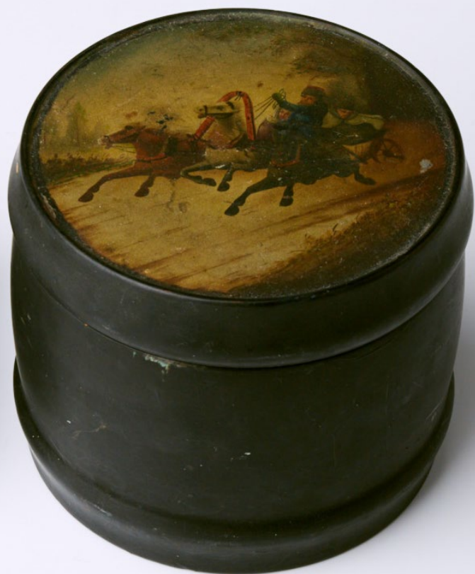
Шкатулка-чайница. Папье-маше, лаковая роспись В.О. Вишняков. Россия