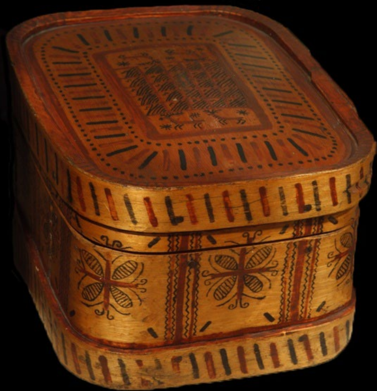
Короб (49х32,5х22,5 см). Дерево; резьба, роспись с. Палашелье. Мезенский уезд. Архангельская губ. Конец XIX– начало XX вв.

Музейное объединение «Культура русского Севера» г. Архангельск. Россия