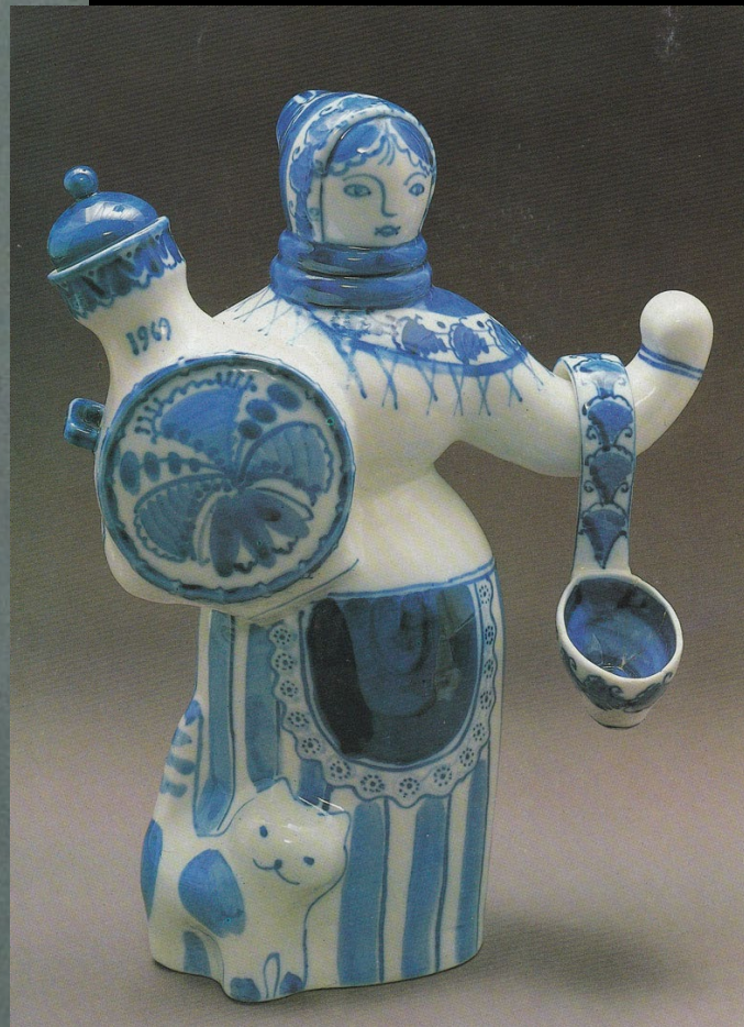
Квасник. Гжель. 1969 г. 2 половина XX в.

Ручное изготовление, которое остается важнейшей особенностью народного искусства, придает гжельскому фарфору особый колорит. Веселая и праздничная, сказочная и реальная жизнь, доброта и сообразительность объединились в искусстве из Гжели. В голубой росписи, в мягком мерцании белого фарфора, радость жизни, своего рода ощущение свежести и праздничности без лишней пышности.