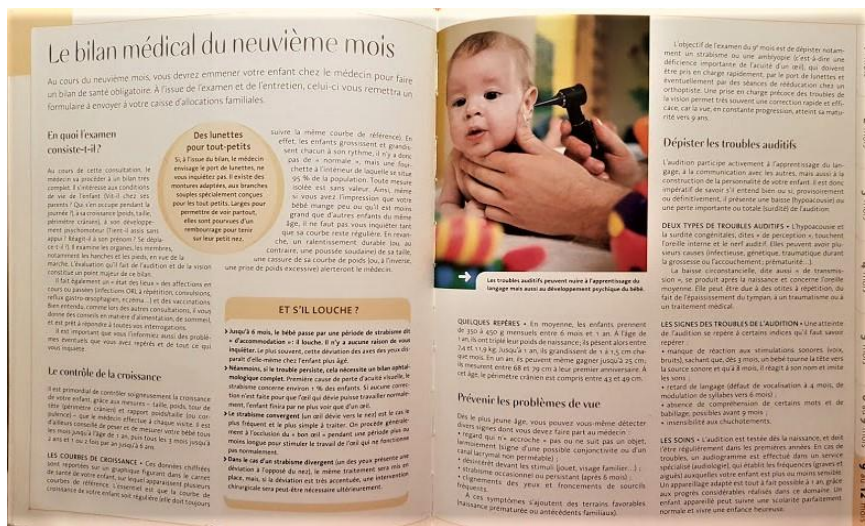
Иллюстрация 1. Разворот энциклопедии для родителей [Le Petit Larousse des 0 à 3 ans 2009: 232].

В шрифто-графическом оформлении рубрики прослеживается единый стиль, что также делает текстовое поле удобочитаемым . Цвета могут вызывать не только образные ассоциации, но и провоцировать на определенный спектр чувств, воспоминания и личностные переживания. Именно поэтому авторы энциклопедии используют бежевый, светло-зеленый, голубой и светло-сиреневый цвета .