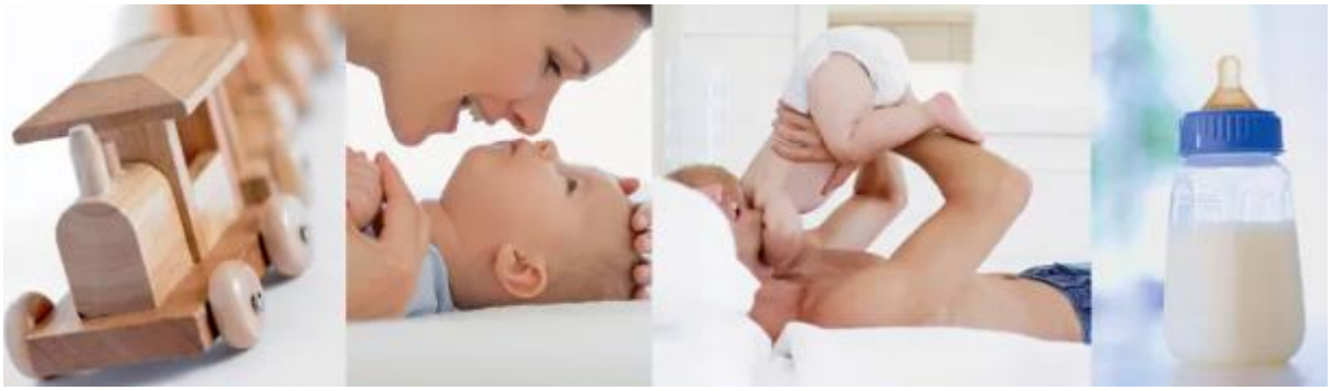
Иллюстрации 2, 3, 4, 5. Фотографии на полях энциклопедии [Le Petit Larousse des enfants de 0 à 3 2009: 24]

В каждой рубрике присутствуют поликодовые текстовые вставки , которые отличаются от общего текстового поля своим содержанием и графическим оформлением, а также могут менять свое местонахождение на развороте. Издатели энциклопедии усилили визуальное восприятие текста подобных вставок с помощью обрамления, шрифтового многообразия, цветового оформления [см. Илл. 6, 7, 8].