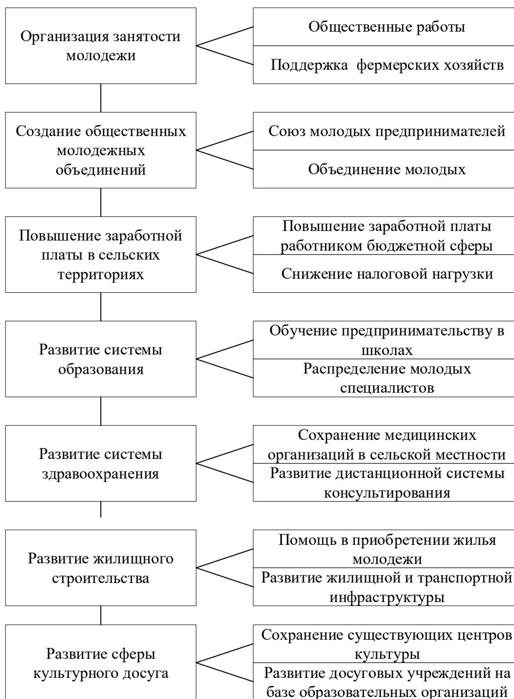
Рис.22 - Мероприятия по развитию трудового потенциала сельской молодежи Республики Калмыкия

Каждое из обозначенных направлений должно реализовываться с учетом конкретных потребностей молодежи, которые находятся в постоянной трансформации. Современные информационно-коммуникационные технологии позволяют взаимодействовать с населением при разработке и внедрении социально значимых программ и проектов, это позволит