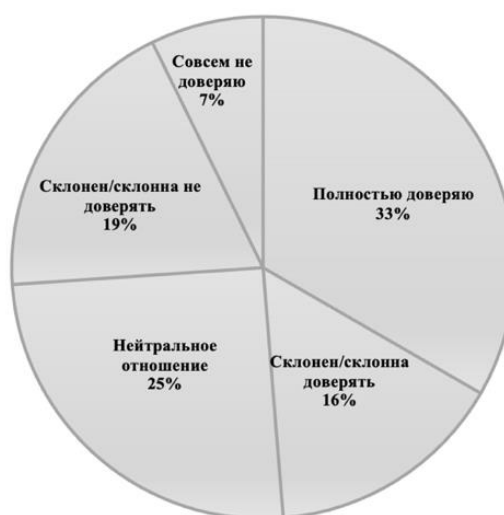
Диаграмма 1. Распределение ответов респондентов на вопрос «Насколько вы доверяете некоммерческим организациям?»

Второй параграф второй главы носит название « Молодежные некоммерческие организации: роль в развитии кадрового резерва ». В его рамках исследовался опыт некоммерческих организаций, проводящих конкурсы и проекты по формированию кадрового резерва для различных организаций среди молодежи. Так, был проведен опрос участников конкурса в области кадрового резерва «Школа лидерства в здравоохранении», прошедших все этапы конкурса и получивших возможность пройти стажировку в тех или иных организациях. Всего в опросе приняли участие 53 человека в возрасте от 18 до 24 лет. Конкурс «Школа лидерства в здравоохранении» проводится Всероссийским общественным движением добровольцев в сфере здравоохранения «Волонтеры-медики» и Общероссийской общественной организацией «Российский Красный Крест». В ходе опроса важно было понять отношение непосредственных участников к эффективности проведения подобных конкурсов. Результаты ответа на вопрос можно увидеть на Диаграмме 2.