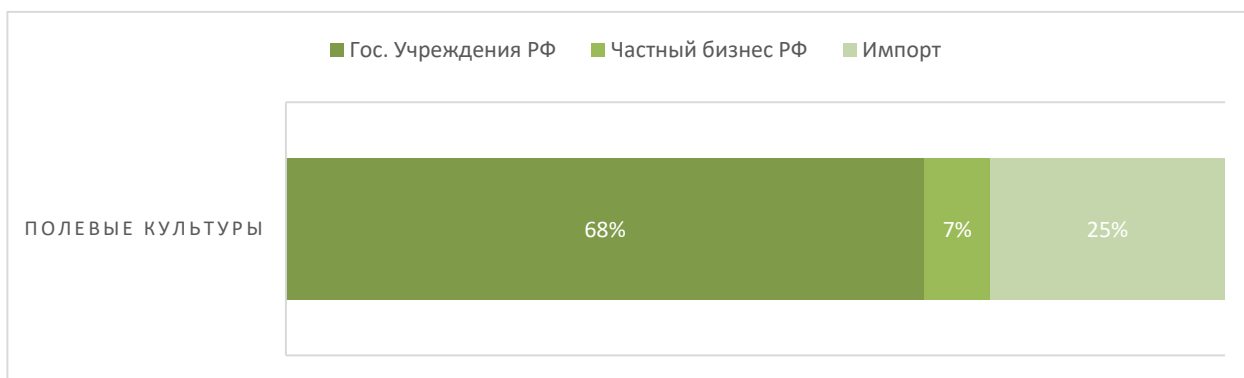
Рисунок 1 - Структура посевных площадей по оригинаторам семян в 2019 г.

По имеющимся данным, доля импорта составляет четверть всего рынка семян. Однако для более детального анализа необходимо учитывать показатели по основным культурам (см. таблицу 2). Ниже представлена структура отечественного селекционного рынка по отдельным видам сельхозкультур.