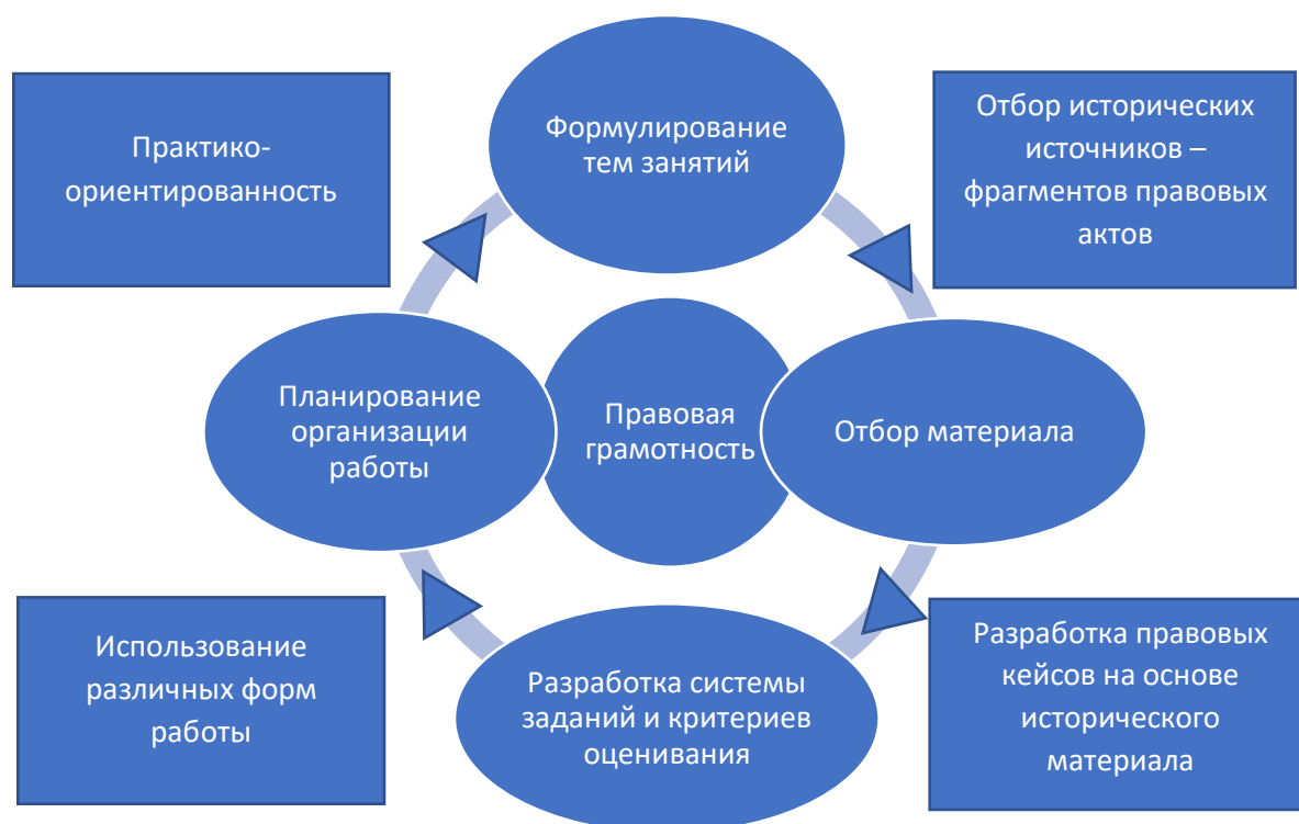
Схема 1. Алгоритм планирования учителем истории работы по формированию правовой грамотности обучающихся при изучении курсов истории.

В ходе исследования были разработаны практические рекомендации по организации образовательного процесса, ориентированного на формирование правовой грамотности у обучающихся при изучении курса истории России. Ключевые положения рекомендаций можно представить в виде схемы (Схема 1).