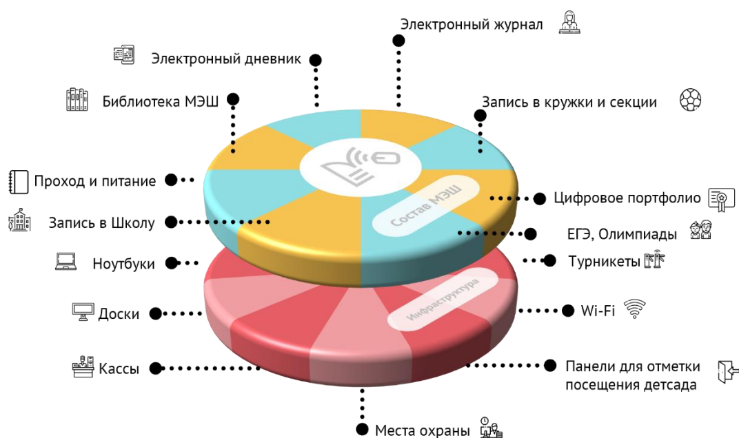
Схема. Инфраструктура и сервисы Московской электронной школы

При реализации программы основного общего образования каждому обучающемуся, родителям (законным представителям) несовершеннолетнего обучающегося в течение всего периода обучения обеспечен доступ к информационно-образовательной среде школы через высокотехнологическую платформу Московская электронная школа.