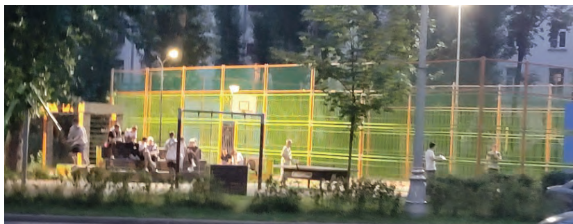
Рис. 2. Локация А

Молодой человек, инициировавший общение с экспертом, обосновал выбор этой площадки тем, что на ней «удобно тусить», «у старших нет вопросов» и еще «с других лавочек в тени нас гоняют». В данной локации подростки собираются часто большими группами (по 15–20 человек). В основном они сидят на подиумах, пьют прохладительные напитки, громко и активно общаются.