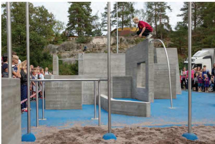
Рис. 6. Пространство для паркура Tyresö Parkour, 135 Park