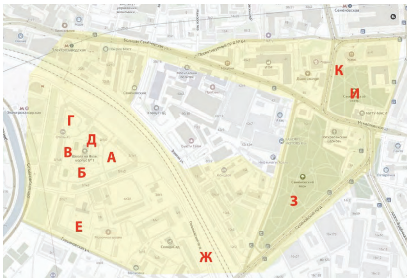
Рис. 1. Исследуемая территория и места, которые были заняты подростками

Первое наблюдение проводилось днем 29 июня 2022 года в локациях, выделенных желтым цветом на рисунке 1. Места, в которых были обнаружены подростки, отмечены на карте буквами. Температура на улице составляла около + 30^{\circ}\text{C} , солнечно. Второй обход тех же локаций совершен вечером 27 июля 2022 года. День был жарким, температура выше + 30^{\circ}\text{C} , вечером прохладнее. На улице заметно много людей. Эксперт не делала попыток контакта с подростками, но в локацию А молодой человек сам подошел пообщаться.