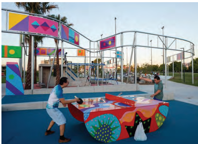
Рис. 7. Молодежный парк Julia Reserve Youth Park