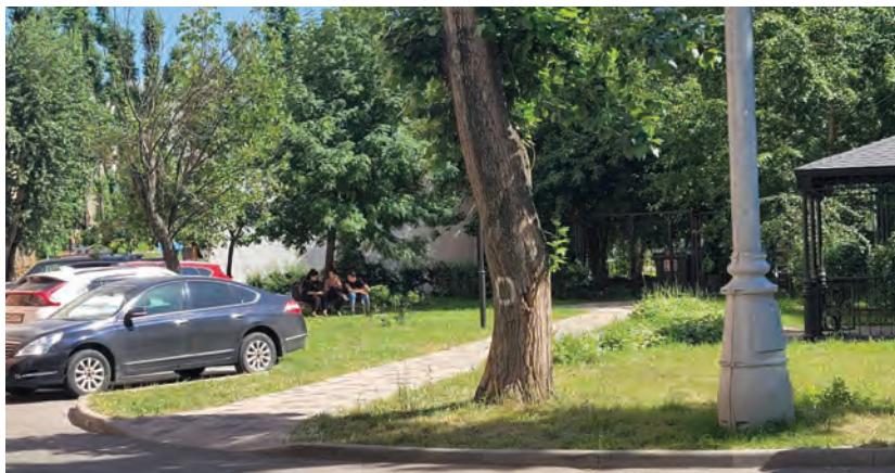
Рис. 3. Подростки на лавочке в тени у дома

Локации Г, Д представляют собой небольшие благоустроенные зоны с лавочками, предназначенные для взрослых. Когда лавочки свободны, подростки охотно собираются там небольшими группами, тихо общаются или смотрят в смартфоны (рис. 3).