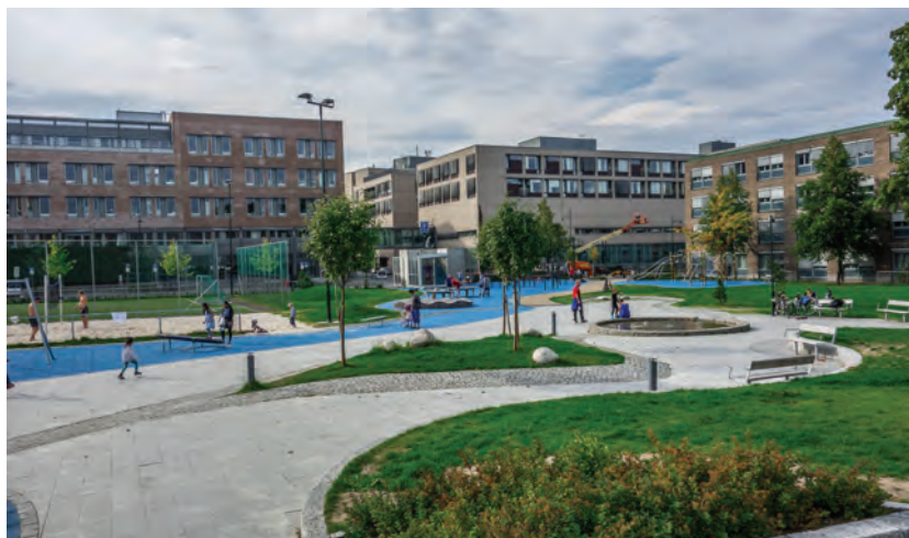
Рис. 5. Общественное пространство Finalebanen

Норвегия. Общественное пространство Finalebanen (рис. 5), расположенное в центре города Тронхейм на крыше паркинга. Находится в сквере, который ранее представлял собой большое футбольное поле. Заказчик — застройщик подземной парковки.