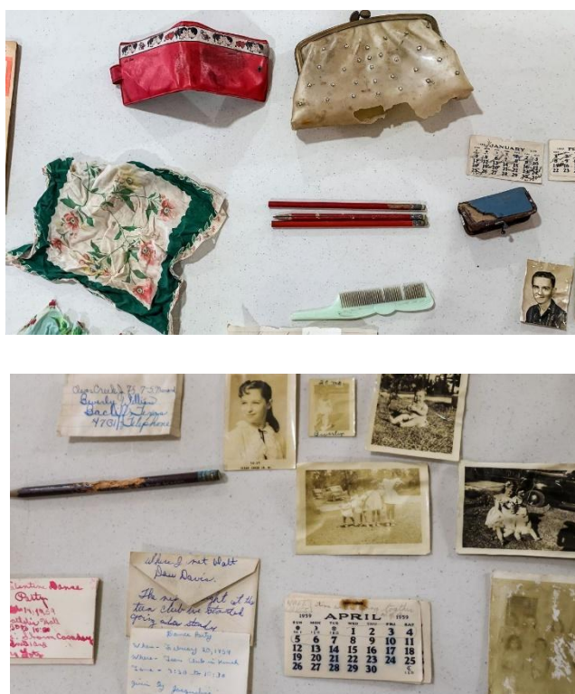
Рис. 2. Артефакты, найденные во время ремонта исторического школьного здания в Техасе, США

Зарубежный опыт выявления артефактов учебной повседневности во время реконструкций школьных зданий также обширен. Так, во время ремонта исторического школьного здания в Техасе, США, подрядчики наткнулись на своего рода капсулу времени: сумочку 63-летней давности, которая когда-то принадлежала девочке-подростку. Подняв несколько половиц сцены в старом здании начальной и средней школы, строительная бригада обнаружила светло-розовый клатч, в котором находились личные вещи владелицы – записки, носовой платок, пилка для ногтей, карандаши, фотографии, мини-дневник и календарь на 1959 год (см. Рис. 2). Ученым удалось установить личность владелицы и найти ее потомков, которые получили уникальную возможность заглянуть в жизнь их родственницы в подростковом возрасте. Найденные исторические артефакты были сохранены городом и выставлены в музее обновленного здания (Kuta, 2022).