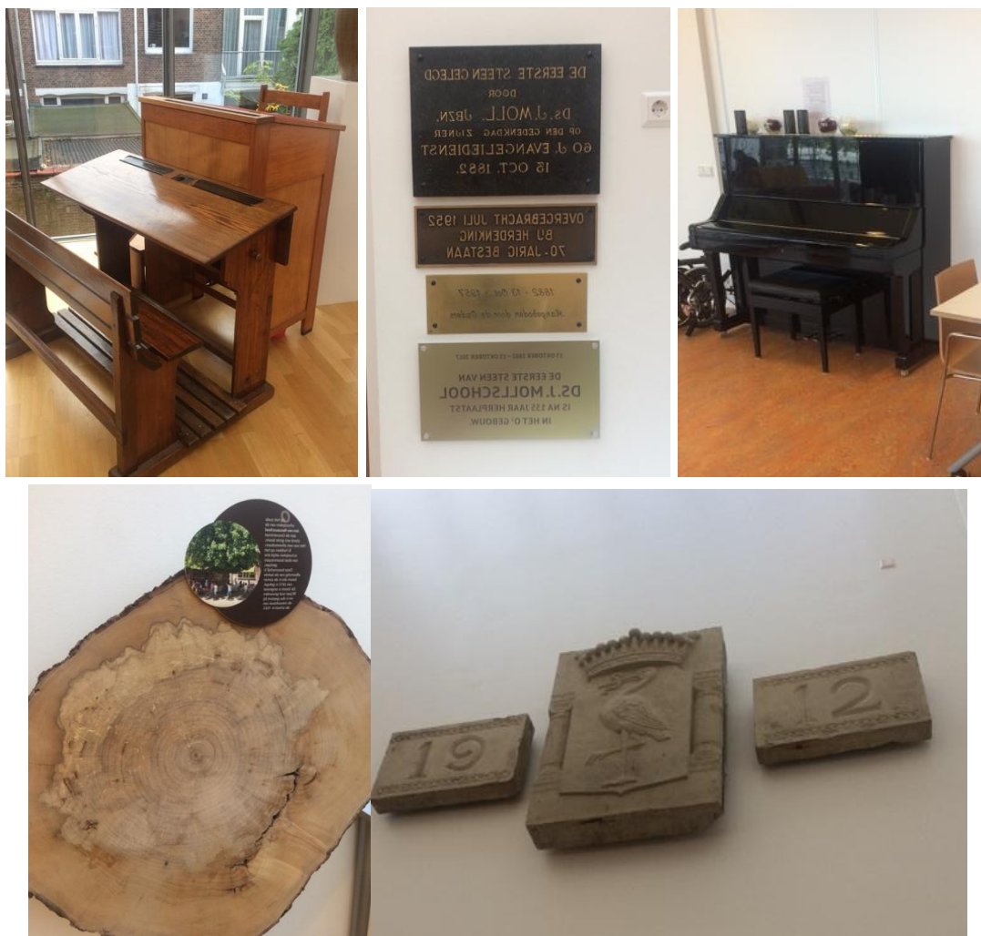
Рис. 7. Исторические артефакты учебной повседневности школы Гааги.

сохранить связь времен и показать богатую историю образовательной организации, были сохранены и размещены в интерьерах школы предметы учебной мебели (парты, фортепиано), таблички старого здания школы и срез дерева, которое запечатлено на старых фотографиях школьной территории (см. Рис. 7).