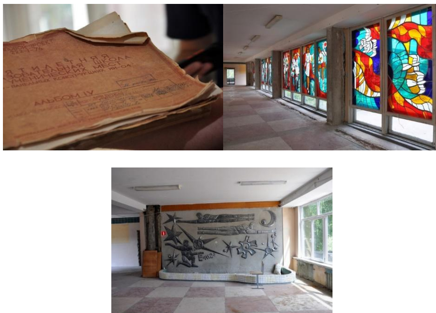
Рис. 4. Артефакты, найденные во время капремонта школы № 7 Белгорода

Во время капремонта школы № 7 в Белгороде был найден интересный артефакт – типовой архитектурный проект учреждения от 1972 года (см. Рис. 4). Документ сохраняют, отреставрируют и передадут в школьный музей. В школе демонтируют большую часть конструкций, но сохраняют и отреставрируют сохранившиеся разноцветные витражи и декоративные металлические элементы на стенах первого этажа (Ситкова, 2022).