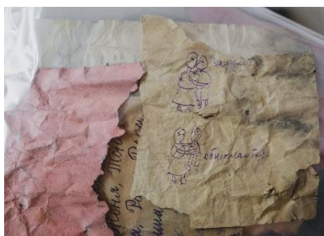
Рис. 1. Артефакты XIX и XX веков, найденные во время капитального ремонта в школе Перми