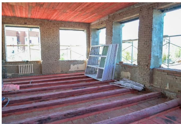
Рис. 3. Артефакты XIX века, обнаруженные во время реконструкции школы № 23 в Нижнем Тагиле