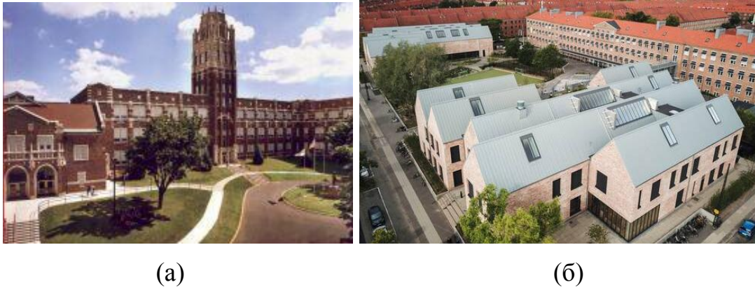
Рис. 6. Реконструкция с сохранением исторического облика. (а) Средняя школа Линкольна в Манитовоке, штат Висконсин, США, (б) школа Grøndalsvængets в пригороде Копенгагена, Дания

артефактов школьных зданий. Школа представляет собой почти 100-летнее здание, которое было дополнено новыми помещениями для занятий спортом, музыкой и обучением (см. Рис. 6). Успех проекта был достигнут благодаря повторному использованию 250 000 кирпичей из близлежащей ветхой больницы, что позволило сохранить местную эстетику и уменьшить воздействие на окружающую среду, а также бесшовной интеграции в существующие системы здания новых элементов (Souza, 2023).