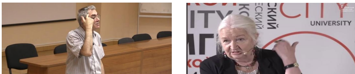
Рисунок 1 – примеры резонансных жестов

Особым средством воздействия на адресата в рамках публичной лекции становятся резонансные жесты , воплощающиеся с помощью знакового единства «языковое выражение + жест», в трактовке [Ирисханова 2018]: Эмблемы надо знать, их нельзя вычислить логически (В.И. Карасик 2016) – лектор касается головы, указывая на референта («мозг»), так как он отвечает за логические операции в организме человека; Вы стоите посреди джунглей на заре нашей человеческой истории (Т.В. Черниговская 2019) – лектор движением руки указывает на то, что осталось позади, актуализируя понимание адресатом зари в значении ранняя пора, начало, зарождение чего-либо, то, что осталось в прошлом (Рис. 1).