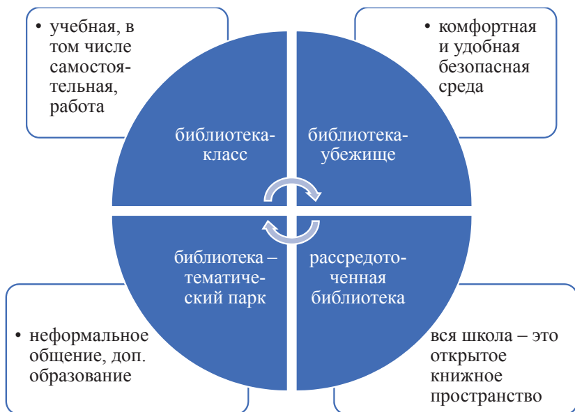
Рис. 1. Типология школьных библиотек

«Школьная библиотека начинает и выигрывает» 5 , в которой была описана типология библиотек в зависимости от образовательной или воспитательной задачи, решаемой школой за счет ресурса библиотеки (рис. 1).