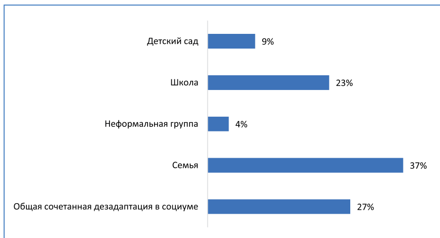
Рис. 1. Области проявления социальной дезадаптации обучающихся (в %)

При анализе обращений родителей в психологические службы школ стали очевидны основные области социальной дезадаптации обучающихся на дому (см. рис.1).