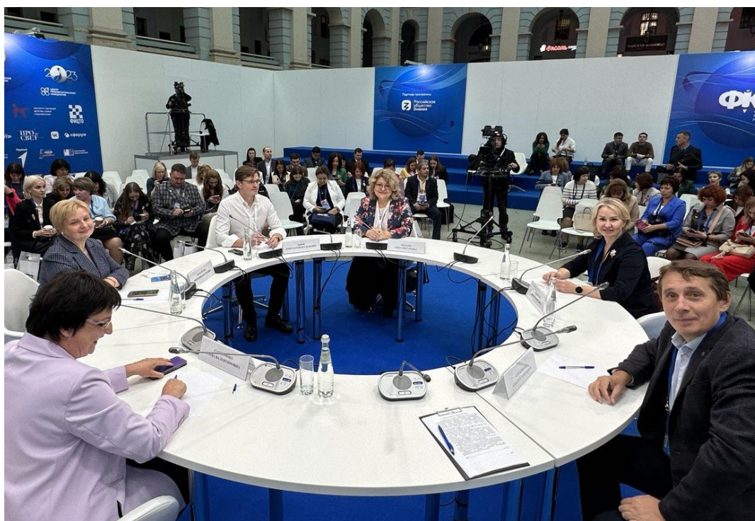
III Всероссийский форум классных руководителей, октябрь 2023