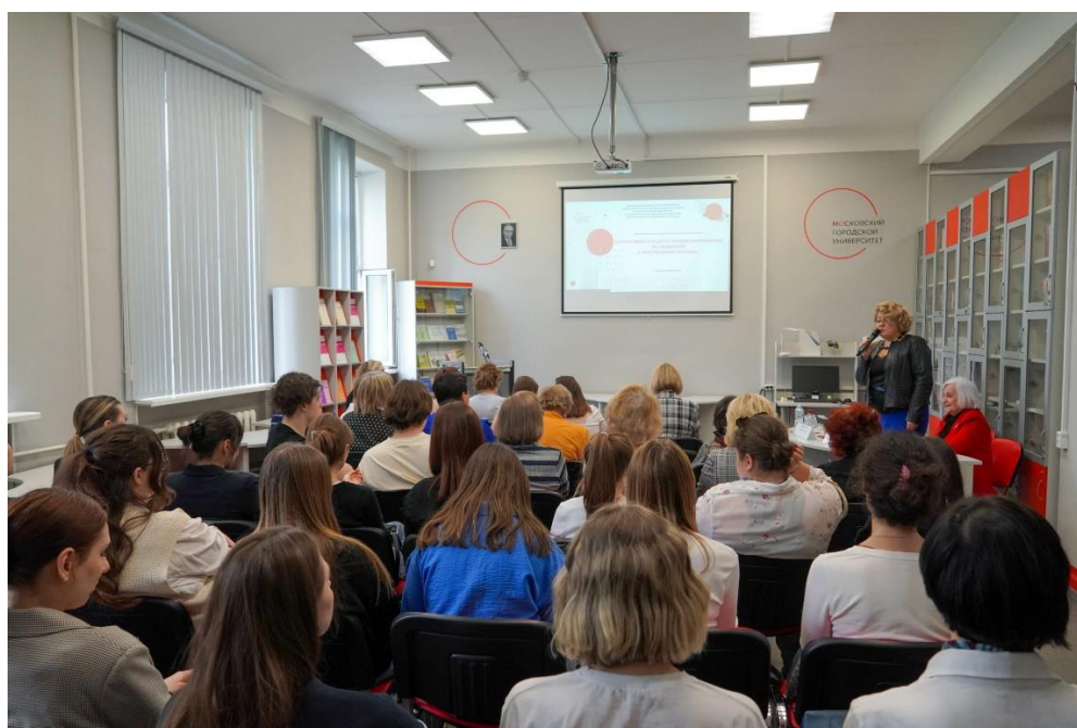
Научно-практическая конференция с международным участием «Когнитивные процессы: междисциплинарные исследования и интегративная практика», апрель 2024