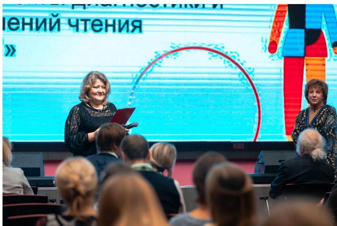
Научно-практическая конференция «Прикладные аспекты диагностики и коррекции нарушений чтения и письма у детей», в рамках V Всероссийской недели осведомленности о дислексии, октябрь 2023