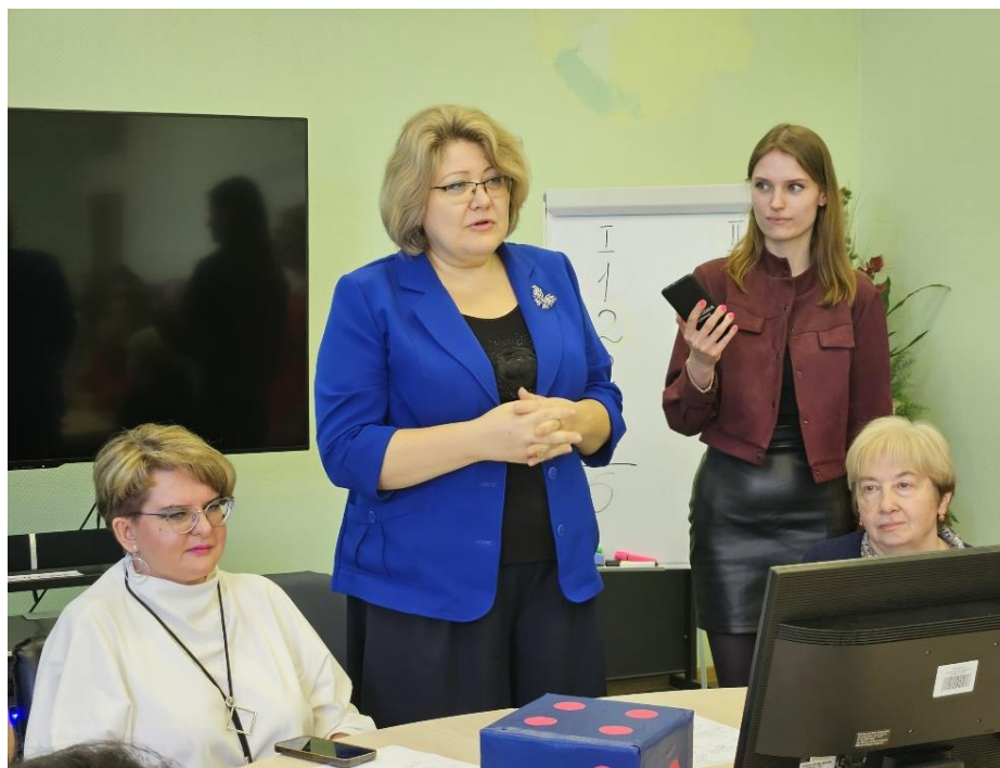
Научный турнир «Этика профессионального общения» в Институте психологии и комплексной реабилитации, апрель 2024