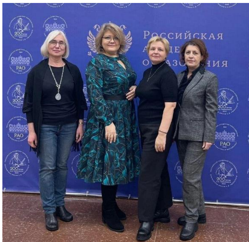
Научная конференция «Проблемы качества диссертационных исследований в области наук об образовании», ноябрь 2023