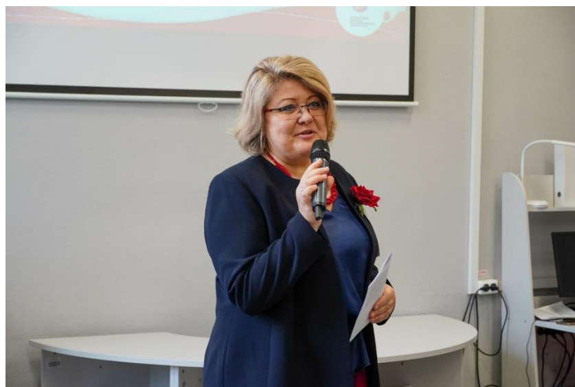
Фестиваль инклюзивных практик в дополнительном образовании (с международным участием) в Институте психологии и комплексной реабилитации, апрель 2024