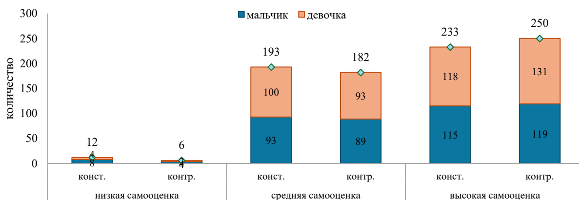
Рисунок 3 – Сравнительные данные уровней развития самооценки обучающихся (констатирующий и контрольный этапы исследования, в числовом значении)

Для определения степени влияния 7 категорий мотивов на самооценку обучающихся использовалась формула Logit и осуществлялся упорядоченный logistic (логистический регрессионный) анализ, где в качестве независимых переменных принимались мотивы: познавательные, коммуникативные, эмоциональные, саморазвития, одобрения, а зависимой переменной - уровень самооценки учащегося. В результате анализа значение псевдо-R-квадрата составило 0.744 (74.4%), это указывает на то, что независимые переменные (мотивы) влияют на изменения в самооценке обучающихся. В исследовании мотивы достижения успеха и мотивы позиции школьника приняты в качестве независимых переменных, а уровень самооценки – зависимой переменной. Проведение упорядоченного logistic анализа позволило получить значение псевдо-R-квадрата – 0.341, это означает, что мотивы достижения успеха, мотивы позиции школьника изменяют уровень самооценки обучающихся на 34.1%. Данные эксперимента выявили иерархию 7 категорий мотивов , влияющих на развитие самооценки обучающихся: мотивы саморазвития, познавательные мотивы, мотивы одобрения, мотивы достижения успеха, эмоциональные мотивы, коммуникативные мотивы, мотивы позиции школьника. По результатам контрольного этапа эксперимента установлена корреляция академической успеваемости и самооценки , с одной стороны, чем выше академическая успеваемость обучающегося, тем выше