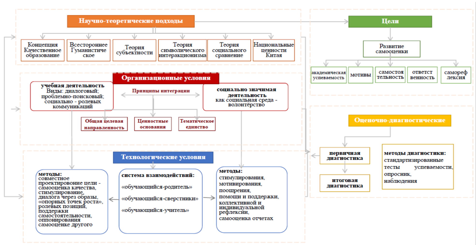
Рисунок 2 – Педагогические условия развития самооценки обучающихся начальной школы (5 класс) в Китае