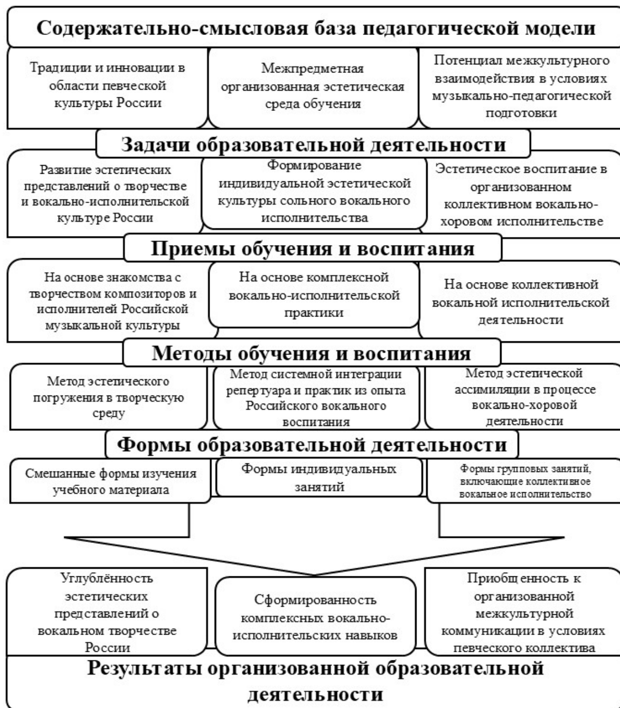
Рисунок 1. Модель музыкально-эстетического воспитания китайских студентов в условиях российского педагогического вуза средствами вокально-исполнительской деятельности

Все представленные компоненты содержания, а также включающие их механизмы взаимодействия в рамках проектируемой педагогической модели, можно выразить данной визуализацией, характеризующей направление и векторы достижения результата сбалансированного музыкально-эстетического воспитания китайских студентов.