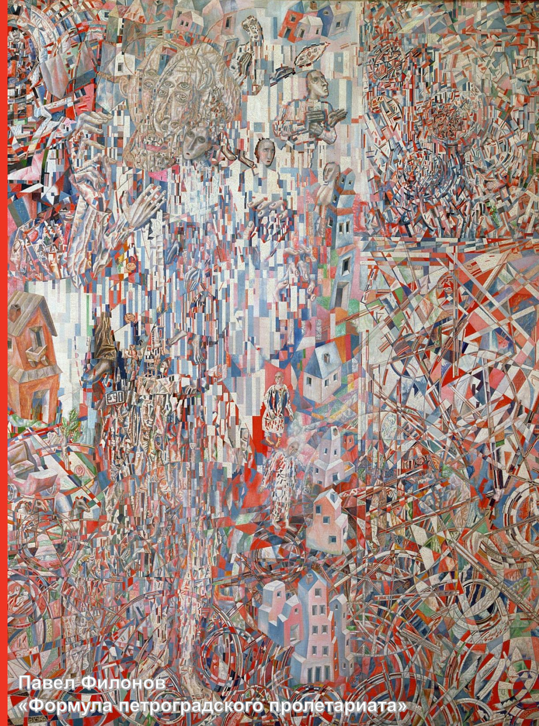
Павел Филонов «Формула петроградского пролетариата»