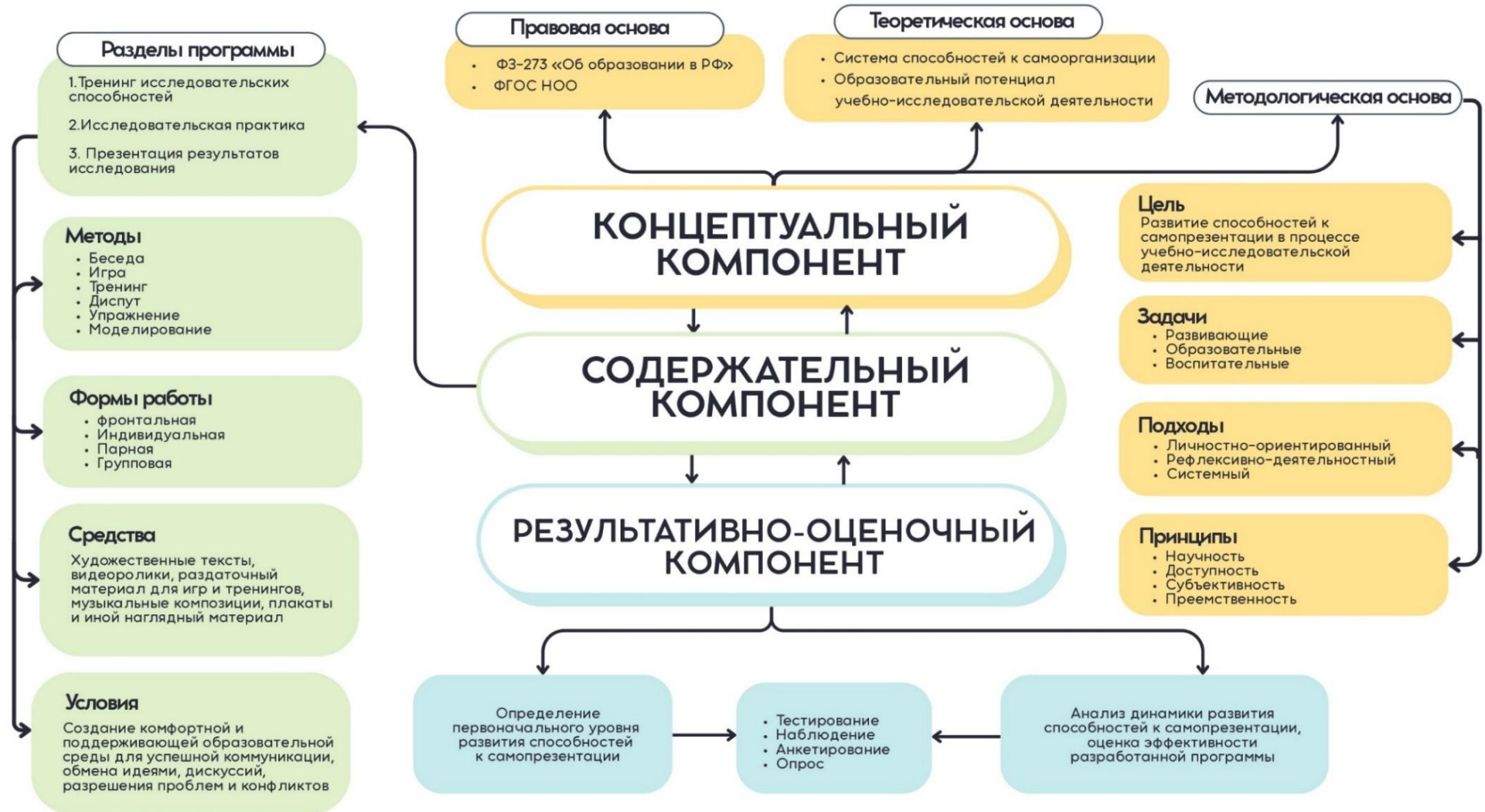
Рисунок 2 – Структурно-содержательная педагогическая модель развития способностей к самопрезентации младших школьников в процессе учебно-исследовательской деятельности