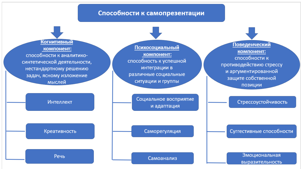
Рисунок 1 – Система способностей к самопрезентации младших школьников

Теоретический анализ позволил выявить систему способностей к самопрезентации младших школьников (Рисунок 1):