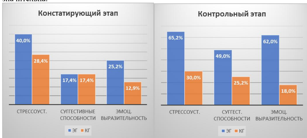
Рисунок 5 – Динамика развития поведенческого компонента способностей к самопрезентации в экспериментальной и контрольной группах

«саморегуляция» и «самоанализ», однако в экспериментальной группе она более значительна.