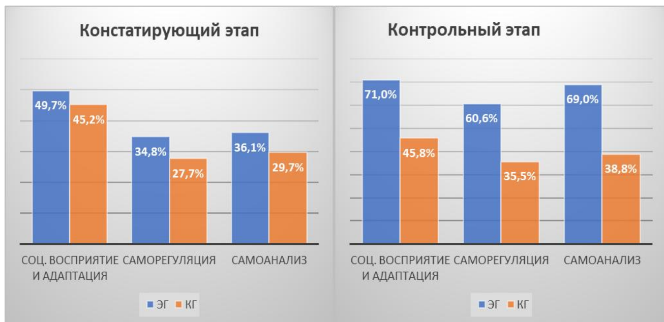
Рисунок 4 – Динамика развития психосоциального компонента способностей к самопрезентации в экспериментальной и контрольной группах

Из рисунка 3 видно, что показатель «интеллект» в экспериментальной группе остался стабильно высоким, в контрольной группе по нему можно отметить положительную динамику. Видимую динамику по показателю «креативность» можно отметить только в экспериментальной группе. Существенно возрос процент учащихся с высоким уровнем развития речи в экспериментальной группе. Развитие речи в контрольной группе осталось без существенной динамики.