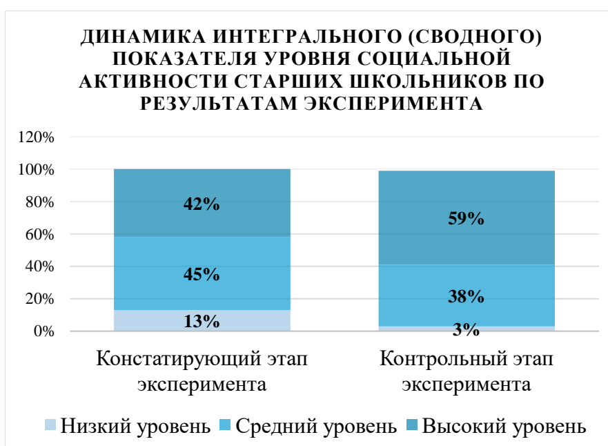
Рисунок 2 – Динамика интегрального (сводного) показателя уровня социальной активности старших школьников в контрольной группе по результатам эксперимента

Таким образом, уровень социальной активности старших школьников был рассчитан для констатирующего и контрольного этапа исследования. Полученные показатели сравнили между собой и сделали вывод об эффективности формирования социальной активности старших школьников в условиях интеграции общего и дополнительного образования. Динамика интегрального (сводного) показателя уровня социальной активности старших школьников в контрольной группе по результатам эксперимента представлена на Рисунке 2.