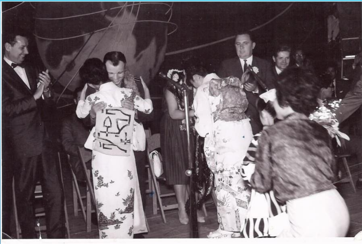
Поездка в Японию. Май 1962 г.